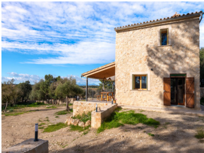
Außenansicht der Finca mit überdachter Terrasse und Weitblick