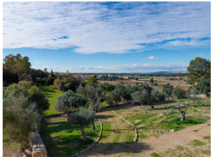
Weitläufiger Ausblick über Lloret de Vistalegre und die umliegenden