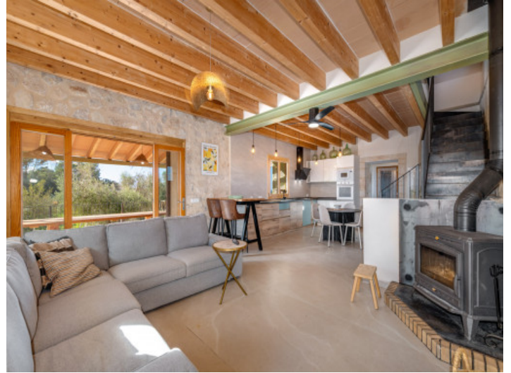
Wohnraum mit Kaminofen und Natursteinakzenten