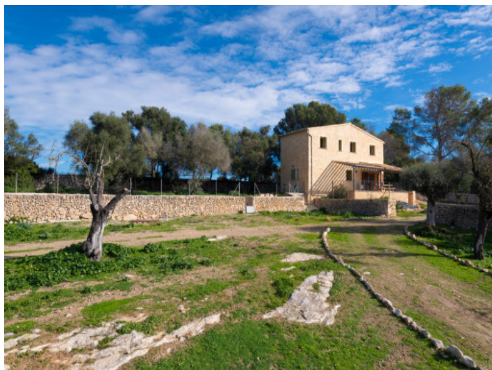
Großes Grundstück mit Olivenbäumen und typisch mallorquinischer Vegetation