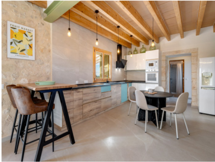
Große Wohnküche mit Essbereich und Holzbalkendecke