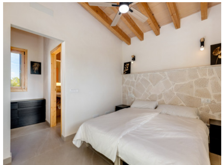
Schlafzimmer mit dekorativem Naturstein-Kopfteil, Deckenventilator und