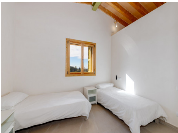
Gemütliches Schlafzimmer mit zwei Einzelbetten und Blick in die malerische Landschaft