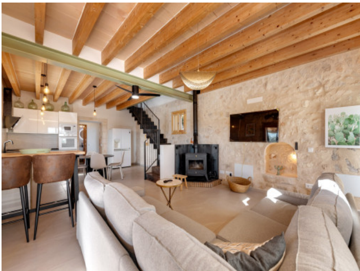
Heller Wohn-Essbereich mit Holzbalken und Kaminofen