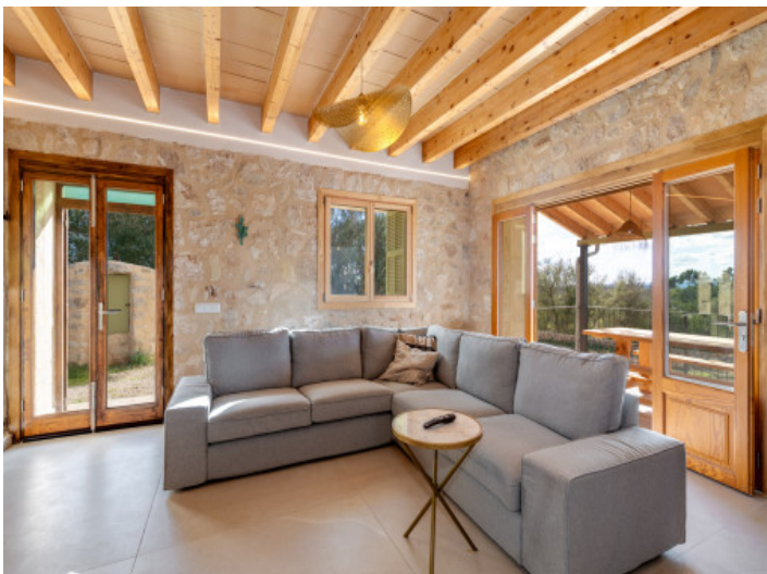
Gemütlicher Wohnbereich mit großen Fensterflächen