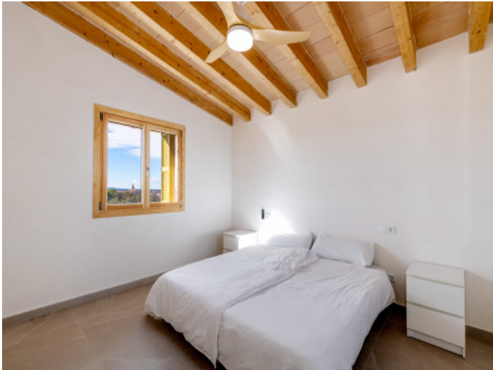
Helles Doppelschlafzimmer mit Deckenventilator