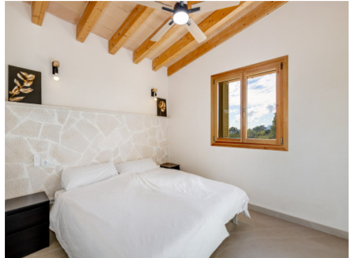
Schlafzimmer mit Natursteinwand und Deckenventilator