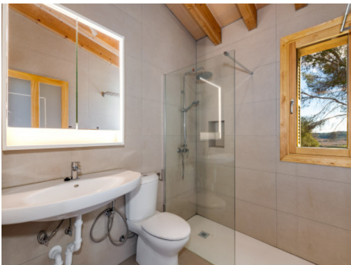
Badezimmer mit großer Dusche und Blick ins Grüne