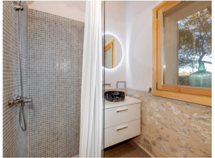
Bad mit Mosaikdusche und stilvollem Naturstein