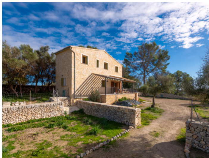
Außenansicht der Finca mit Natursteinfassade, überdachter Terrasse und mediterraner Umgebung

Alle Angaben nach bestem Wissen. Irrtum und Zwischenverkauf vorbehalten. Dieses Exposé ist eine Vorinformation, als Rechtsgrundlage gilt allein der notariell abgeschlossene Kaufvertrag.