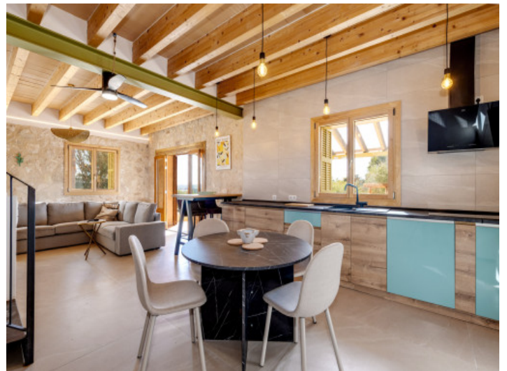
Wohnküche mit hellem Tageslicht und moderner Ausstattung