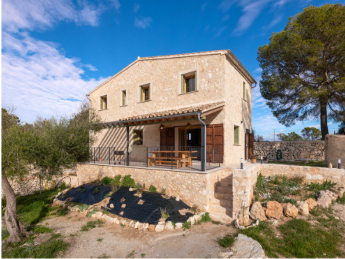
Charmante Finca in Lloret de Vistalegre