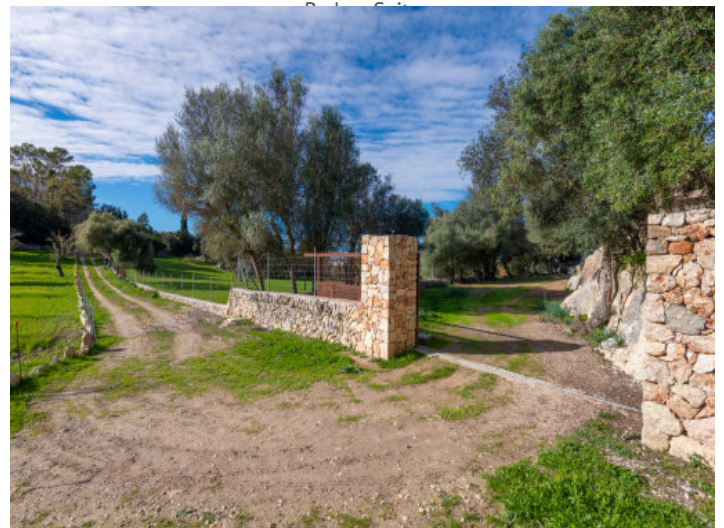
Zufahrt der Finca mit Natursteinmauern und alten Olivenbäumen

Alle Angaben nach bestem Wissen. Irrtum und Zwischenverkauf vorbehalten. Dieses Exposé ist eine Vorinformation, als Rechtsgrundlage gilt allein der notariell abgeschlossene Kaufvertrag.