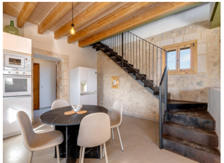
Essbereich mit Natursteinwand und offenem Raumkonzept

Alle Angaben nach bestem Wissen. Irrtum und Zwischenverkauf vorbehalten. Dieses Exposé ist eine Vorinformation, als Rechtsgrundlage gilt allein der notariell abgeschlossene Kaufvertrag.