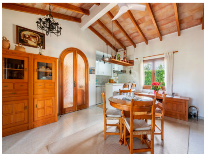
Essbereich mit Küche