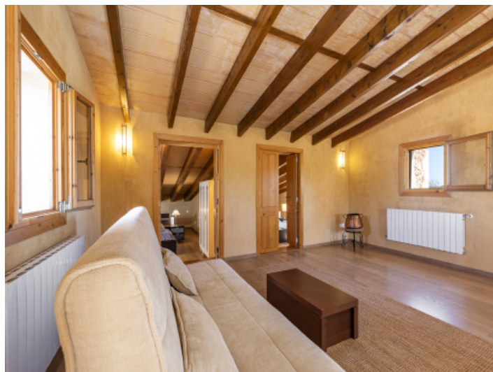
Wohnzimmer im Obergeschoss