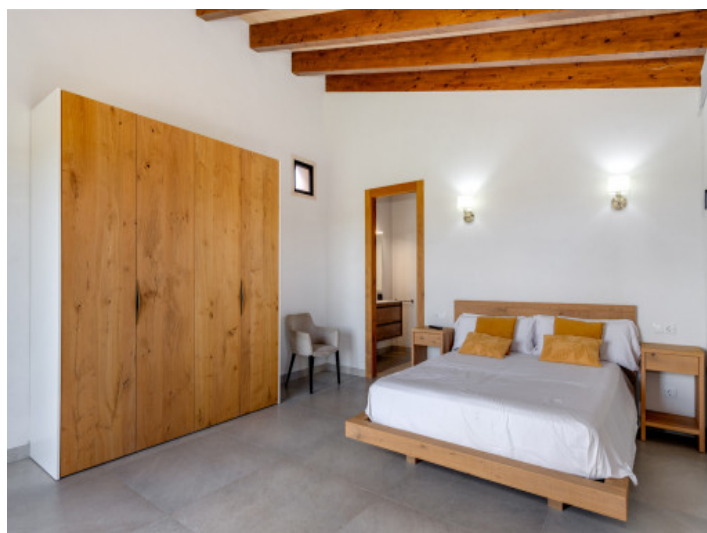
Eines der drei Schlafzimmer im Erdgeschoss mit Badezimmer en Suite...