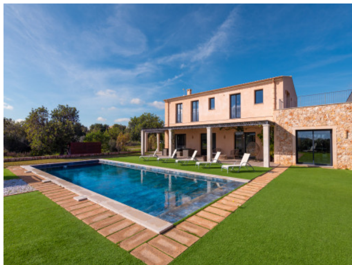
74qm grosser Pool