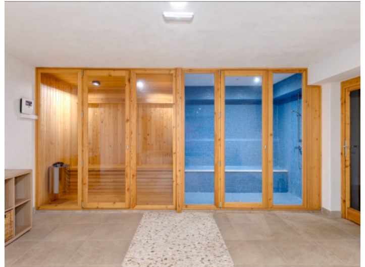
Spabereich im Untergeschoss