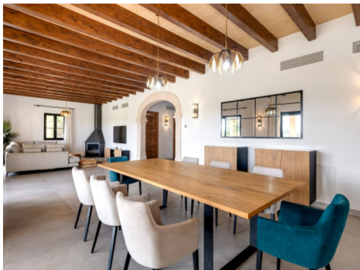
Geräumiger Wohn und Essbereich