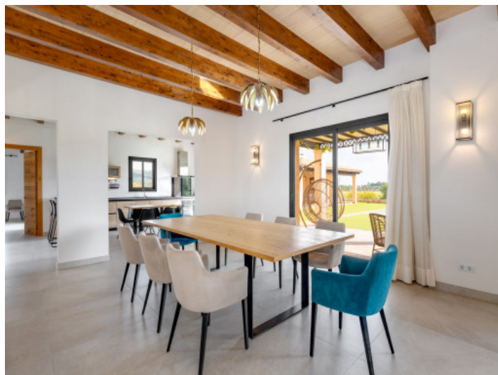
Helles offenes Wohnen