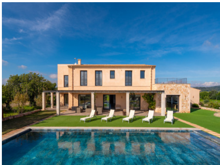
Finca in absolut ruhiger Lage