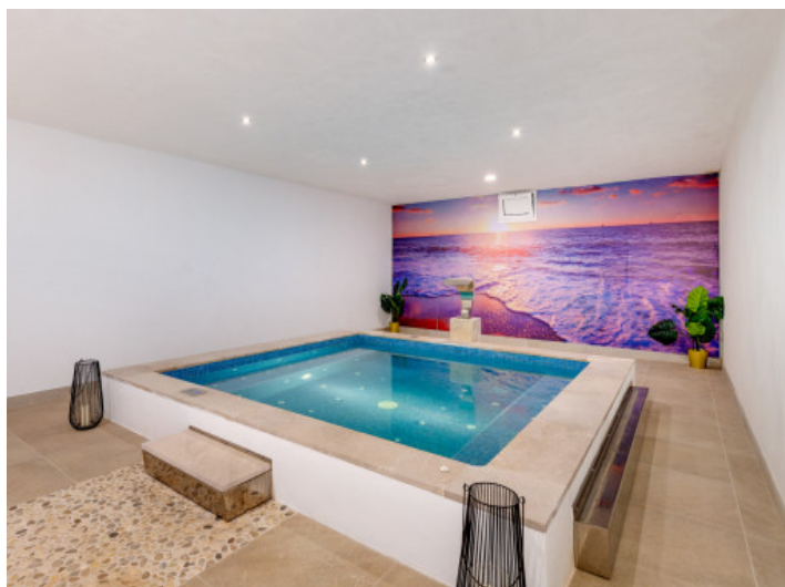
Spabereich im Untergeschoss