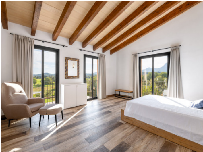
Weiteres Schlafzimmer im Obergeschoss mit Blick...