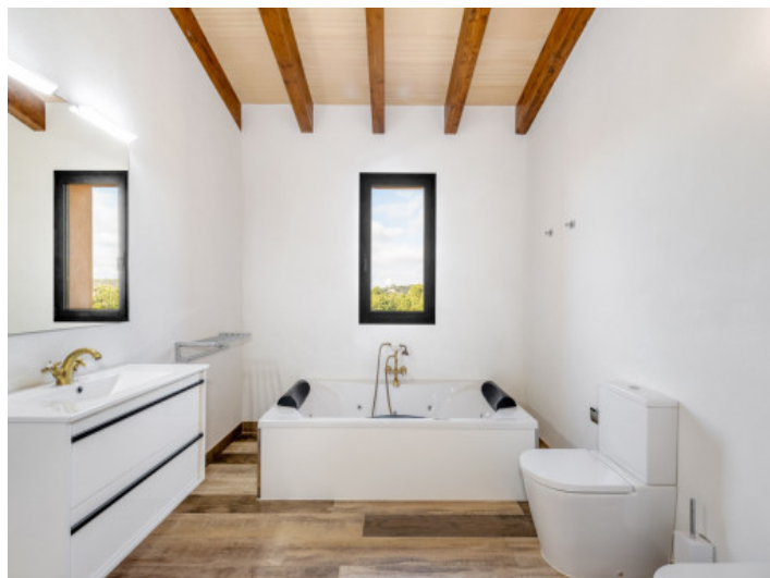
Badezimmer mit Badewanne