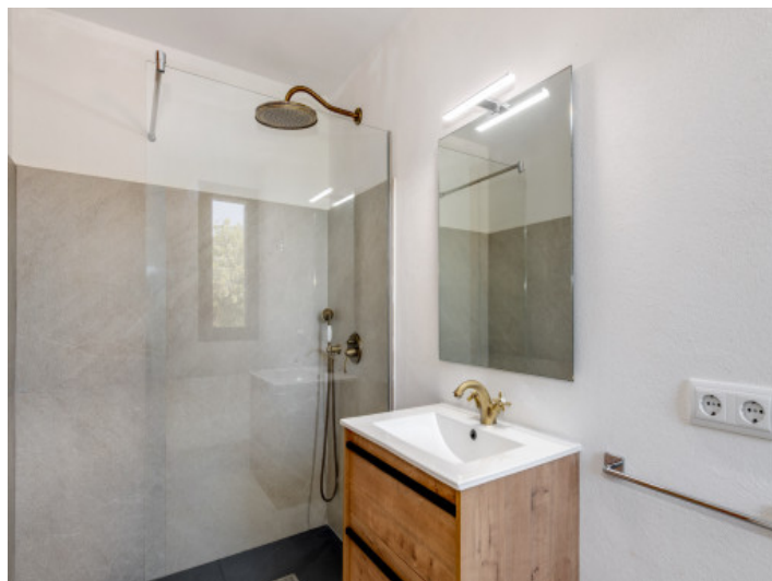
Eines der 6 modernen Badezimmer