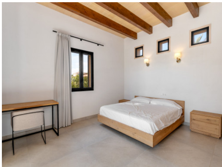
Zweites Schlafzimmer im Erdgeschoss