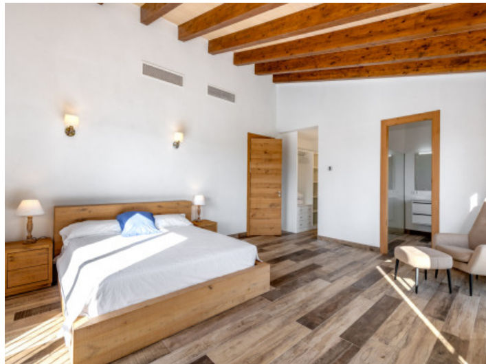
...und Badezimmer en Suite und begehbaren Kleiderschrank