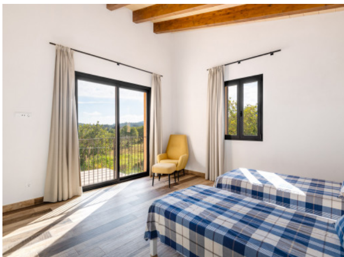
Drittes Schlafzimmer im Obergeschoss