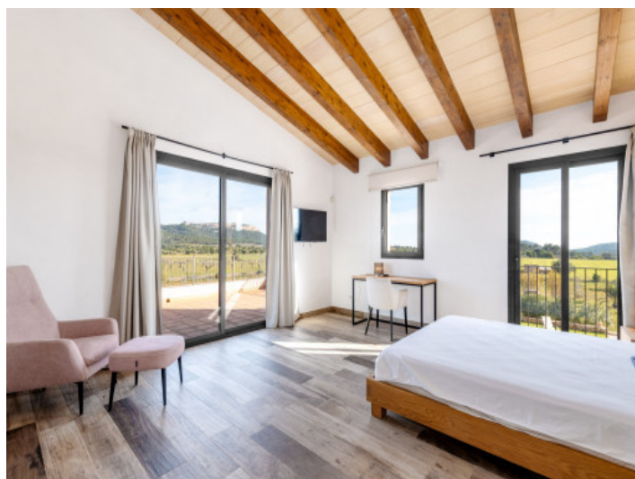
Eines der drei Schlafzimmer im Obergeschoss mit privater Terrasse...