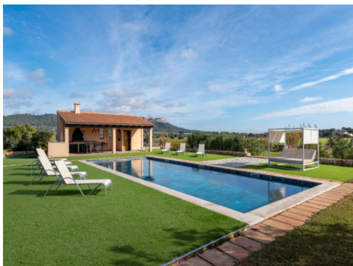
Weitblick und überdachte Barbecuebereich beim Pool