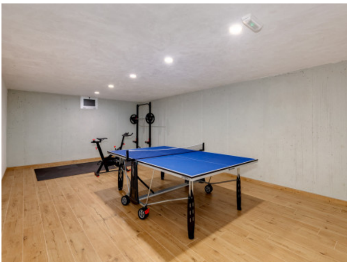
Fitnessraum und Tischtennistisch