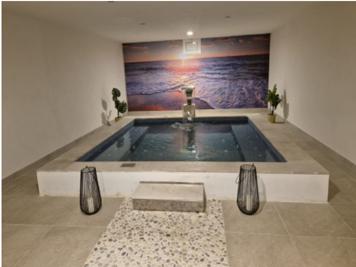
Spabereich im Untergeschoss