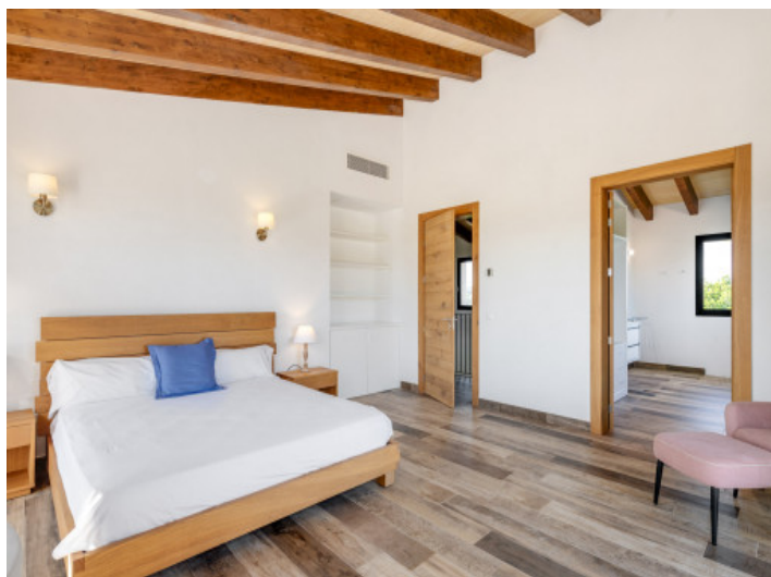
...und Badezimmer en Suite