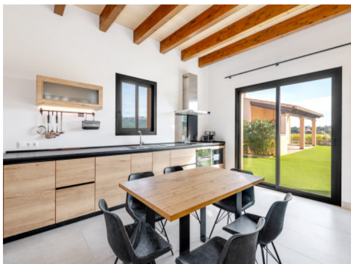
Küche mit Blick ins Grüne