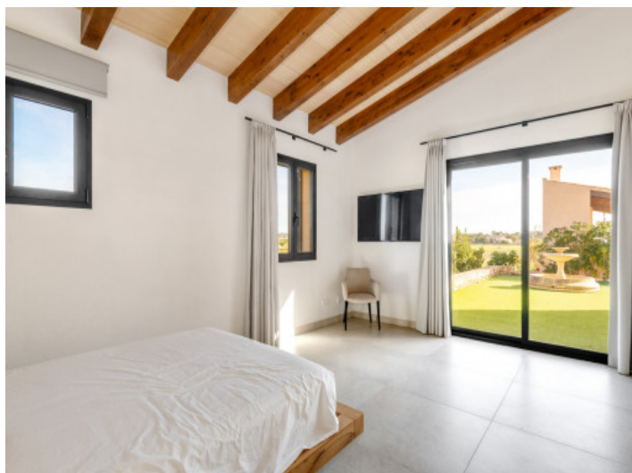
...und Zugang zur Terrasse