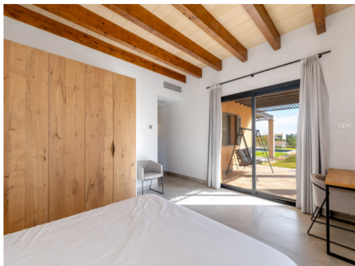
Zweites Schlafzimmer im Erdgeschoss

Alle Angaben nach bestem Wissen. Irrtum und Zwischenverkauf vorbehalten. Dieses Exposé ist eine Vorinformation, als Rechtsgrundlage gilt allein der notariell abgeschlossene Kaufvertrag.