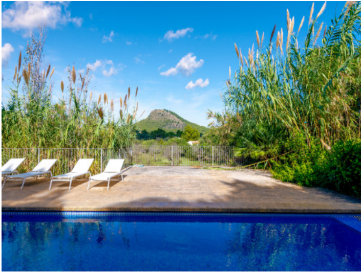
Sonnenmomente am Pool mit weitem Blick in die Natur