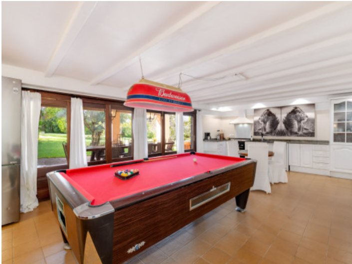
Offene Küche im unteren Bereich mit Billardtisch