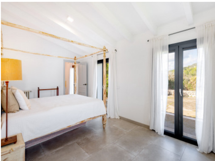
Schlafsuite im unteren Bereich mit direktem Zugang zum Garten