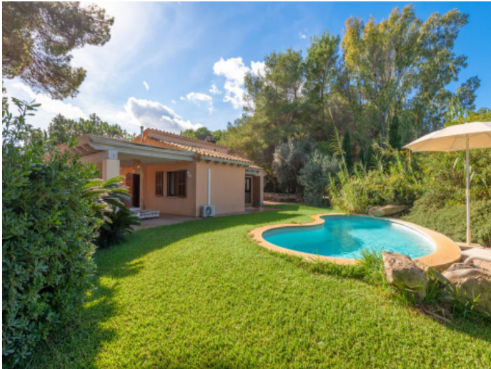
Zweiter Bungalow mit Poolbereich und ETV für 4 Personen