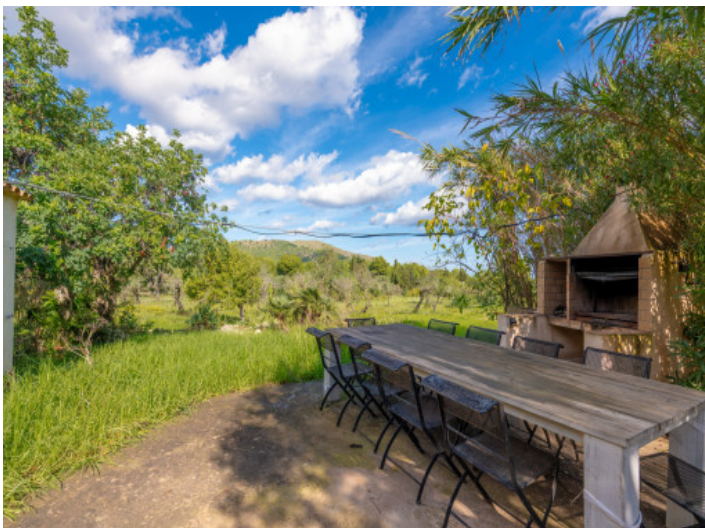
Barbecuearea im Garten