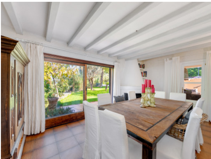
Heller Essbereich mit Verbindung zum Garten