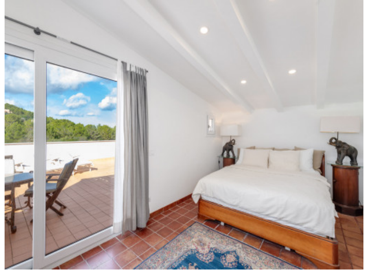
Romantisches Schlafzimmer im oberen Bereich mit heller Atmosphäre