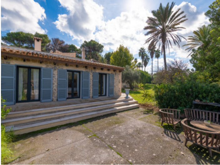
Indischer Flügel von außen auf der Gartenseite