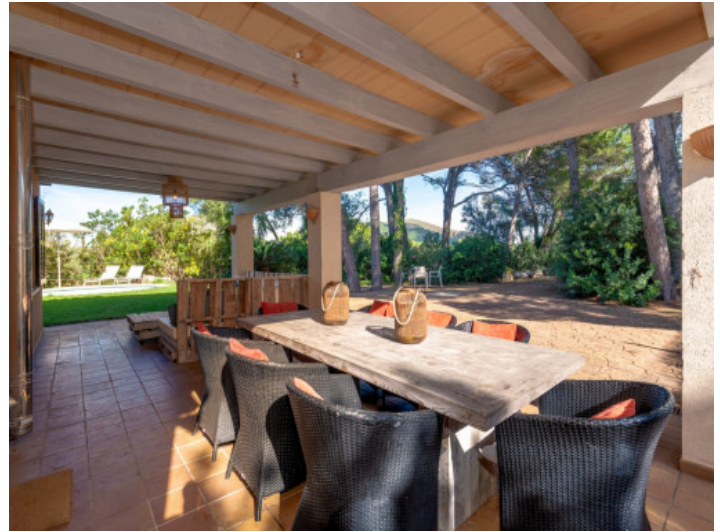
Essbereich auf überdachter Terrasse