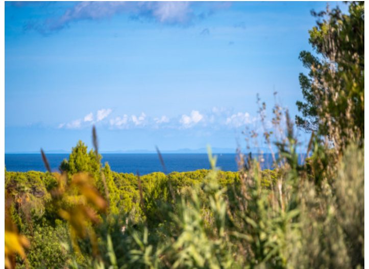
Terrasse mit direktem Meerblick