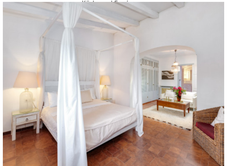
Schlafzimmer mit Ankleide und Badezimmer en Suite

Alle Angaben nach bestem Wissen. Irrtum und Zwischenverkauf vorbehalten. Dieses Exposé ist eine Vorinformation, als Rechtsgrundlage gilt allein der notariell abgeschlossene Kaufvertrag.