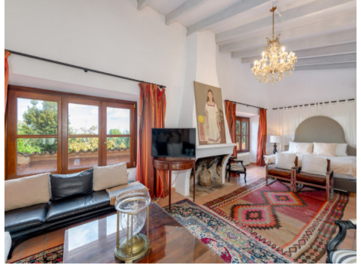
Master Suite mit warmem Ambiente und Meerblick