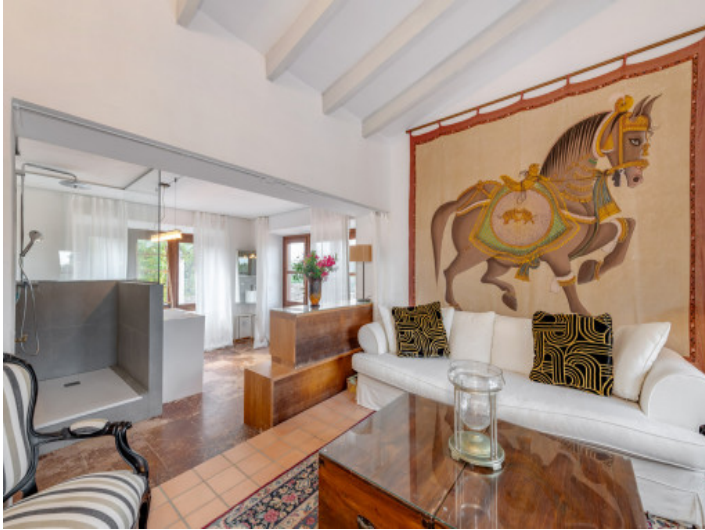
Master Suite mit Wohnbereich und Blick auf die Terrassen