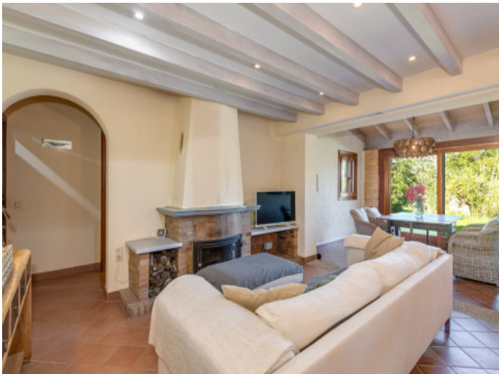
Gemütliches Wohnzimmer mit Kamin