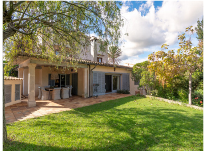
Großer Garten mit natürlichem Schatten und Ruhe