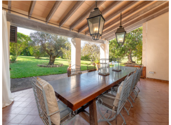
Überdachte Veranda mit Blick in den Garten