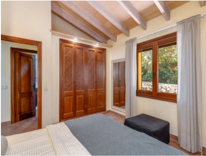
Schlafzimmer mit Einbauschränk