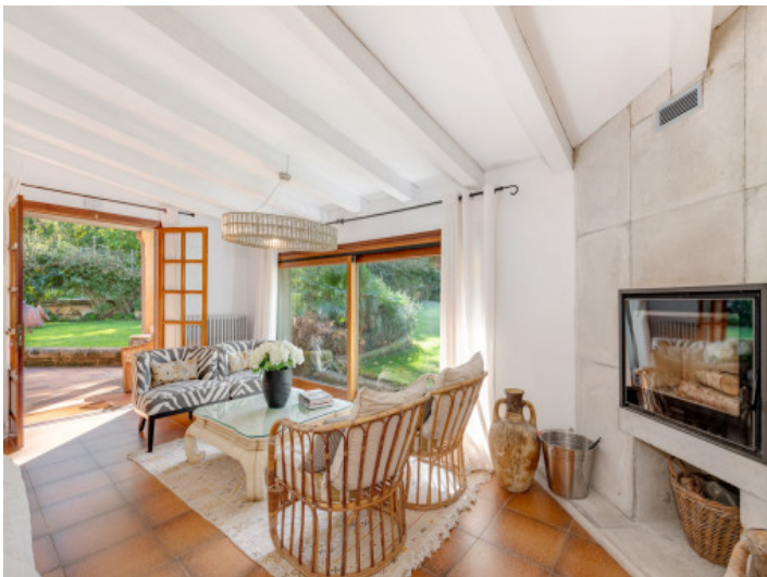
Wohnzimmer im Südflügel mit viel Licht und Blick ins Grüne