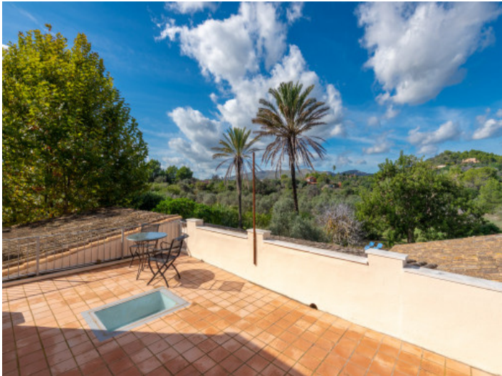
Master Suite mit Ausblick auf Natur und Meer