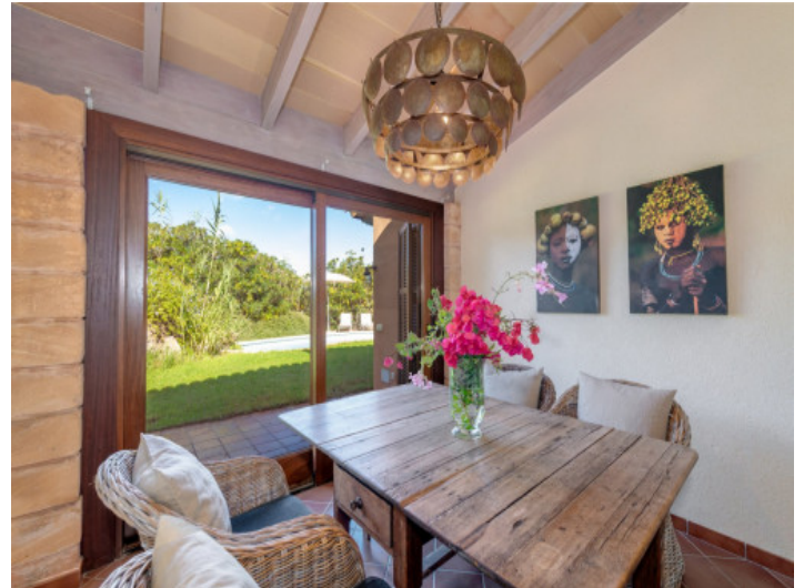
Essbereich mit Gartenzugang