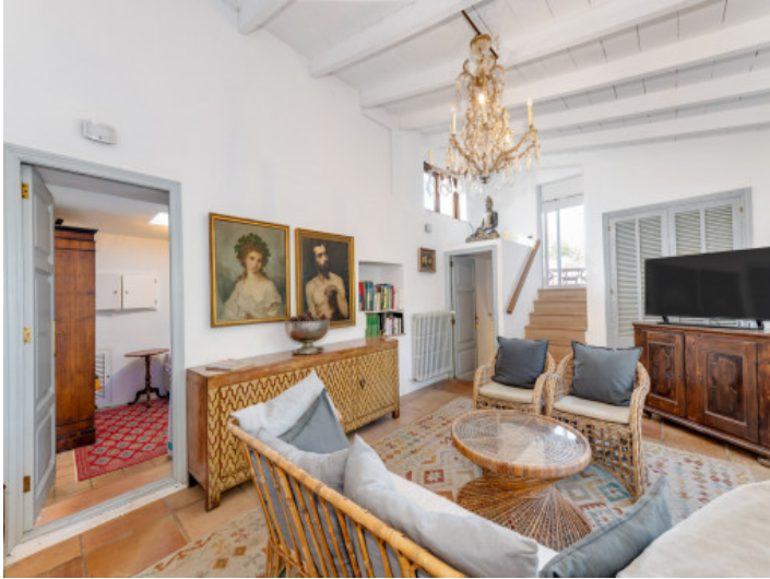
Wohnbereich im Indischen Flügel mit warmem Raumgefühl