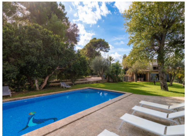
Großer Pool mit viel Platz zum Schwimmen und Entspannenpdepera

Alle Angaben nach bestem Wissen. Irrtum und Zwischenverkauf vorbehalten. Dieses Exposé ist eine Vorinformation, als Rechtsgrundlage gilt allein der notariell abgeschlossene Kaufvertrag.