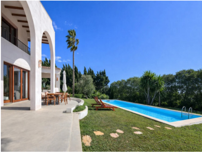
Sonniger Pool mit Garten