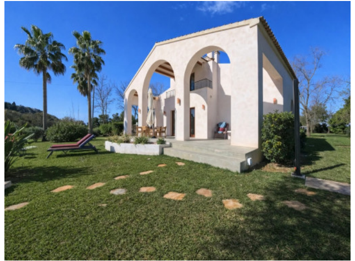
Fassade mit Arkaden & Garten