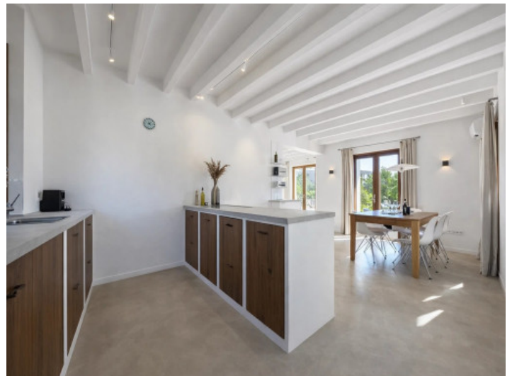
Moderne Küche mit Insel