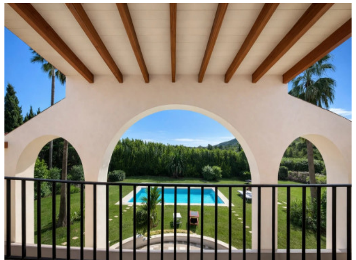
Balkon mit Pool- und Bergblick

Alle Angaben nach bestem Wissen. Irrtum und Zwischenverkauf vorbehalten. Dieses Exposé ist eine Vorinformation, als Rechtsgrundlage gilt allein der notariell abgeschlossene Kaufvertrag.