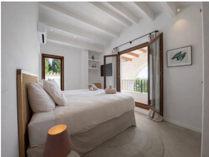
Oberes Schlafzimmer mit Terrassenzugang