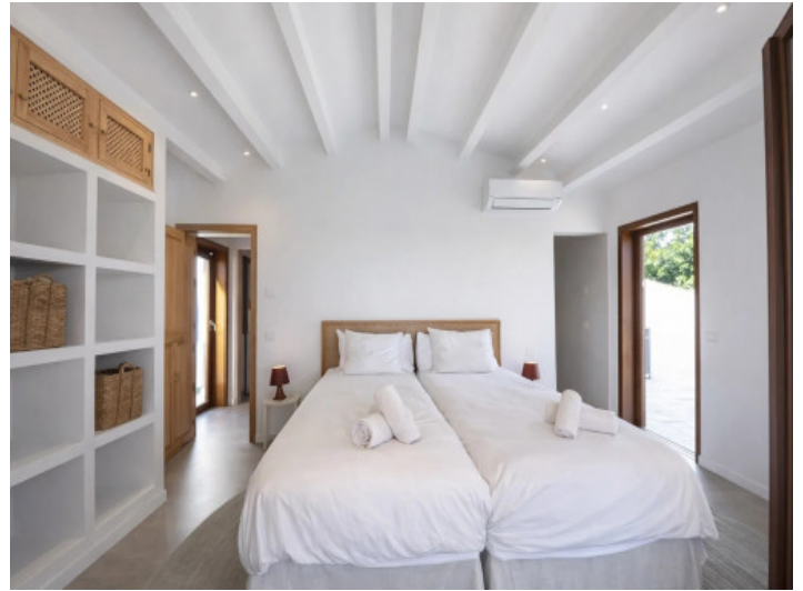
Helles Schlafzimmer mit Stauraum