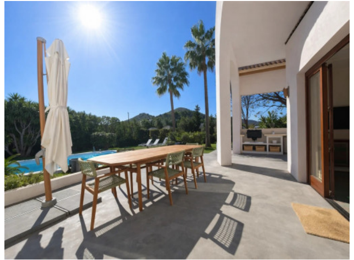
Essplatz-Terrasse am Pool