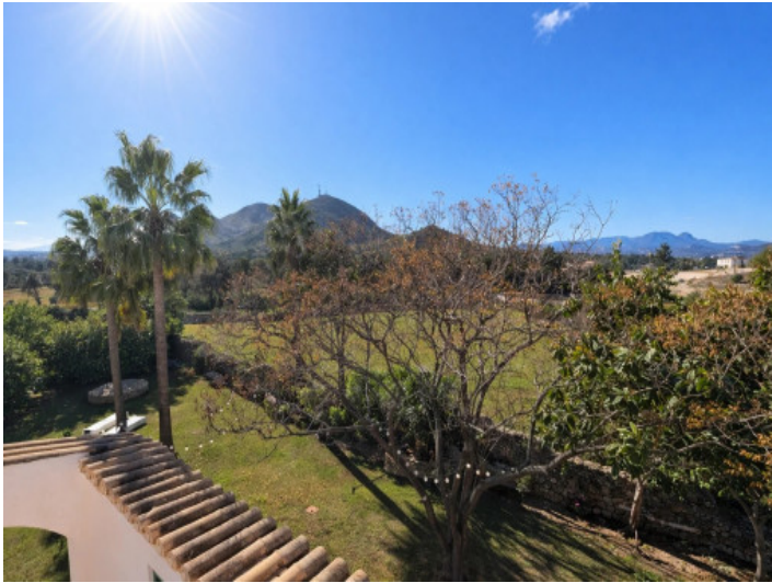
Weitblick ins Grüne & Berge