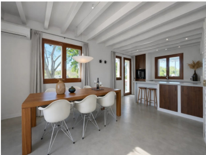
Offene Küche mit Essbereich