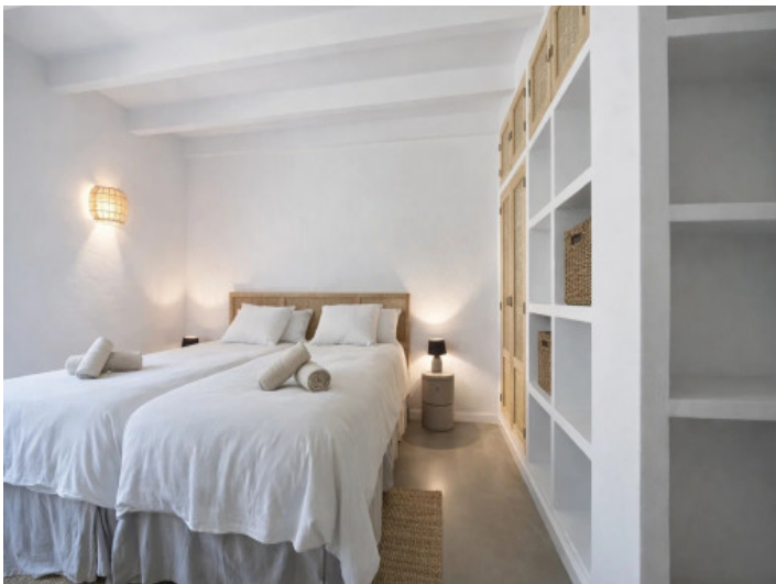
Doppelschlafzimmer im Erdgeschoss