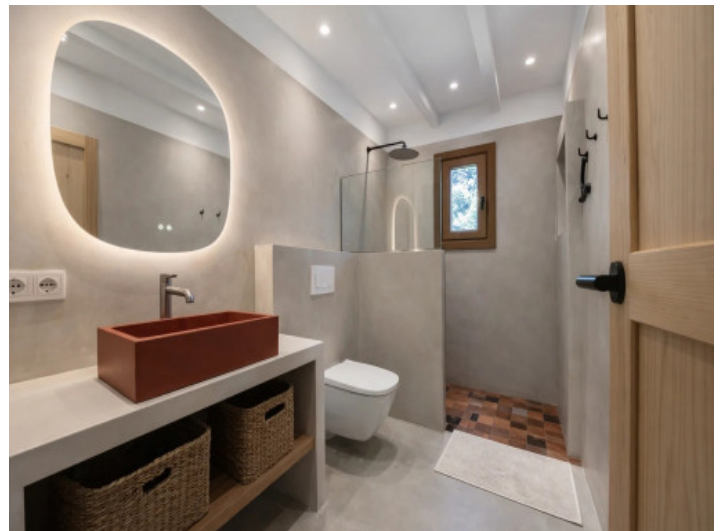
Bad mit Walk-in-Dusche