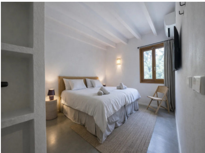
Schlafzimmer mit Stauraum