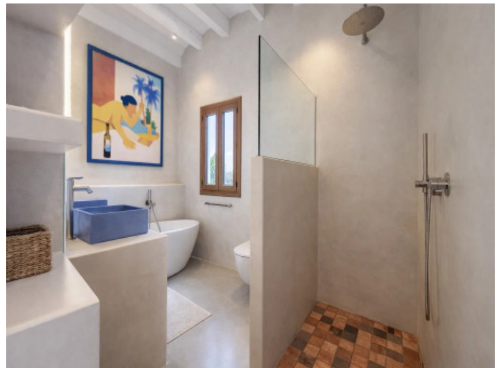
Großes Bad mit Wanne & Dusche