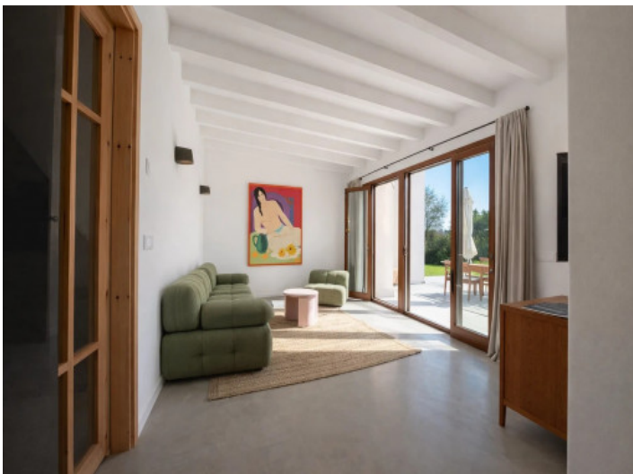
Wohnzimmer mit Terrassenzugang