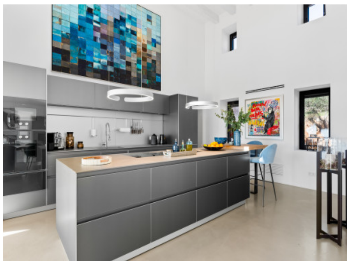
Exklusive Küche von Bulthaupt