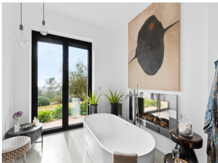
Badezimmer en Suite