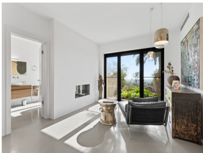
Lounge im Hauptschlafzimmer