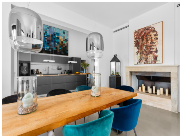
Essbereich mit Kamin