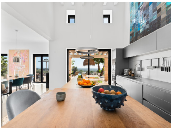
Küche von Bulthaupt