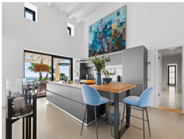
Küche von Bulthaupt

Alle Angaben nach bestem Wissen. Irrtum und Zwischenverkauf vorbehalten. Dieses Exposé ist eine Vorinformation, als Rechtsgrundlage gilt allein der notariell abgeschlossene Kaufvertrag.