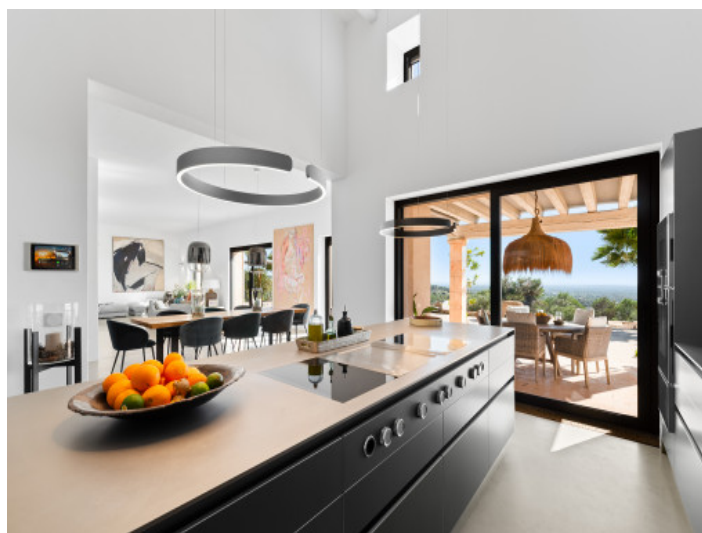
Kochinsel von Bulthaupt