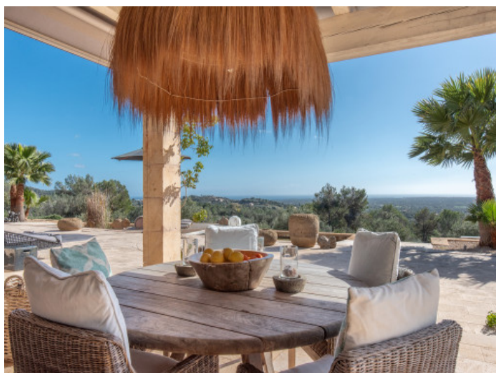
Terrasse mit Südausrichtung