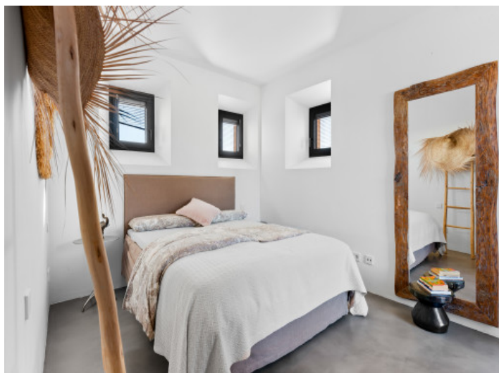
Eins von fünf Schlafzimmern