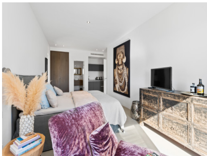
Separates Apatmrnet mit Badezimmer und Küchenzeile

Alle Angaben nach bestem Wissen. Irrtum und Zwischenverkauf vorbehalten. Dieses Exposé ist eine Vorinformation, als Rechtsgrundlage gilt allein der notariell abgeschlossene Kaufvertrag.