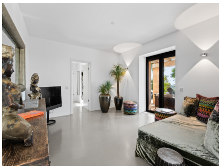
Extra Fernsehraum Hauptschlafzimmer