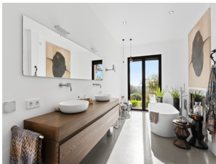
Badezimmer mit Badewanne