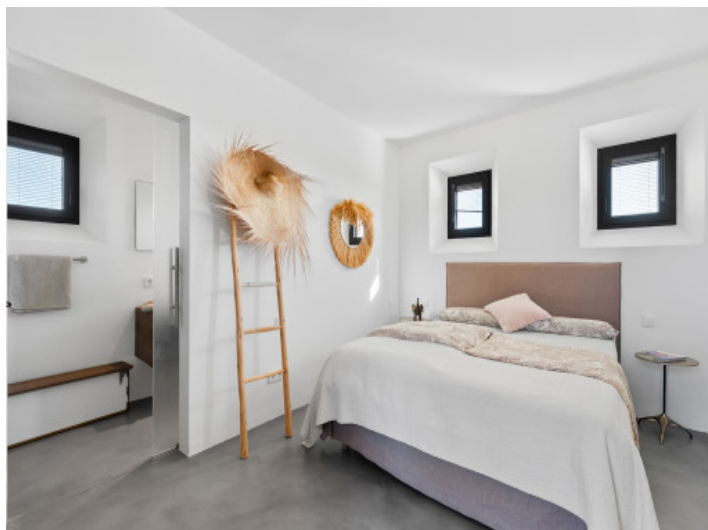
Schlafzimmer mit Badezimmer en Suite