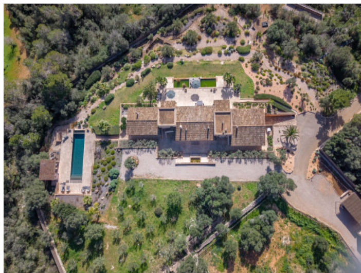
Majestätische Finca bei Santanyi