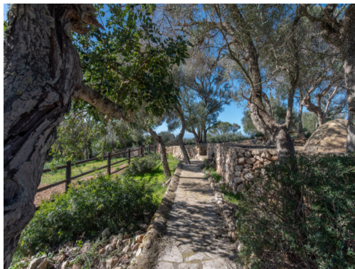
Gartenanlage mit schönem Baumwuchs