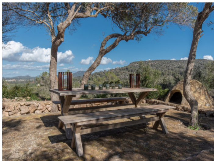
Aussichtspunkt mit Holzbank

Alle Angaben nach bestem Wissen. Irrtum und Zwischenverkauf vorbehalten. Dieses Exposé ist eine Vorinformation, als Rechtsgrundlage gilt allein der notariell abgeschlossene Kaufvertrag.