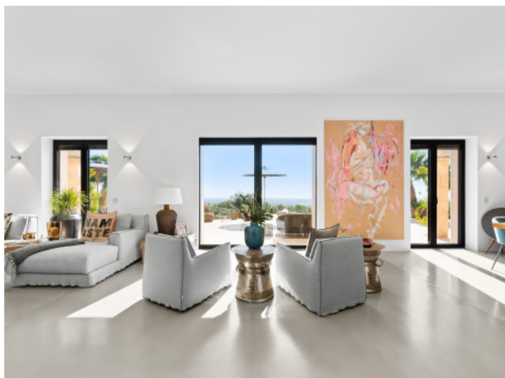
Großer Wohnbereich mit Panoramablick