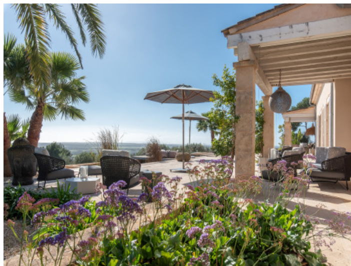
Spektakuläre Terrasse mit Blick nach Cabrera