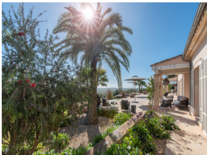
Aussenbereich mit Blick über die Terrasse