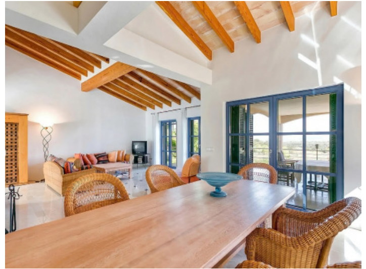
Essbereich mit Zugang auf die überdachte Terrasse