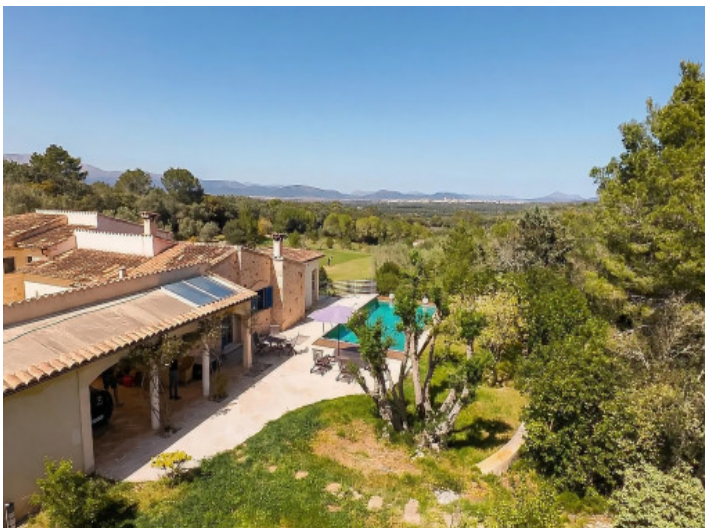
Toller Blick von der Poolebene aus