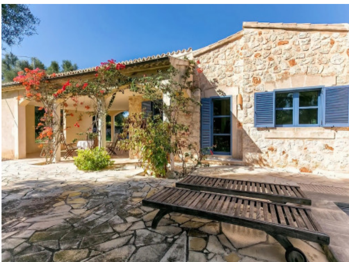
Blick vom Pooldeck auf das Haus