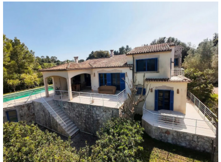
Totalansicht der Finca