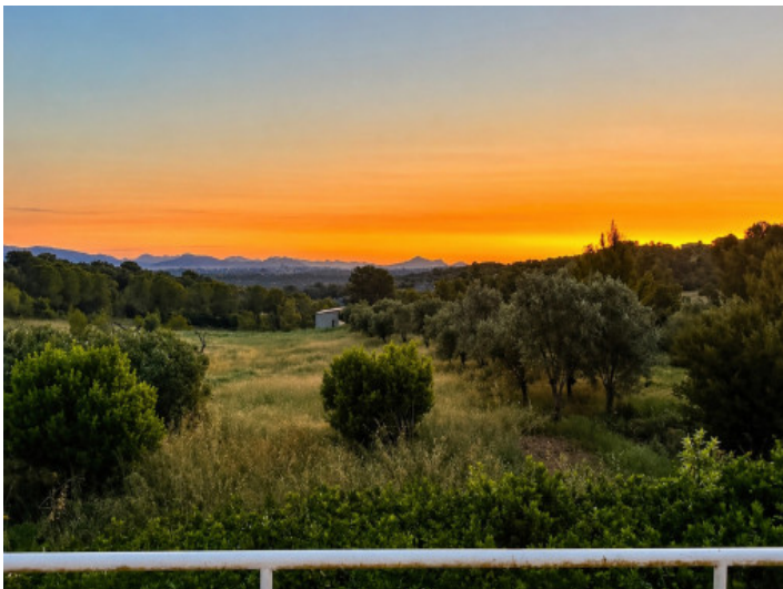
Sonnenuntergang im Westen