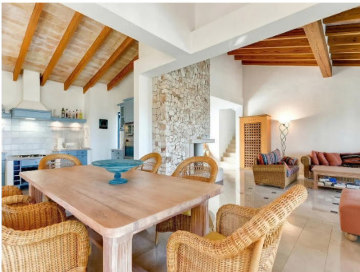
Ess- und Wohnbereich