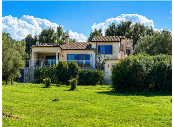
Ansicht des Hauses vom unteren Teil des Grundstücks