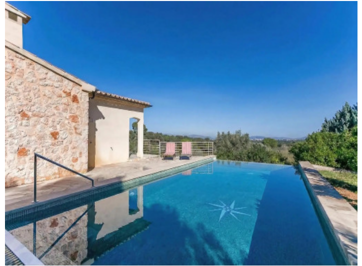
Swimmingpool mit Blick über Muro bis nach Alcúdia