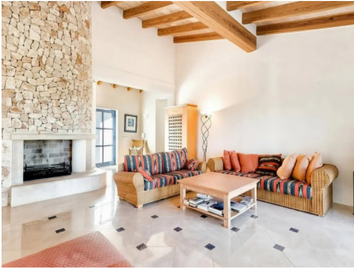
Rustikal modern ist das Wohnzimmer