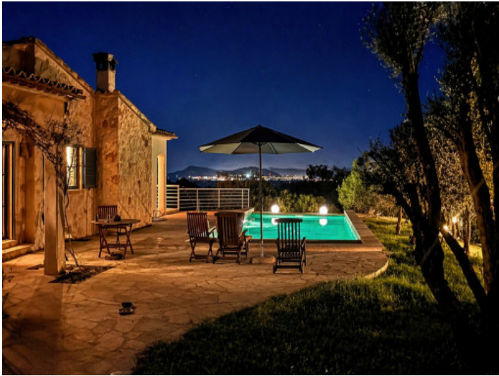
Pool bei Nacht