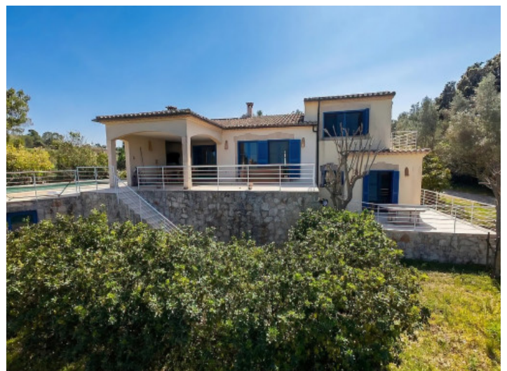
Ansicht des Hauses vom Garten

Alle Angaben nach bestem Wissen. Irrtum und Zwischenverkauf vorbehalten. Dieses Exposé ist eine Vorinformation, als Rechtsgrundlage gilt allein der notariell abgeschlossene Kaufvertrag.