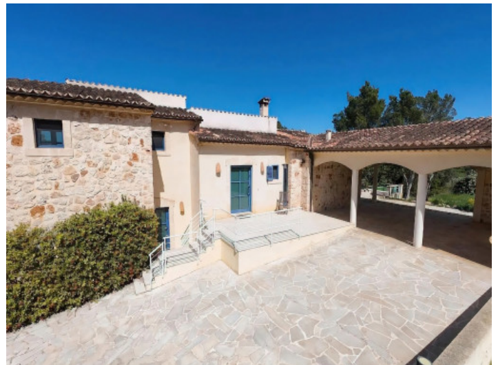
Eingangsbereich und Stellplätze