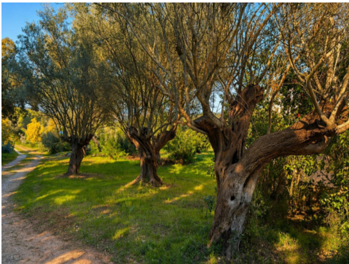
Zufahrt mit Olivenbäumen

Alle Angaben nach bestem Wissen. Irrtum und Zwischenverkauf vorbehalten. Dieses Exposé ist eine Vorinformation, als Rechtsgrundlage gilt allein der notariell abgeschlossene Kaufvertrag.