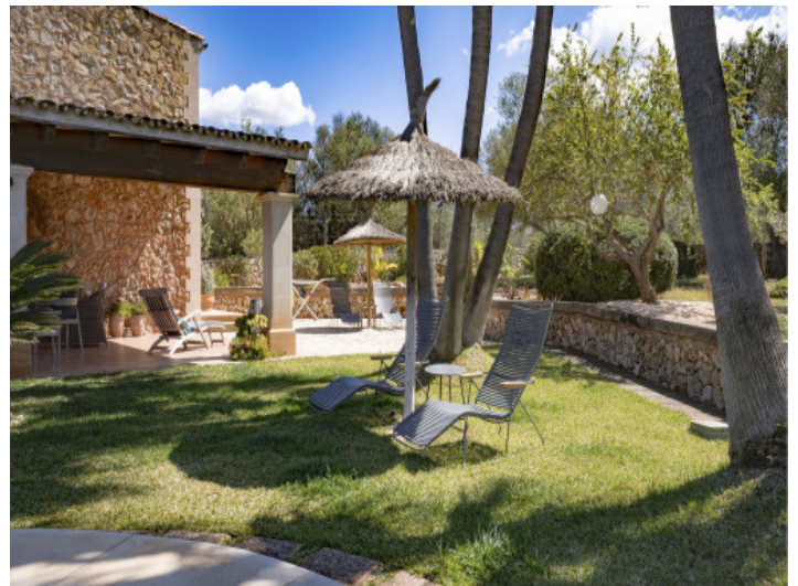
Sonnenliege am Pool