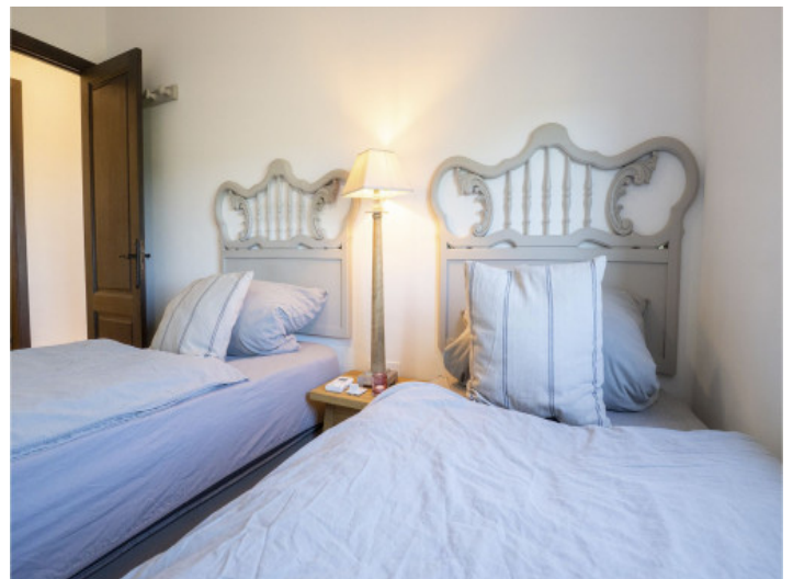
Eins von vier Schlafzimmer

Alle Angaben nach bestem Wissen. Irrtum und Zwischenverkauf vorbehalten. Dieses Exposé ist eine Vorinformation, als Rechtsgrundlage gilt allein der notariell abgeschlossene Kaufvertrag.