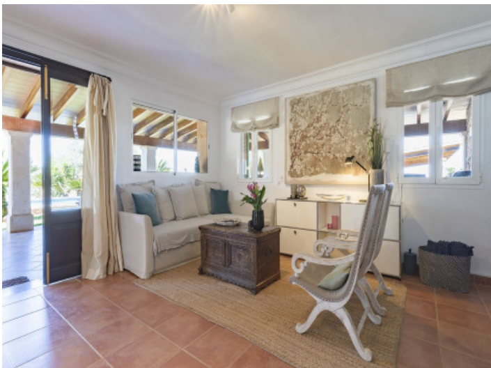
Wohnbereich mit Ausgang zur Terrasse