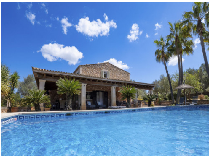
Finca mit großem Pool