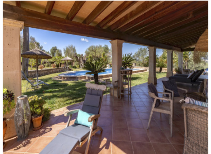
Größe Überdachung und ein sehr schöner Garten