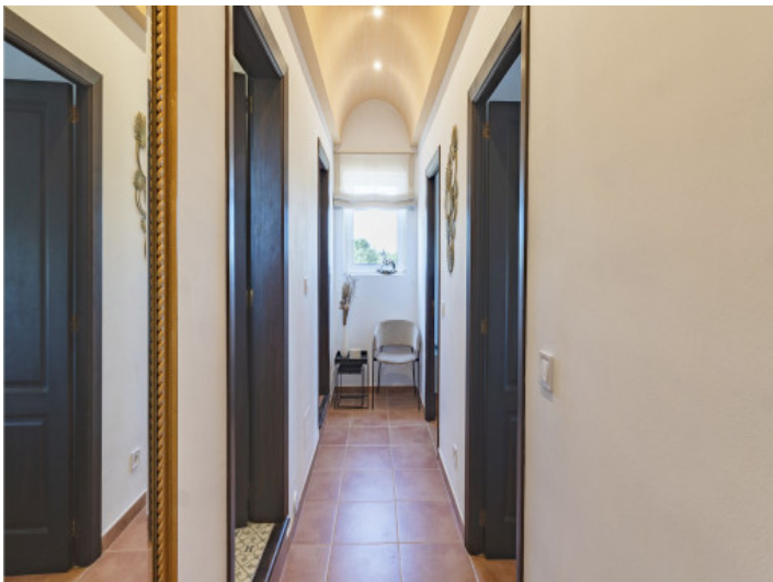
Flur zu den Schlafzimmern