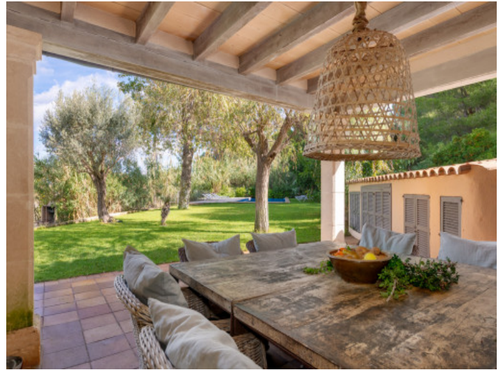
Überdachte Veranda für entspannte Stunden draußen