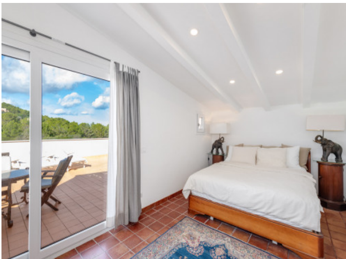
Romantisches Schlafzimmer im oberen Bereich mit heller Atmosphäre