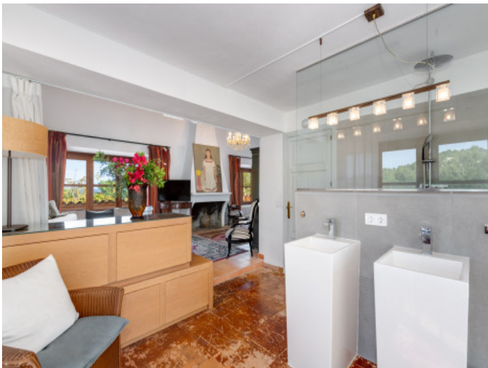
Offenes Badezimmer der Master Suite