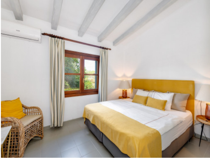
Eines der drei Schlafzimmer im Südflügel mit Zugang zur Terrasse