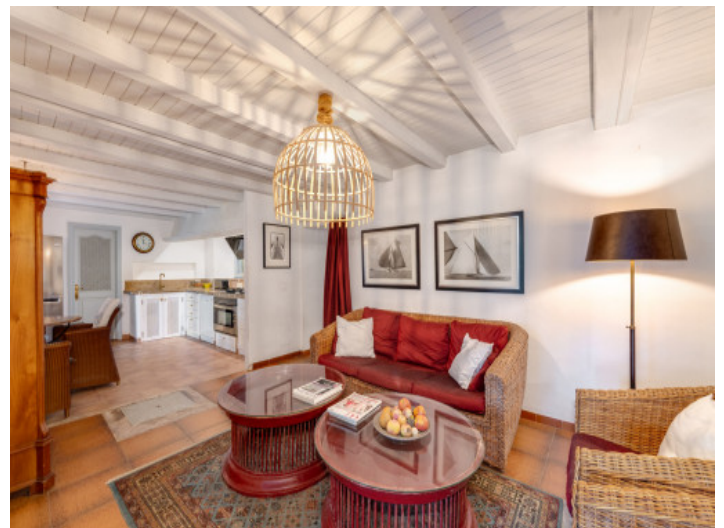
Gemütlicher Wohnbereich mit warmem Ambiente, Verbindung zwischen Küche und Esszimmer

Alle Angaben nach bestem Wissen. Irrtum und Zwischenverkauf vorbehalten. Dieses Exposé ist eine Vorinformation, als Rechtsgrundlage gilt der mit dem Haus zugehörige geschlossene Kaufvertrag.