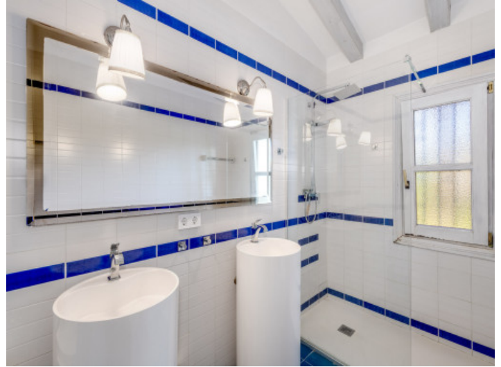
Badezimmer mit klarer Linienführung