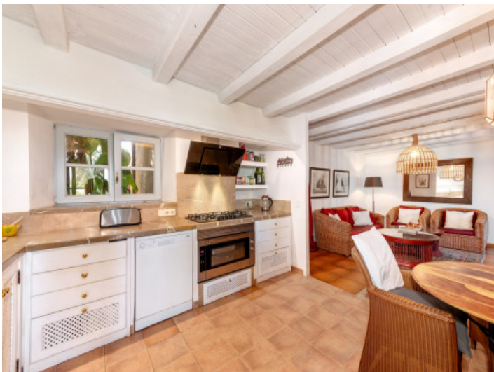
Großzügige Küche mit Vorratskammer und einladendem Frühstücksplatz