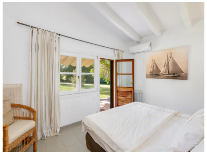
Eines der drei Schlafzimmer im Südflügel mit Zugang zur Terrasse

Alle Angaben nach bestem Wissen. Irrtum und Zwischenverkauf vorbehalten. Dieses Exposé ist eine Vorinformation, als Rechtsgrundlage gilt allein der notariell abgeschlossene Kaufvertrag.