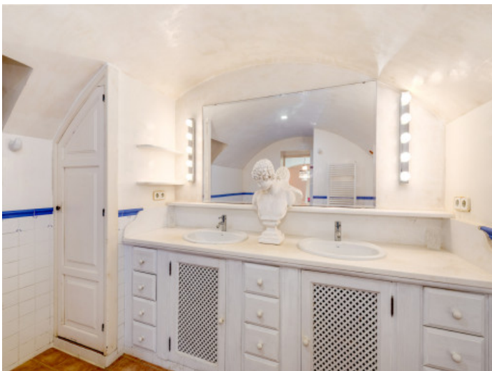
Badezimmer en Suite mit klarer, eleganter Gestaltung