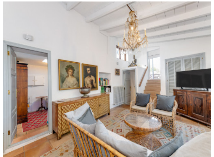
Wohnbereich im Indischen Flügel mit warmem Raumgefühl