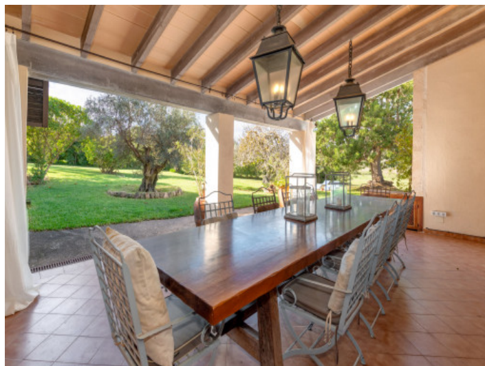
Überdachte Veranda mit Blick in den Garten