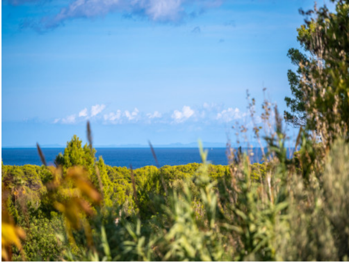
Terrasse mit direktem Meerblick