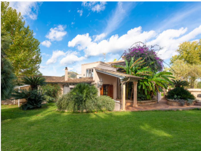
Willkommen in Ihrer privaten Finca Oase im Grünen