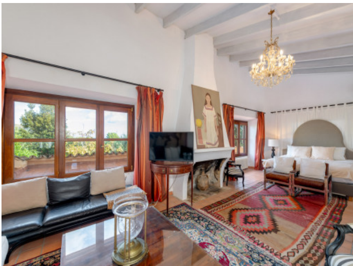
Master Suite mit warmem Ambiente und Meerblick