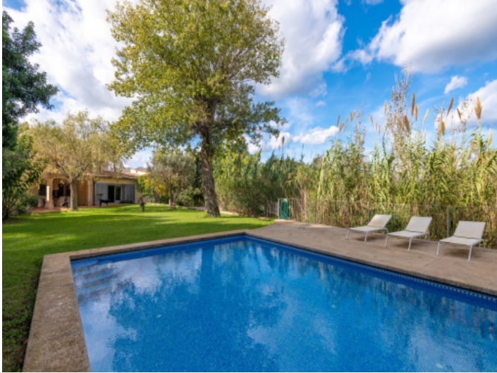
64 qm großer Pool mit weitem Naturblick