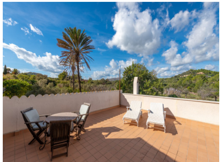
Private Terrasse des Schlafzimmers mit Meerblick

Alle Angaben nach bestem Wissen. Irrtum und Zwischenverkauf vorbehalten. Dieses Exposé ist eine Vorinformation, als Rechtsgrundlage gilt allein der notariell abgeschlossene Kaufvertrag.