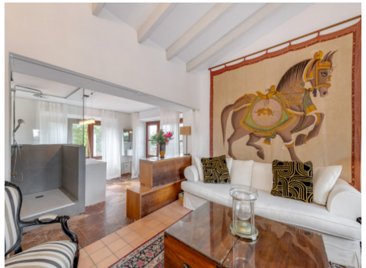
Master Suite mit Wohnbereich und Blick auf die Terrassen