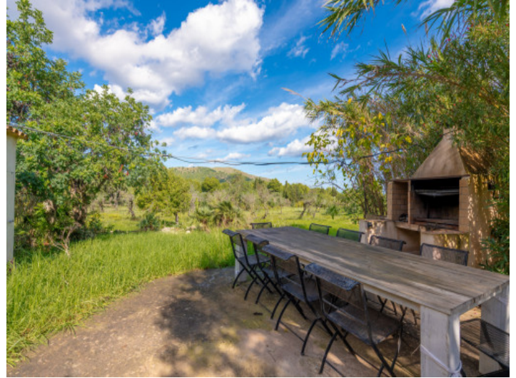
Barbecuearea im Garten