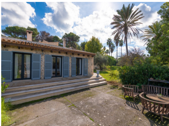
Indischer Flügel von außen auf der Gartenseite

Alle Angaben nach bestem Wissen. Irrtum und Zwischenverkauf vorbehalten. Dieses Exposé ist eine Vorinformation, als Rechtsgrundlage gilt allein der notariell abgeschlossene Kaufvertrag.