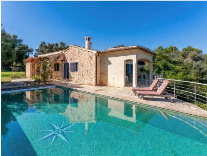
Hauptansicht der Finca