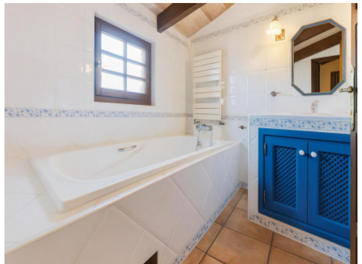
Badezimmer mit Badewanne und blauem Schrank

Alle Angaben nach bestem Wissen. Irrtum und Zwischenverkauf vorbehalten. Dieses Exposé ist eine Vorinformation, als Rechtsgrundlage gilt allein der notariell abgeschlossene Kaufvertrag.