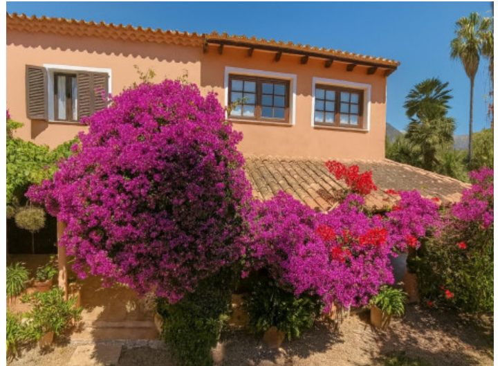
Hausfassade mit blühendem Garten