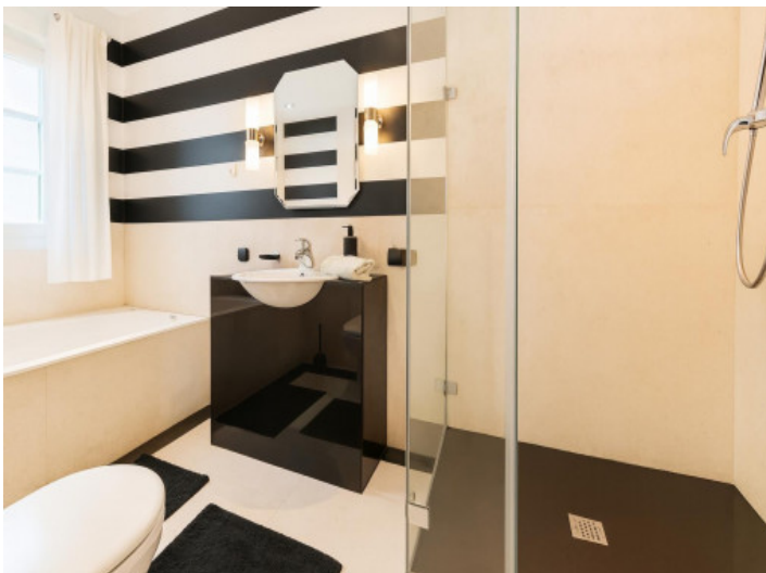
Moderne En-Suite Badezimmer mit Dusche