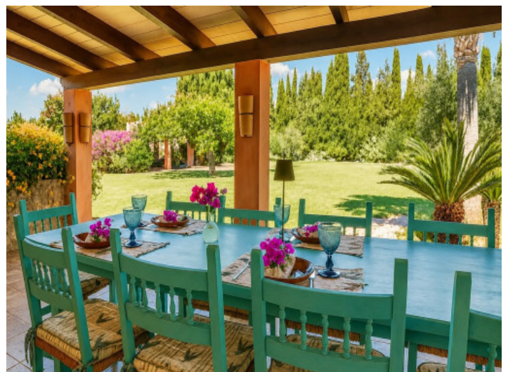
Überdachte Terrasse mit Esstisch und Gartenblick

Alle Angaben nach bestem Wissen. Irrtum und Zwischenverkauf vorbehalten. Dieses Exposé ist eine Vorinformation, als Rechtsgrundlage gilt allein der notariell abgeschlossene Kaufvertrag.