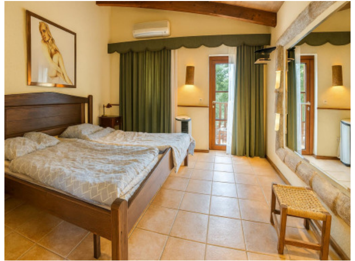
Gästezimmer mit Doppelbett und Balkonzugang