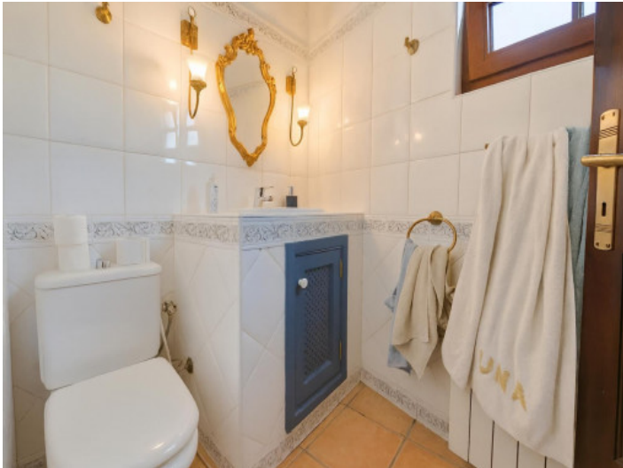
Kleines Badezimmer mit dekorativem Spiegel