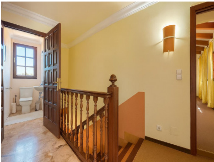
Flur im Obergeschoss mit Badezimmerzugang