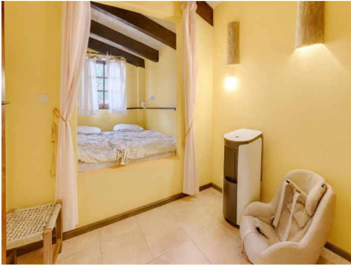
Gästezimmer mit gemütlicher Beleuchtung