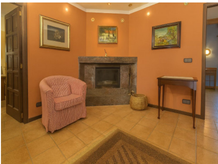
Gemütlicher Flur mit Kamin und Sessel