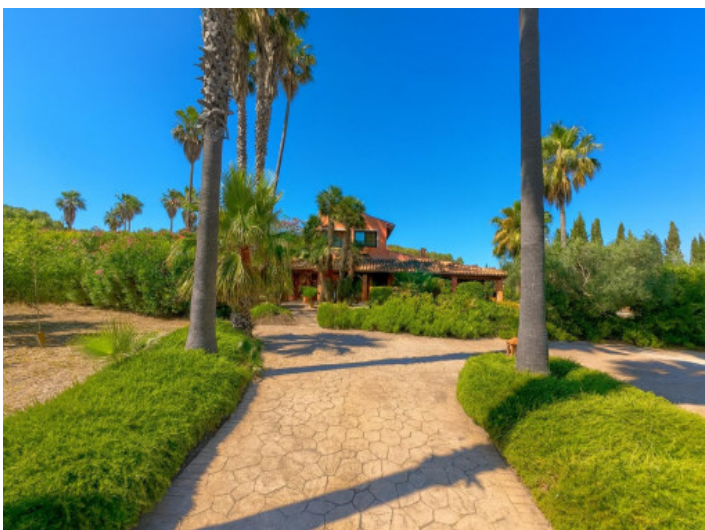
Einfahrt zum Haus mit Palmen