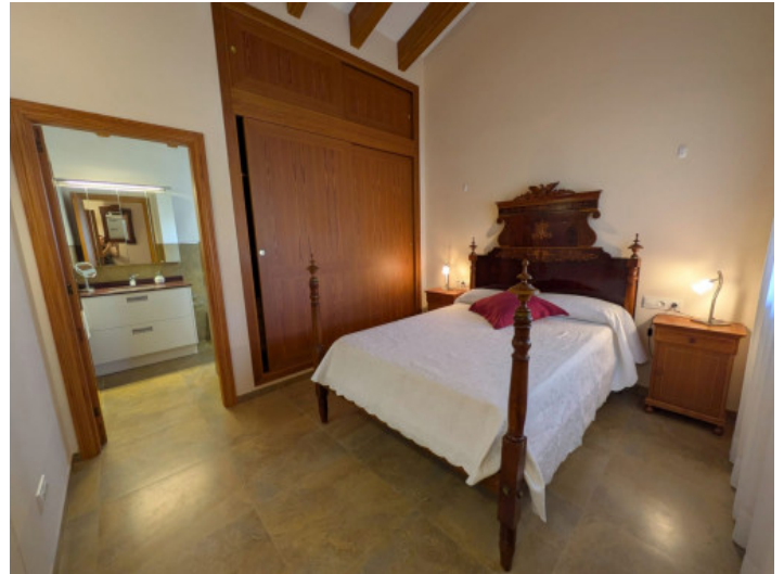
Hauptschlafzimmer mit Bad en Suite