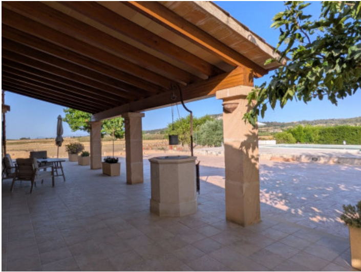
Grosse Aussen Terrasse