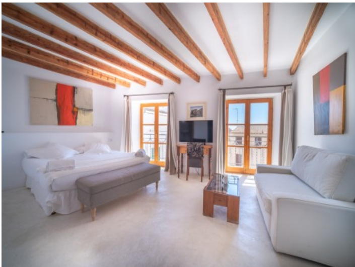
Eines von 5 Schlafzimmern