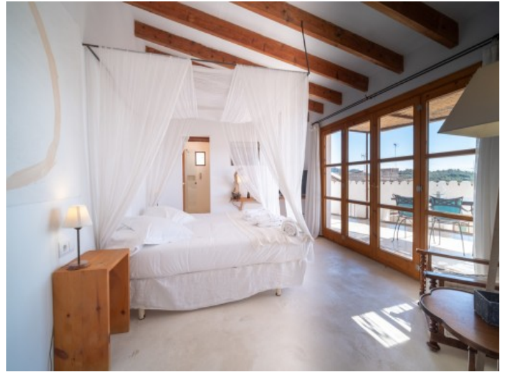
Schlafzimmer mit Balkonzugang