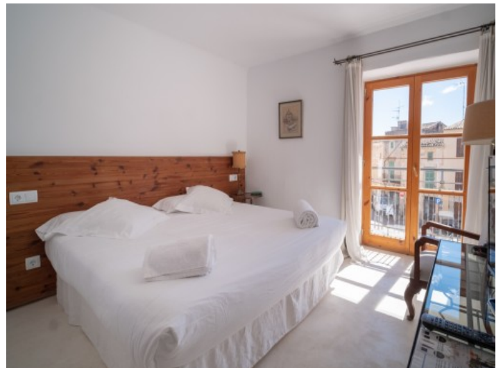
Eines von 5 Schlafzimmern