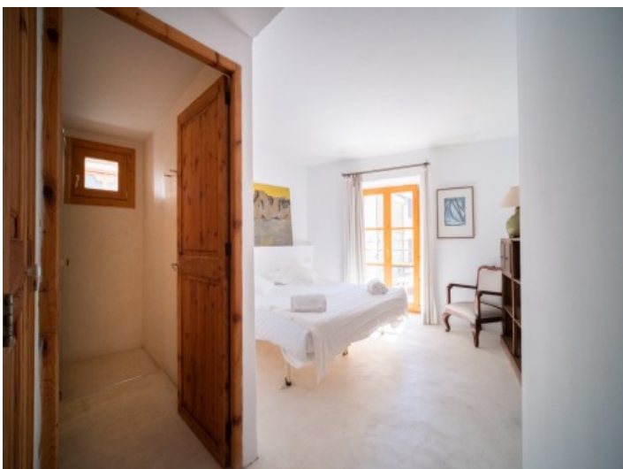
Schlafzimmer mit Badezimmer en Suite