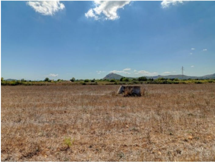
Ansicht des Grundstücks