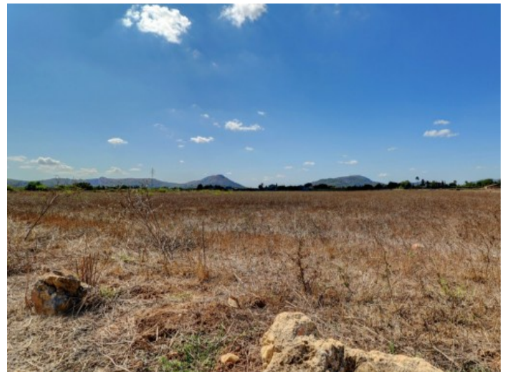
Alternative Ansicht des Grundstücks

Alle Angaben nach bestem Wissen. Irrtum und Zwischenverkauf vorbehalten. Dieses Exposé ist eine Vorinformation, als Rechtsgrundlage gilt allein der notariell abgeschlossene Kaufvertrag.