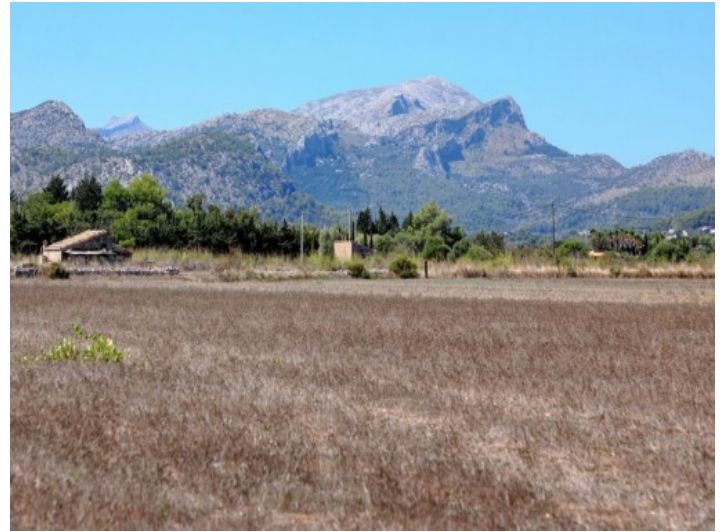
Alternative Ansicht des Grundstücks