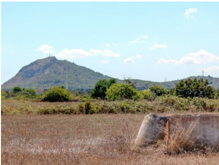
Alternative Ansicht des Grundstücks