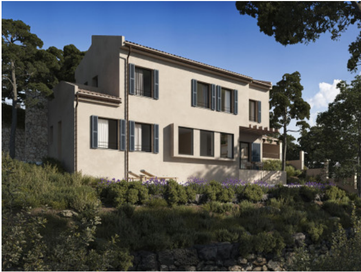
Ansicht auf das Bauprojekt