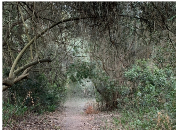
Zufahrt zum Grundstück

Alle Angaben nach bestem Wissen. Irrtum und Zwischenverkauf vorbehalten. Dieses Exposé ist eine Vorinformation, als Rechtsgrundlage gilt allein der notariell abgeschlossene Kaufvertrag.