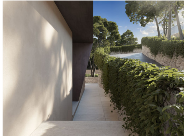
Eingang und Anfahrt