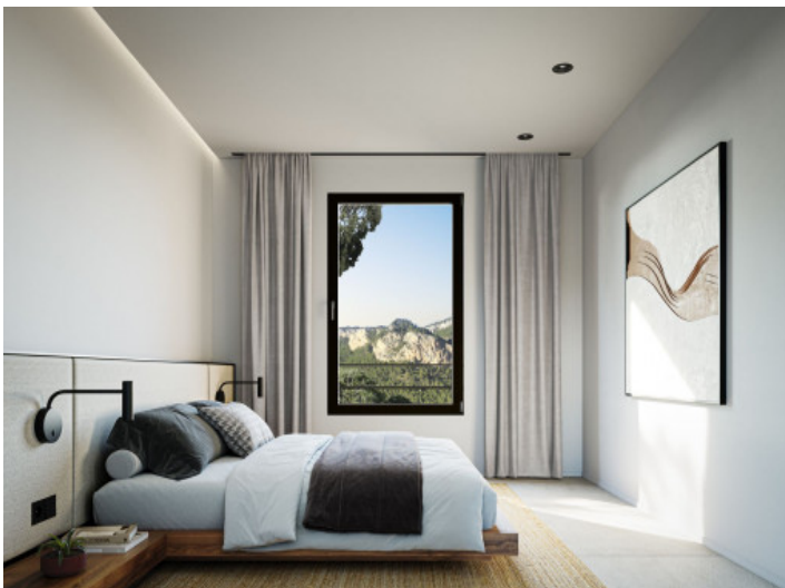
Eines der Schlafzimmer