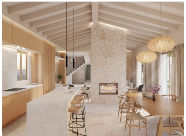
Küche und Esszimmer

Alle Angaben nach bestem Wissen. Irrtum und Zwischenverkauf vorbehalten. Dieses Exposé ist eine Vorinformation, als Rechtsgrundlage gilt allein der notariell abgeschlossene Kaufvertrag.