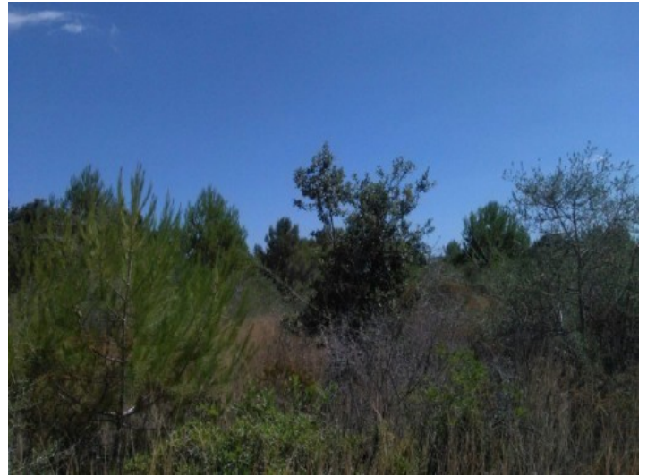
Grundstück in Son Servera