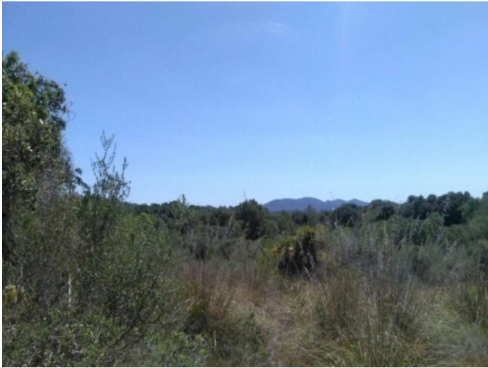
Grundstück mit vielen Möglichkeiten