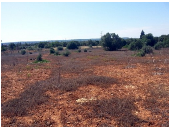
Grundstück mit viel Potential

Alle Angaben nach bestem Wissen. Irrtum und Zwischenverkauf vorbehalten. Dieses Exposé ist eine Vorinformation, als Rechtsgrundlage gilt allein der notariell abgeschlossene Kaufvertrag.