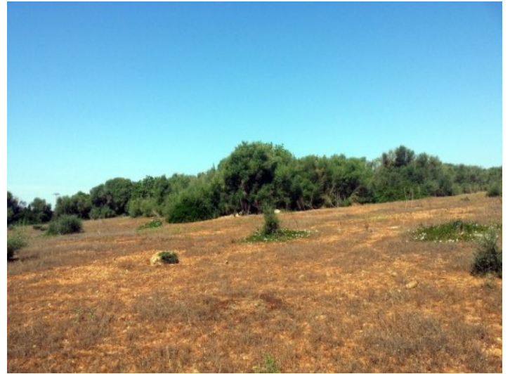
Grundstück in Campos