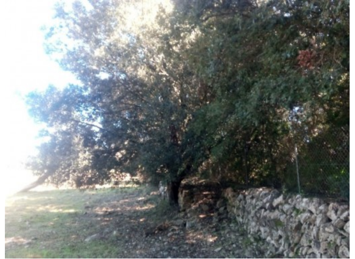
Ansicht des Grundstückes