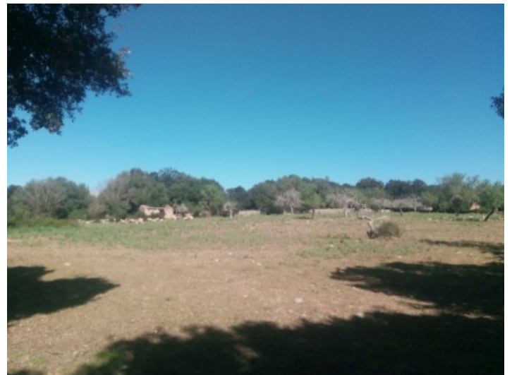
Ansicht des Grundstückes

Alle Angaben nach bestem Wissen. Irrtum und Zwischenverkauf vorbehalten. Dieses Exposé ist eine Vorinformation, als Rechtsgrundlage gilt allein der notariell abgeschlossene Kaufvertrag.