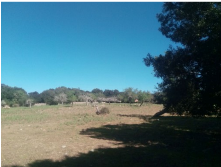
Ansicht des Grundstückes