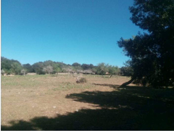
Ansicht des Grundstückes