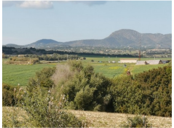
Grundstück mit Bergblick