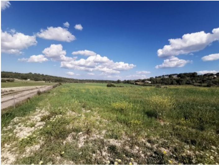
Grundstück mit eigenem Brunnen