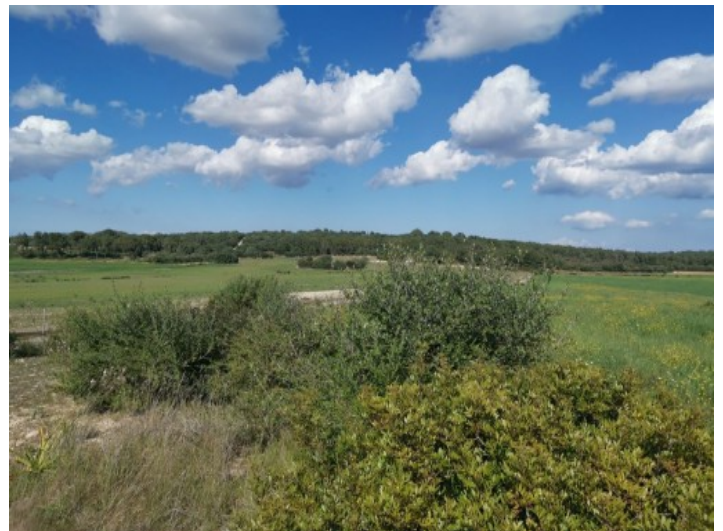
Grundstück mit über 40.000 qm

Alle Angaben nach bestem Wissen. Irrtum und Zwischenverkauf vorbehalten. Dieses Exposé ist eine Vorinformation, als Rechtsgrundlage gilt allein der notariell abgeschlossene Kaufvertrag.