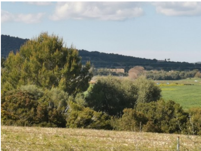
Zentral gelegenes Grundstück