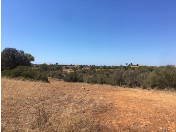
Wundervolles Baugrundstück von über 20.000 qm in Cala d'Or