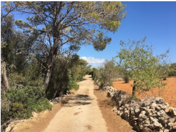
Zugang zum Grundstück