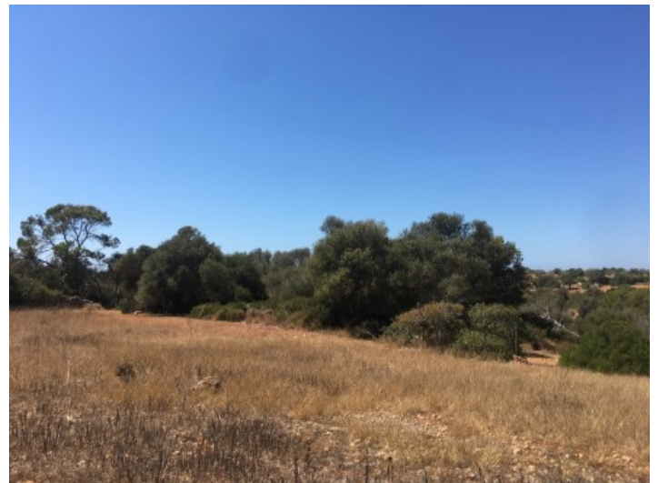
Alternative Ansicht des Grundstücks