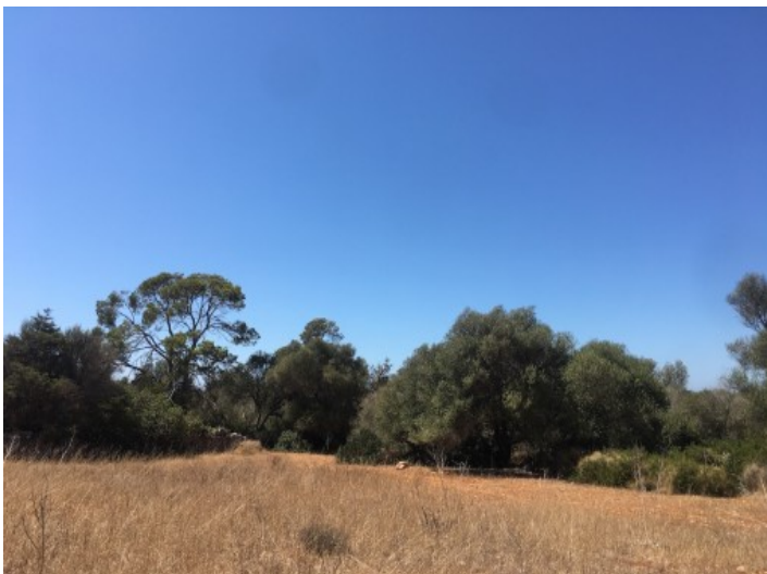
Alternative Ansicht des Grundstücks

Alle Angaben nach bestem Wissen. Irrtum und Zwischenverkauf vorbehalten. Dieses Exposé ist eine Vorinformation, als Rechtsgrundlage gilt allein der notariell abgeschlossene Kaufvertrag.