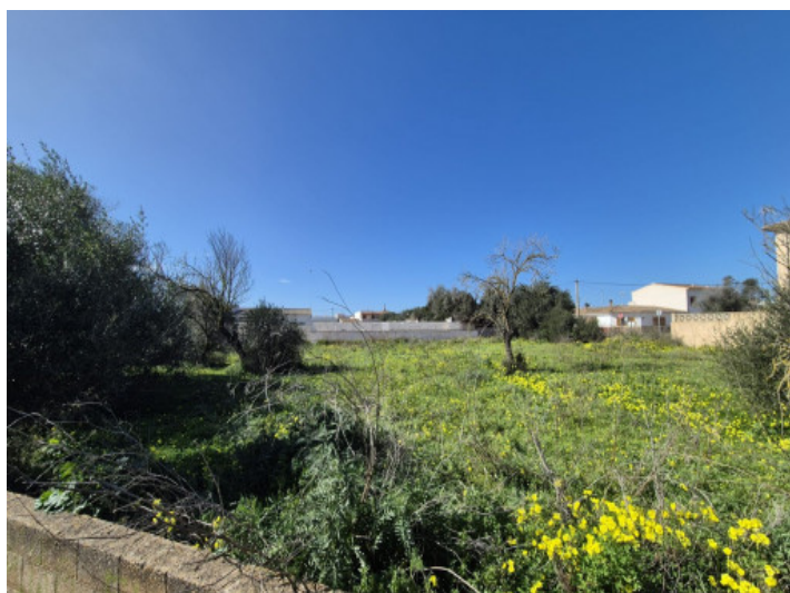
Basis für Ihr zukünftiges Zuhause oder Investitionsprojekt