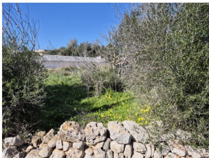
Grundstück in gepflegter Umgebung