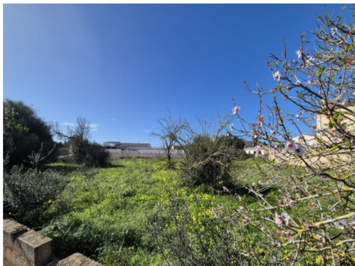
Urbane Baugrundstücke in Ses Salines