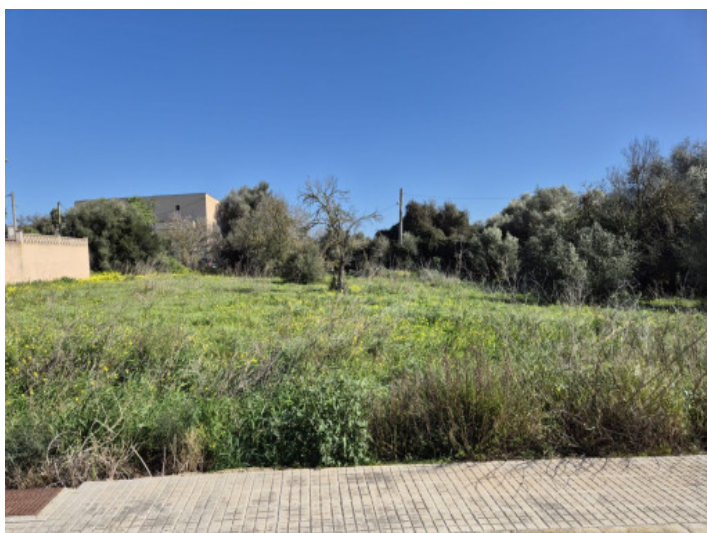
Ortsnähe und Ruhe