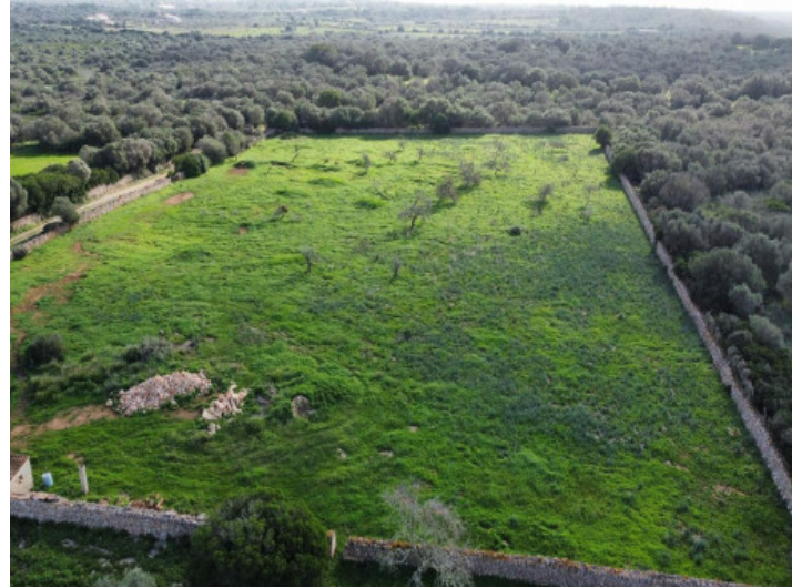
Grundstück mit Weitsicht