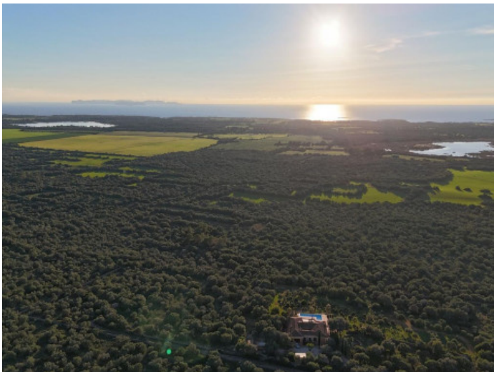
Blick auf Cabrera

Alle Angaben nach bestem Wissen. Irrtum und Zwischenverkauf vorbehalten. Dieses Exposé ist eine Vorinformation, als Rechtsgrundlage gilt allein der notariell abgeschlossene Kaufvertrag.