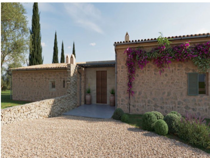
Zufahrt und Eingangsbereich des Finca Projekts