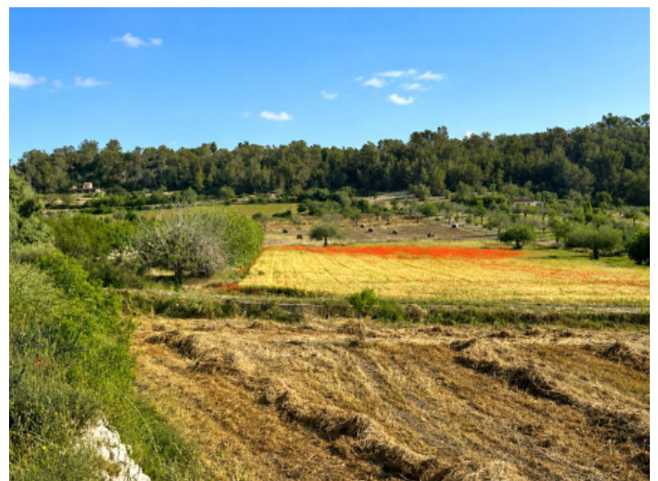
Weitläufiges Grundstück mit 15.900 qm und altem Baumbestand

Alle Angaben nach bestem Wissen. Irrtum und Zwischenverkauf vorbehalten. Dieses Exposé ist eine Vorinformation, als Rechtsgrundlage gilt allein der notariell abgeschlossene Kaufvertrag.