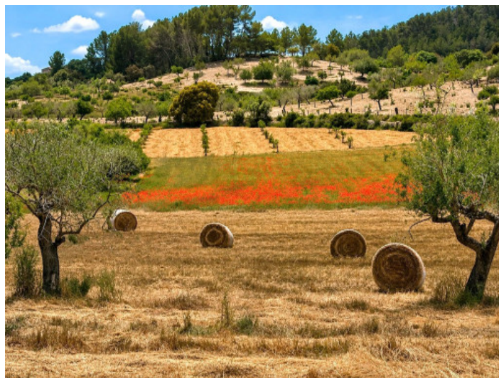
Natürliche Umgebung mit Feldern, Baumbestand und ländlichem Charakter