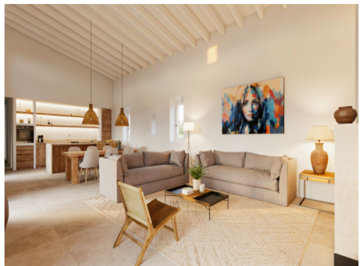
Heller Wohnbereich mit mediterraner Atmosphäre

Alle Angaben nach bestem Wissen. Irrtum und Zwischenverkauf vorbehalten. Dieses Exposé ist eine Vorinformation, als Rechtsgrundlage gilt allein der notariell abgeschlossene Kaufvertrag.