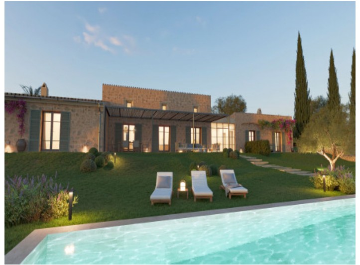
Finca Projekt mit Pool und mediterranem Garten