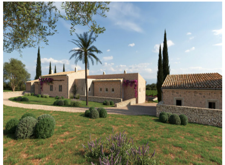
Außenansicht der geplanten Finca mit Garten