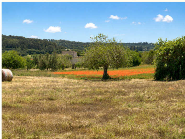
Mediterranes Landschaftsbild mit weitem Blick ins Grüne