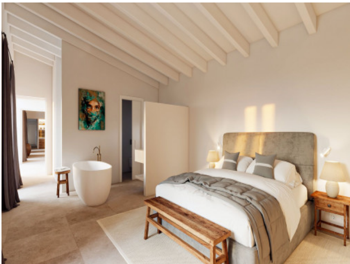
Schlafzimmer mit ruhigem mediterranem Ambiente