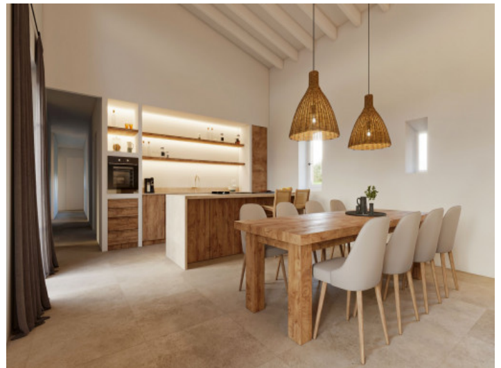
Offener Wohn und Essbereich mit Natursteinkzenten