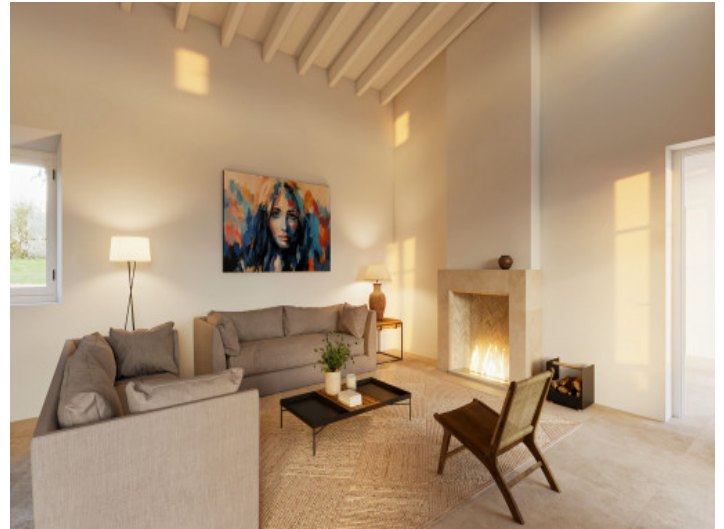
Wohnbereich mit Kamin und Zugang zum Außenbereich