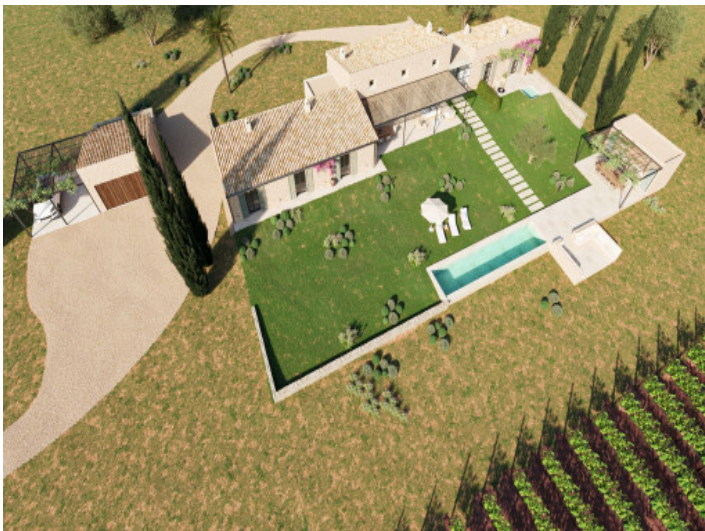
Luftansicht des geplanten Finca Projekts