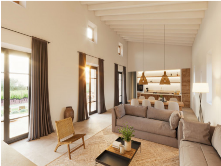
Wohnbereich mit Kamin und Zugang zum Außenbereich