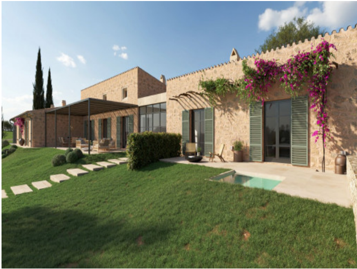
Neubaufinca im mallorquinischen Stil