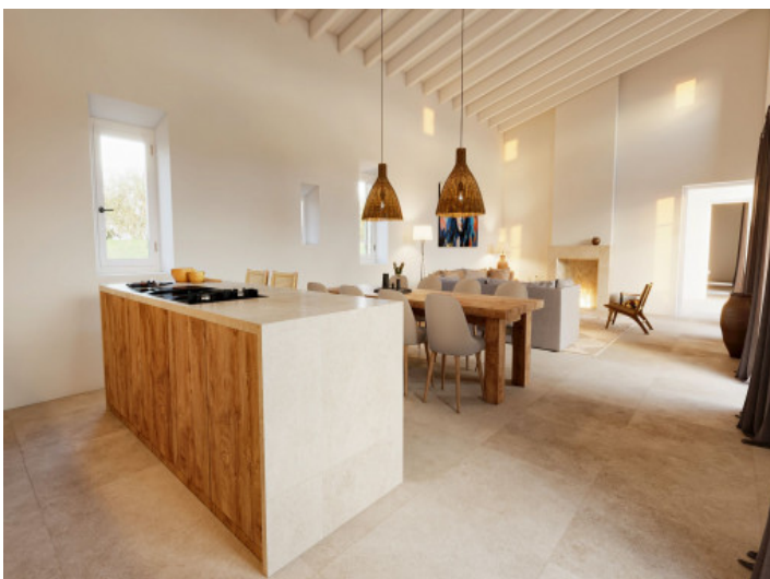
Moderne Küche mit offenem Wohnkonzept