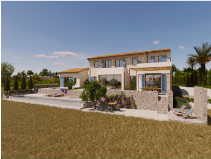
Visualisierungen Innen und Außen