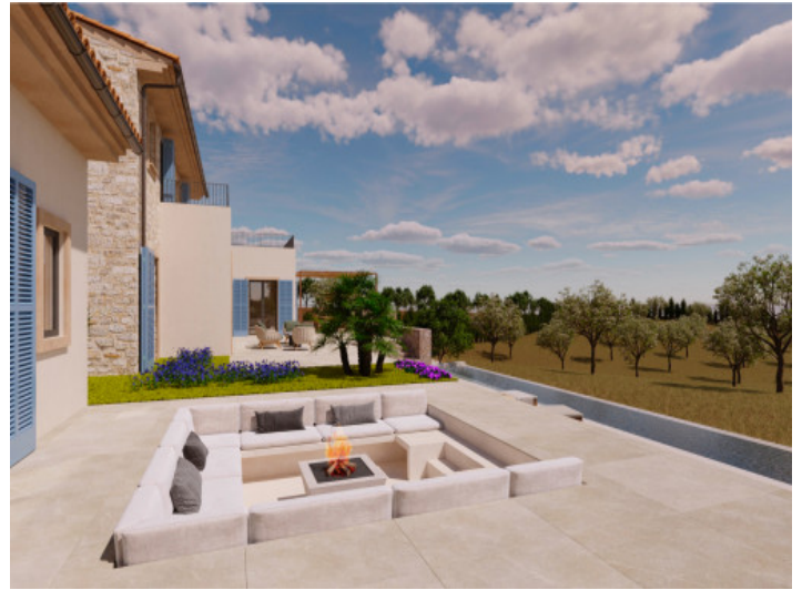
Visualisierungen Innen und Außen