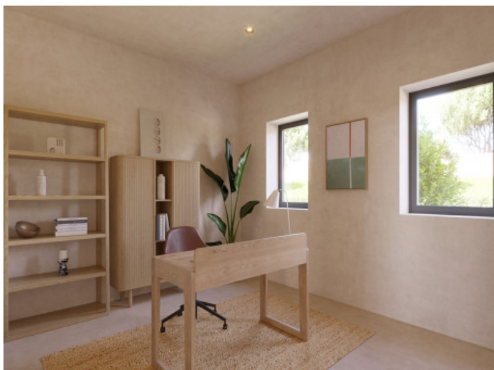
Visualisierungen Innen und Außen