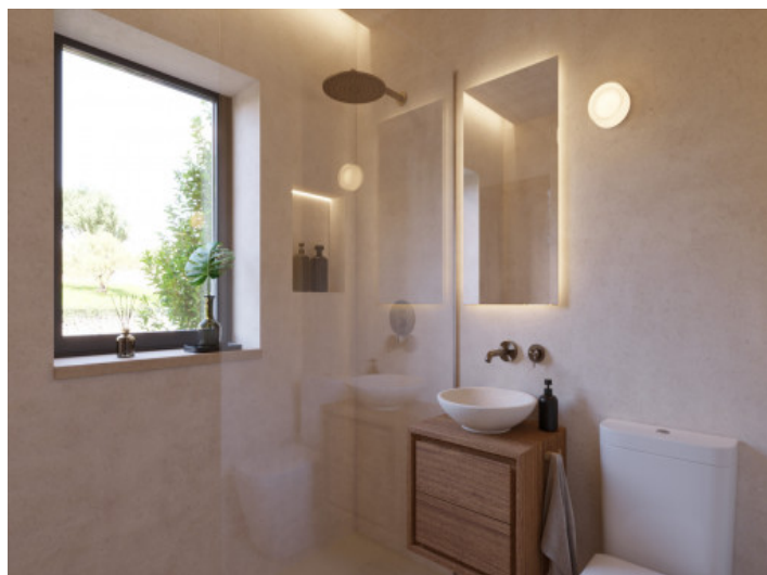
Visualisierungen Innen und Außen

Alle Angaben nach bestem Wissen. Irrtum und Zwischenverkauf vorbehalten. Dieses Exposé ist eine Vorinformation, als Rechtsgrundlage gilt allein der notariell abgeschlossene Kaufvertrag.