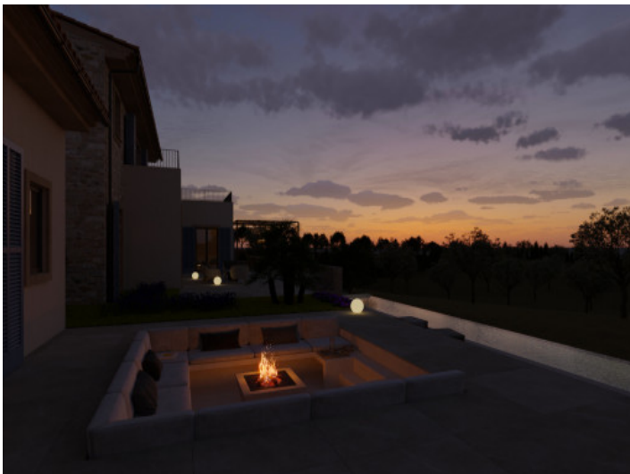
Visualisierungen Innen und Außen