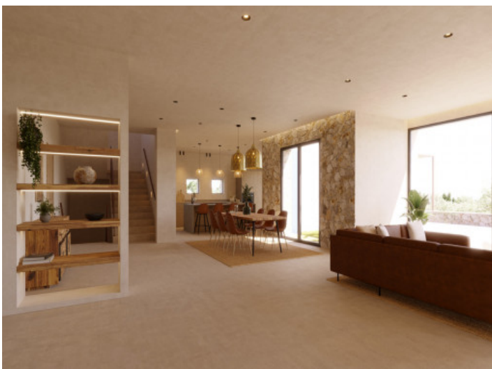
Visualisierungen Innen und Außen