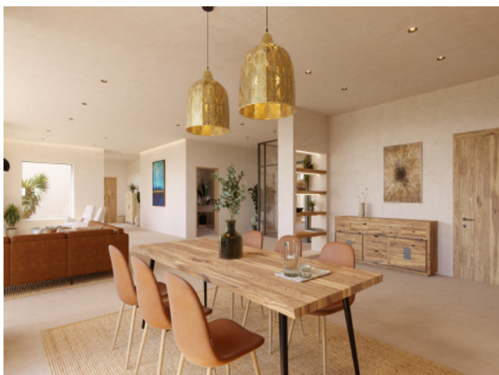
Visualisierungen Innen und Außen