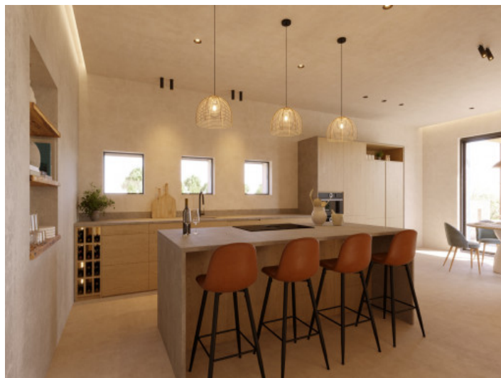
Visualisierungen Innen und Außen