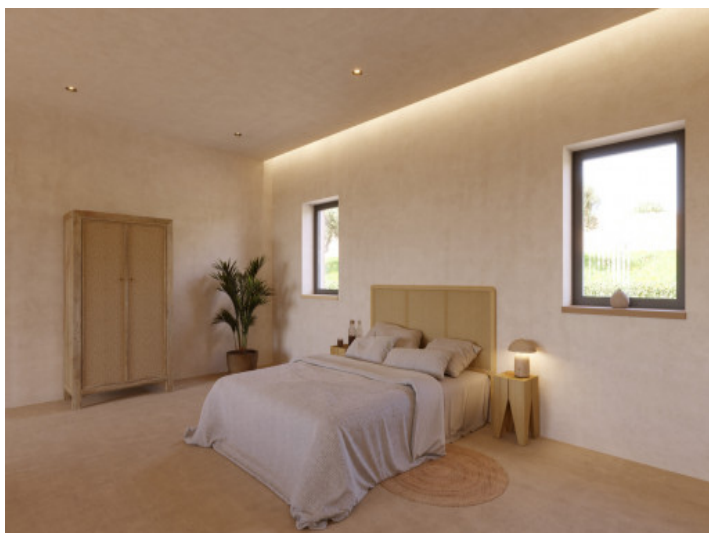
Visualisierungen Innen und Außen