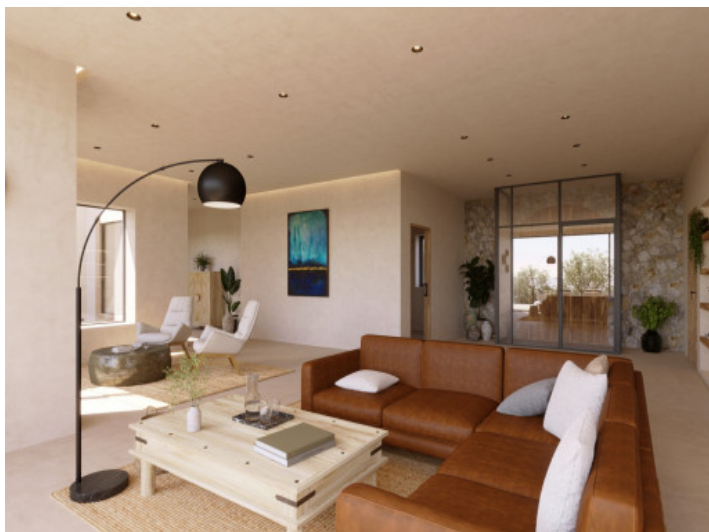
Visualisierungen Innen und Außen