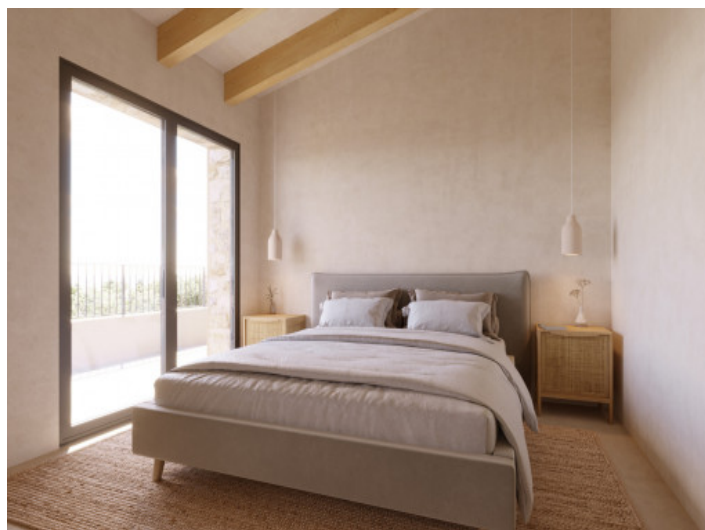
Visualisierungen Innen und Außen

Alle Angaben nach bestem Wissen. Irrtum und Zwischenverkauf vorbehalten. Dieses Exposé ist eine Vorinformation, als Rechtsgrundlage gilt allein der notariell abgeschlossene Kaufvertrag.