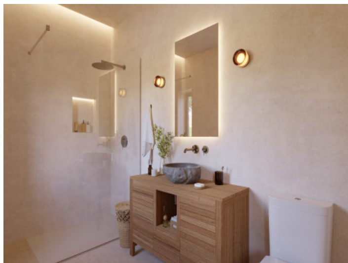
Visualisierungen Innen und Außen

Alle Angaben nach bestem Wissen. Irrtum und Zwischenverkauf vorbehalten. Dieses Exposé ist eine Vorinformation, als Rechtsgrundlage gilt allein der notariell abgeschlossene Kaufvertrag.