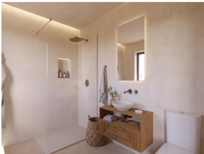
Visualisierungen Innen und Außen