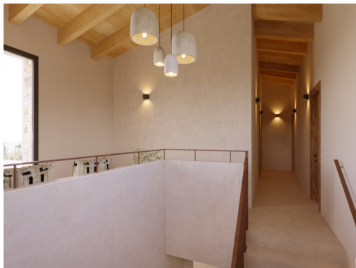
Visualisierungen Innen und Außen