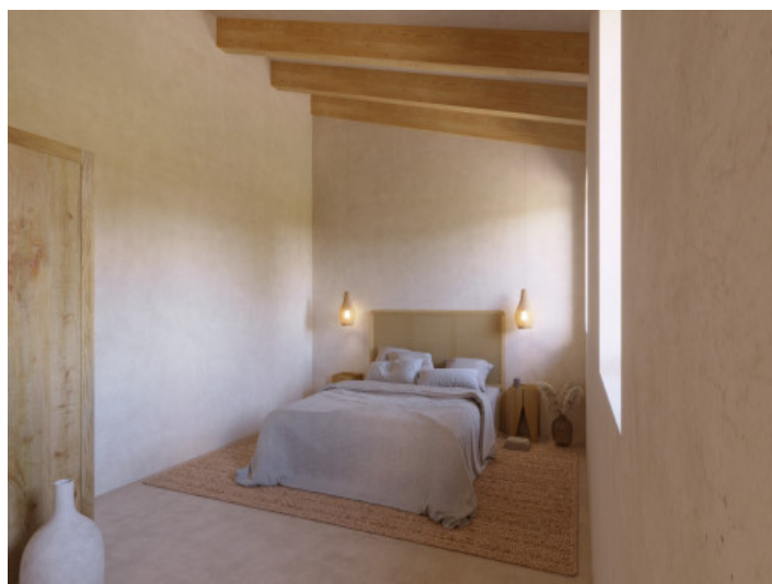
Visualisierungen Innen und Außen