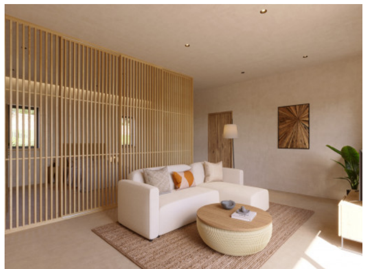
Visualisierungen Innen und Außen

Alle Angaben nach bestem Wissen. Irrtum und Zwischenverkauf vorbehalten. Dieses Exposé ist eine Vorinformation, als Rechtsgrundlage gilt allein der notariell abgeschlossene Kaufvertrag.