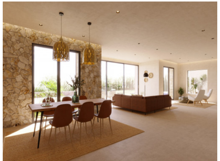
Visualisierungen Innen und Außen