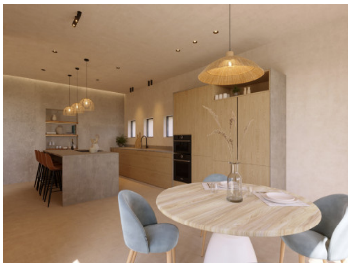
Visualisierungen Innen und Außen