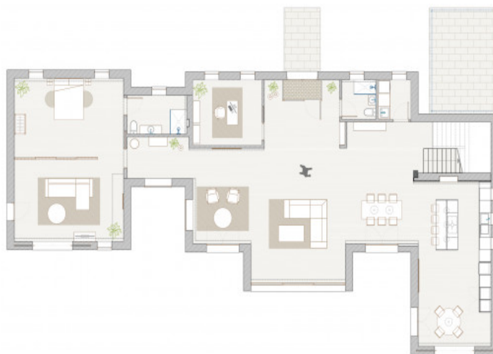
GROUND FLOOR PLAN ...