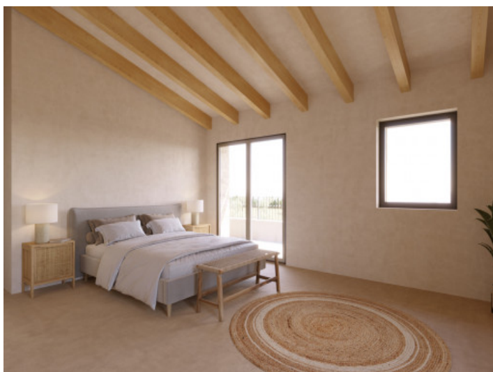
Visualisierungen Innen und Außen