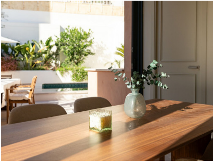
Essbereich mit Aussicht auf den Patio