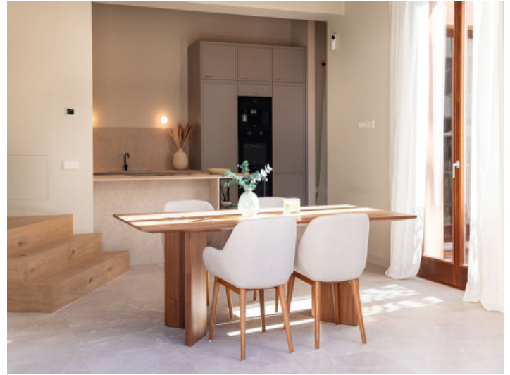
Essbereich vor der Küche