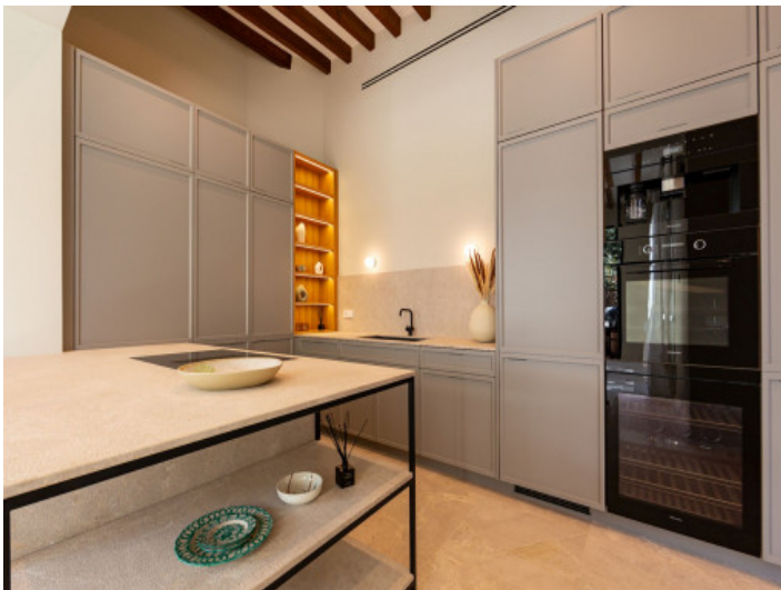
Küche mit viel Stauraum