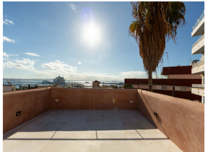
Dachterasse mit Traumaussicht