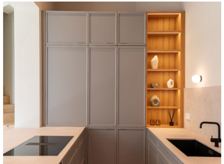
Arbeitsflächen aus Naturstein