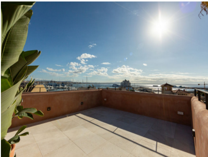
Dachterrasse mit Hafenblick