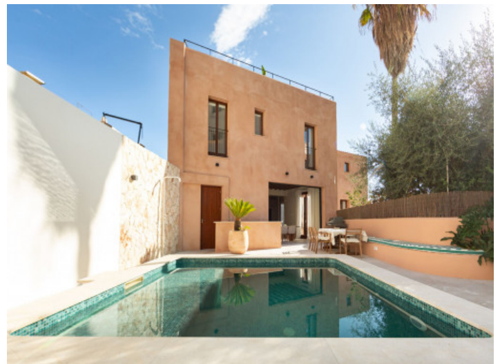
Pool und Ansicht auf die Fassade

Alle Angaben nach bestem Wissen. Irrtum und Zwischenverkauf vorbehalten. Dieses Exposé ist eine Vorinformation, als Rechtsgrundlage gilt allein der notariell abgeschlossene Kaufvertrag.