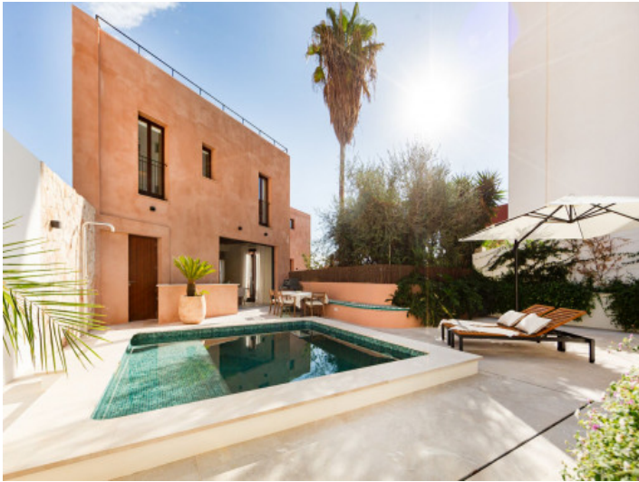
Schöner Patio mit Pool