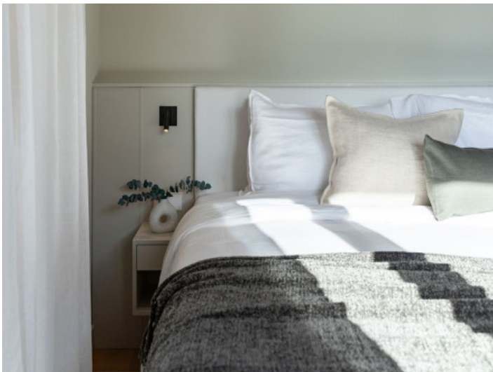
Haus mit 2 Schlafzimmern