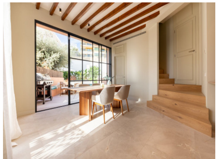
Essbereich mit viel Tageslicht

Alle Angaben nach bestem Wissen. Irrtum und Zwischenverkauf vorbehalten. Dieses Exposé ist eine Vorinformation, als Rechtsgrundlage gilt allein der notariell abgeschlossene Kaufvertrag.