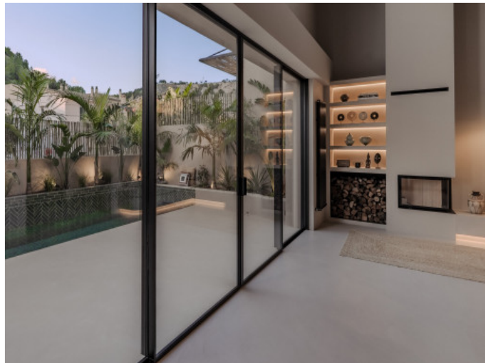
Wohnbereich mit angrenzender Terrasse