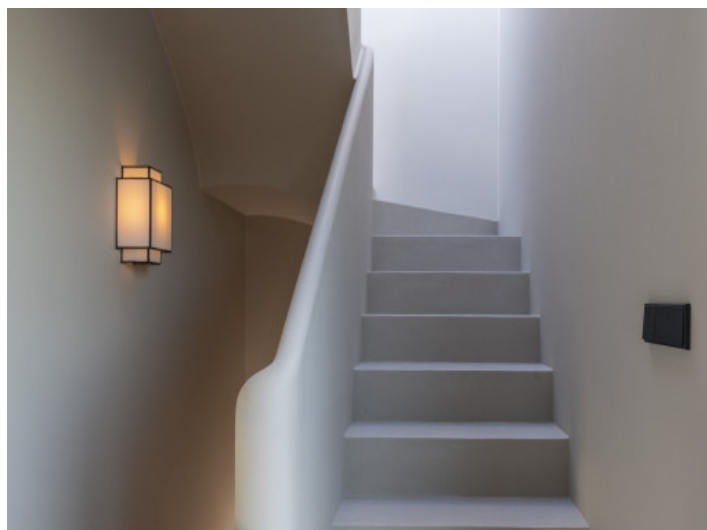
Treppe ins Obergeschoss

Alle Angaben nach bestem Wissen. Irrtum und Zwischenverkauf vorbehalten. Dieses Exposé ist eine Vorinformation, als Rechtsgrundlage gilt allein der notariell abgeschlossene Kaufvertrag.