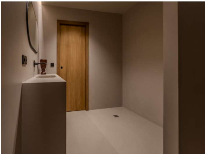
Badezimmer im Untergeschoss