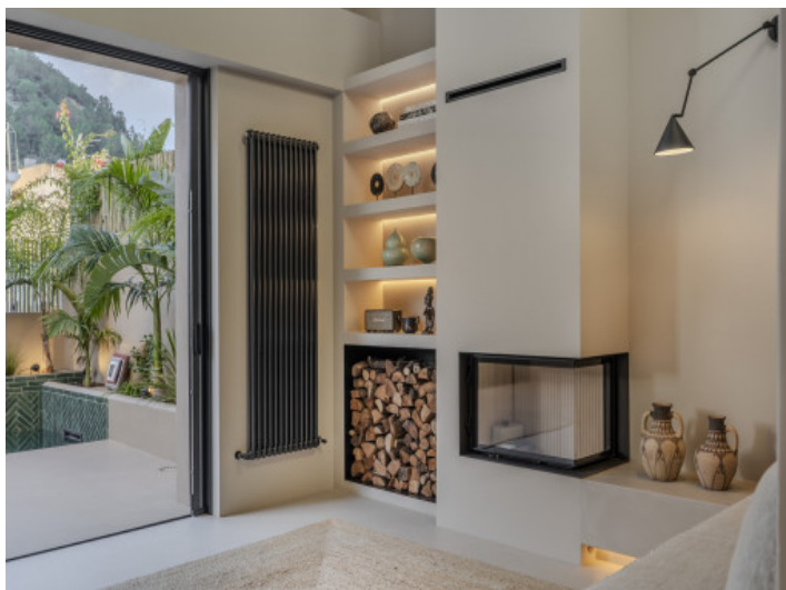
Kamin im Wohnbereich