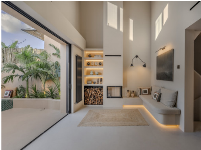
Wohnbereich mit angrenzender Terrasse