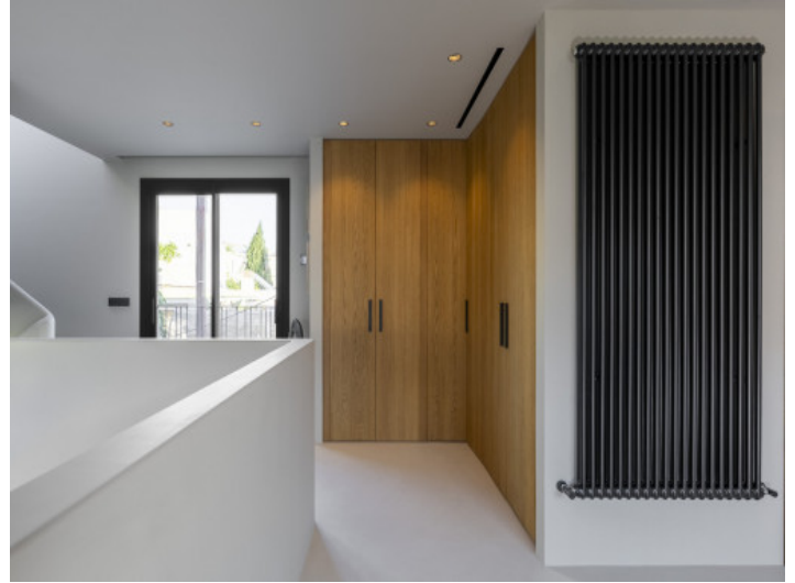
Master-Bereich mit angrenzendem Bad