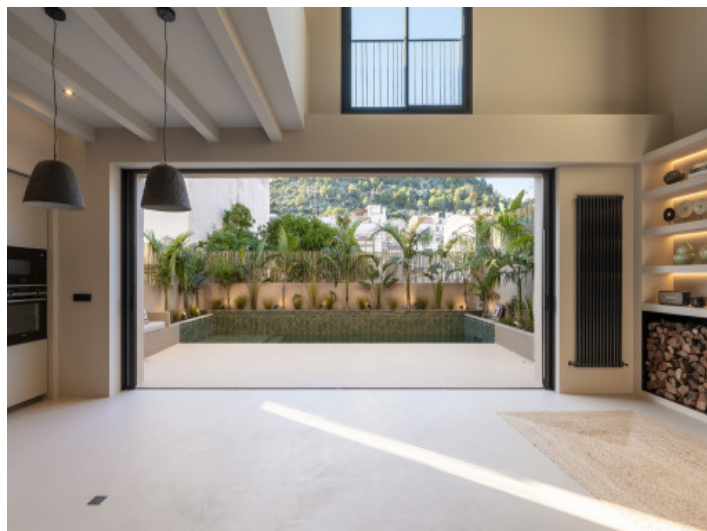
Wohnbereich mit Blick