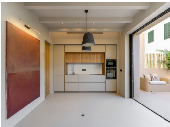
Wohnbereich mit angrenzender Terrasse