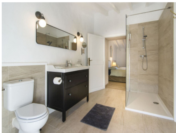
Badezimmer en Suite