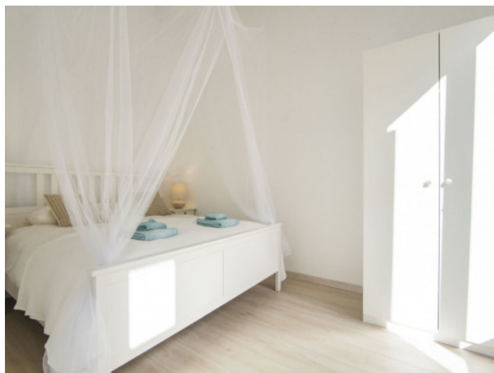
Eins von drei Doppelschlafzimmer

Alle Angaben nach bestem Wissen. Irrtum und Zwischenverkauf vorbehalten. Dieses Exposé ist eine Vorinformation, als Rechtsgrundlage gilt allein der notariell abgeschlossene Kaufvertrag.