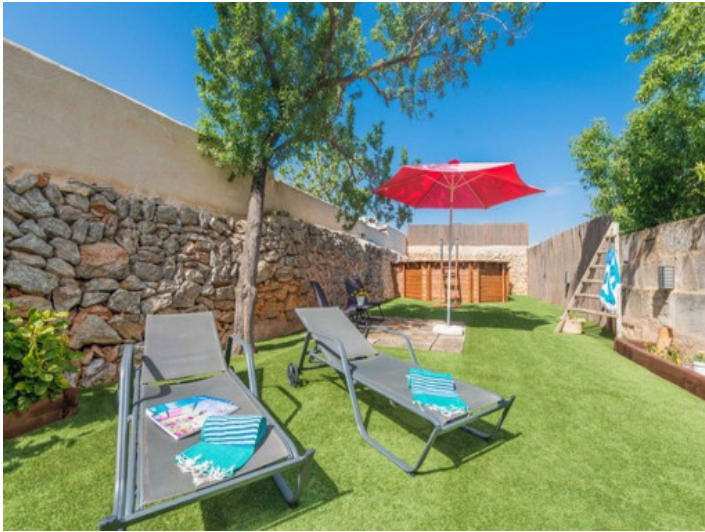
Garten mit Pool