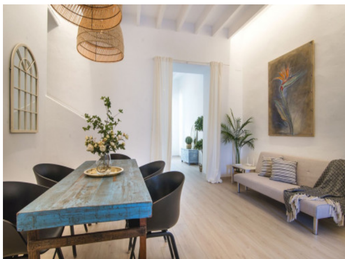
Wohn und Essbereich