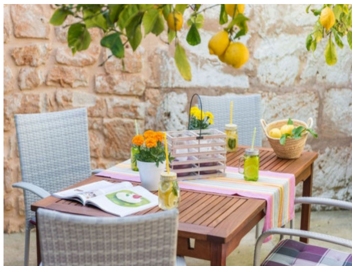
Innenhof mit Garten

Alle Angaben nach bestem Wissen. Irrtum und Zwischenverkauf vorbehalten. Dieses Exposé ist eine Vorinformation, als Rechtsgrundlage gilt allein der notariell abgeschlossene Kaufvertrag.