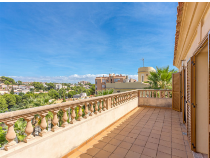
30 qm Balkon mit herrlichen Ausblick