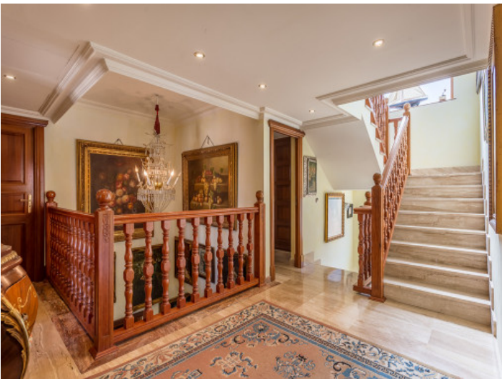
Das beeindruckende Haus hat eine Wohnfläche von 668 qm