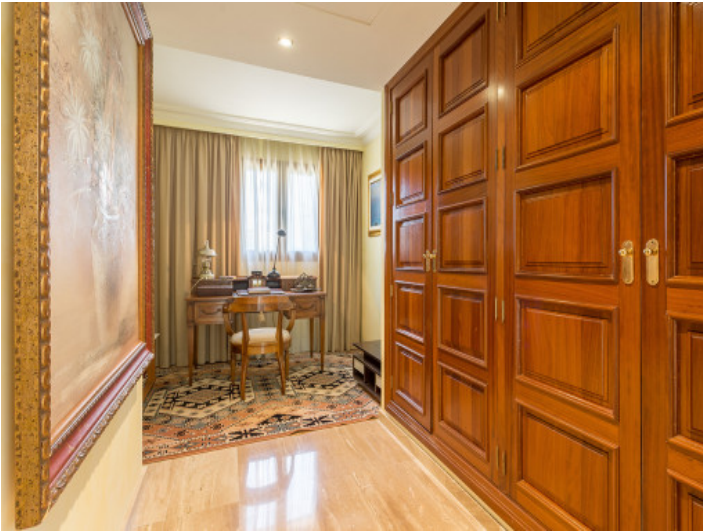
Weiterer Bürobereich mit geräumigen Einbauschränken