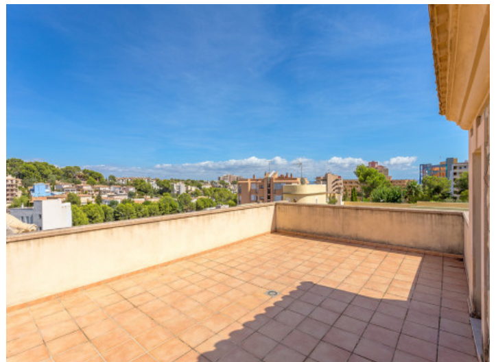
Die große Dachterrasse bietet einen Ausblick über die Umgebung

Alle Angaben nach bestem Wissen. Irrtum und Zwischenverkauf vorbehalten. Dieses Exposé ist eine Vorinformation, als Rechtsgrundlage gilt allein der notariell abgeschlossene Kaufvertrag.