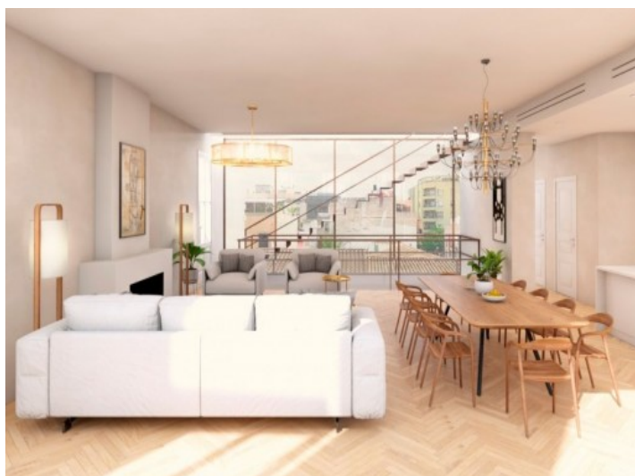
Das hochwertige Objekt hat eine Wohnfläche von 156 qm