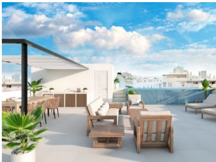
Fantastische Dachterrasse mit Pool, Sommerküche und Loungebereich