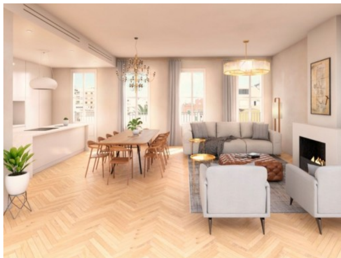
Eleganter Wohn- und Essbereich mit offener Küche