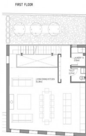
Bauzeichnung des ersten Stockes