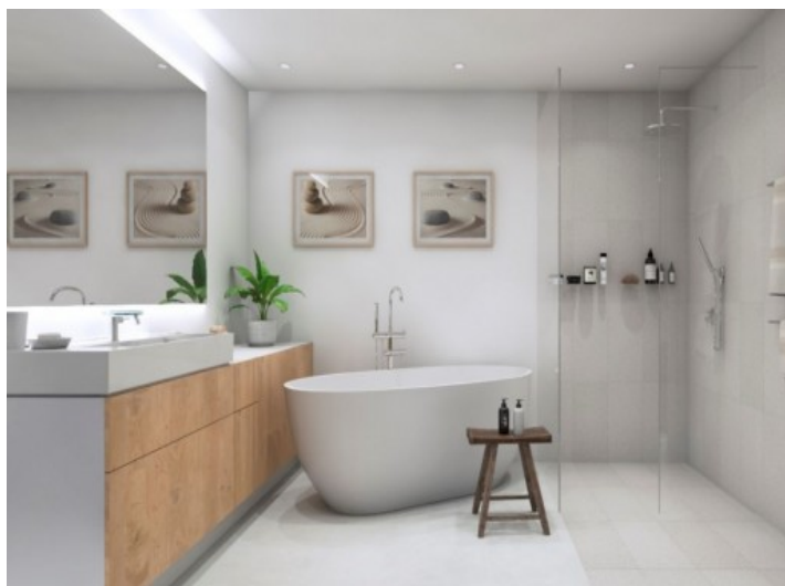
Eines von 2 luxuriösen Badezimmern