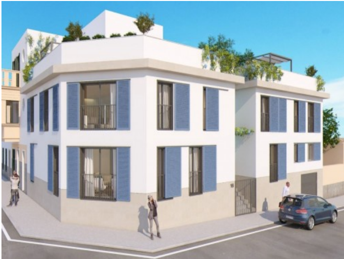
Außenansicht des neuen Reihenhauses