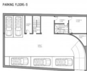
Bauzeichnung der Garage