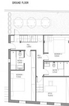
Bauzeichnung des Erdgeschosses