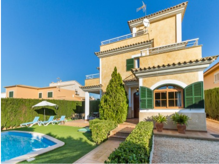
Herrliche Frontansicht des Hauses