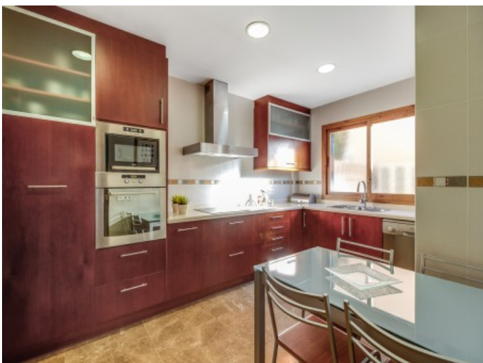
Voll ausgestattete, charmante Küche