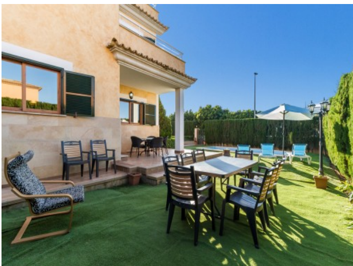
Essbereich im Garten