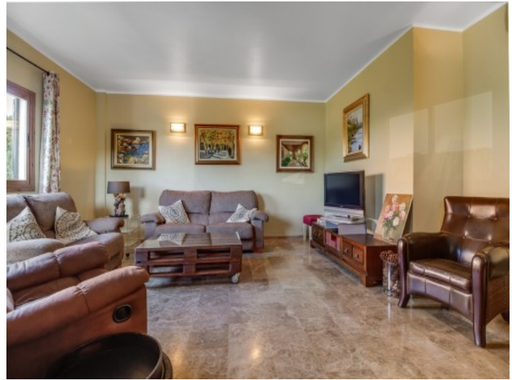
Gemütlicher und großzügiger Wohnbereich