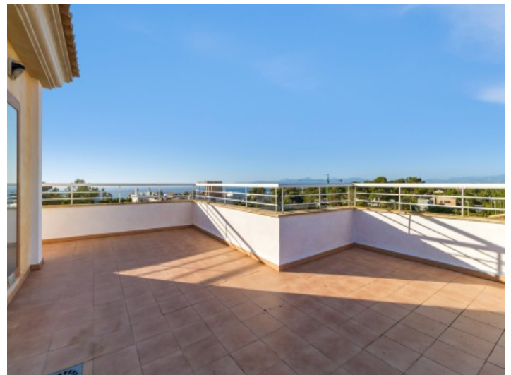
Traumhafte Terrasse mit Ausblick