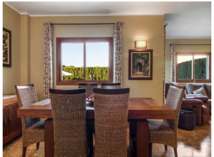
Wunderschöner, heller Essbereich