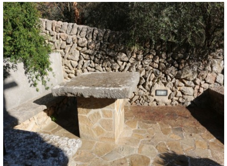
Sitzecke im Außenbereich

Alle Angaben nach bestem Wissen. Irrtum und Zwischenverkauf vorbehalten. Dieses Exposé ist eine Vorinformation, als Rechtsgrundlage gilt allein der notariell abgeschlossene Kaufvertrag.