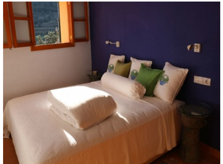
Hauptschlafzimmer mit Landschaftsblick