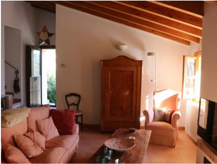
Wohnbereich mit Holzdeckenbalken