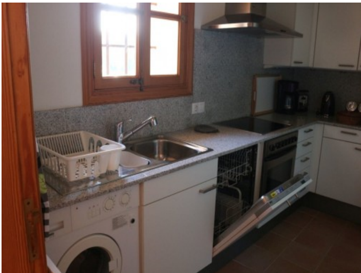
Küche der Finca