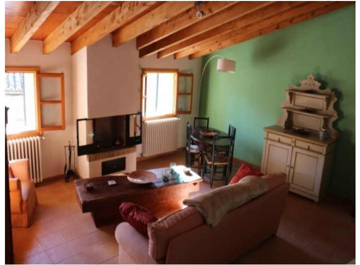
Alternative Ansicht des Wohnbereichs