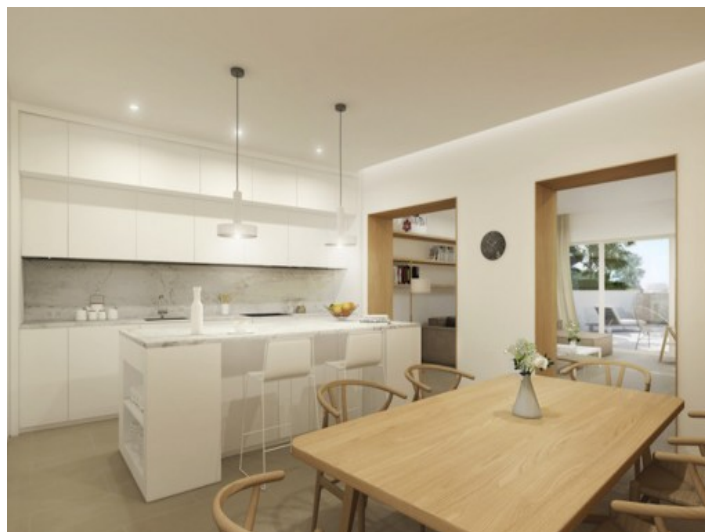
Offener Wohnbereich und Küche