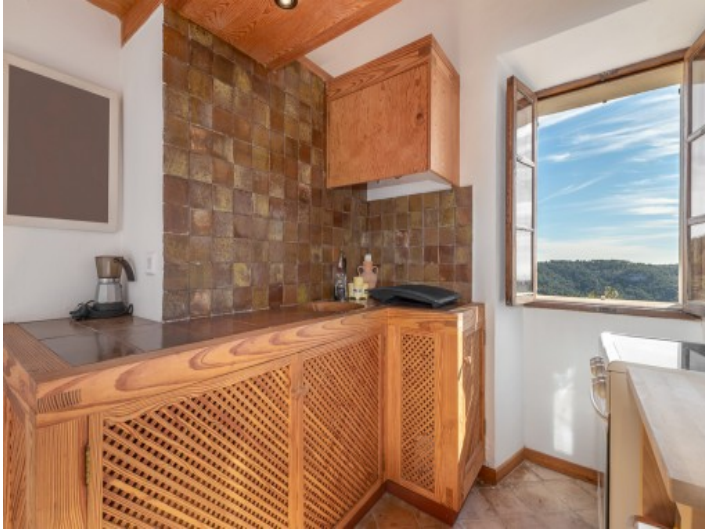
Kleine Küche im Untergeschoss