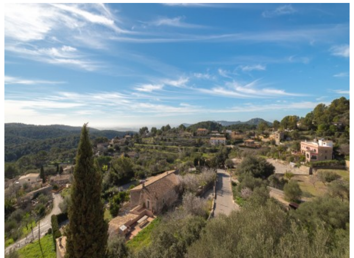
Idyllischer Landschafts- und Bergblick

Alle Angaben nach bestem Wissen. Irrtum und Zwischenverkauf vorbehalten. Dieses Exposé ist eine Vorinformation, als Rechtsgrundlage gilt allein der notariell abgeschlossene Kaufvertrag.