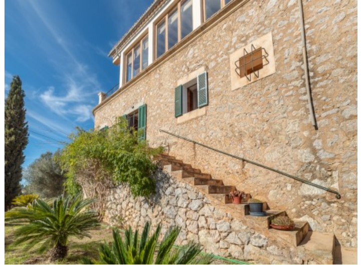
Außen-Steintreppe zum Garten