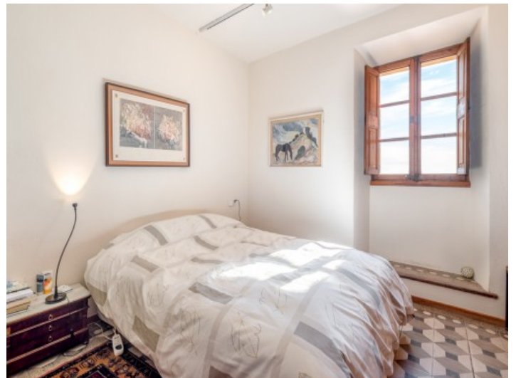
Eines von 4 Schlafzimmer