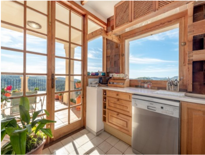
Zugang zur herrlichen Terrasse