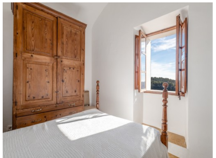
Eines von 4 Schlafzimmer

Alle Angaben nach bestem Wissen. Irrtum und Zwischenverkauf vorbehalten. Dieses Exposé ist eine Vorinformation, als Rechtsgrundlage gilt allein der notariell abgeschlossene Kaufvertrag.