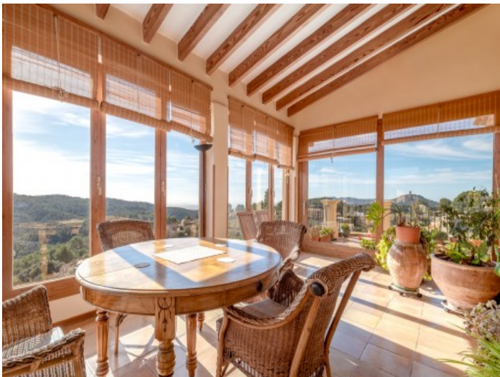
Sehr heller Wintergarten mit Panoramablick