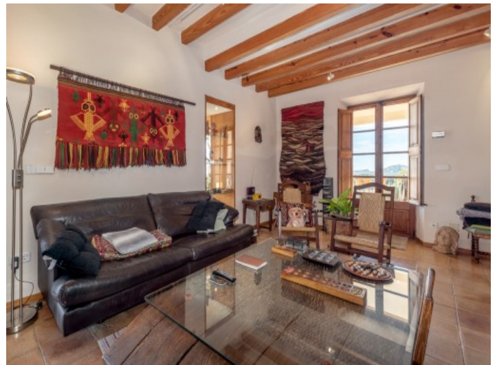
Wohnbereich mit Holzdeckenbalken