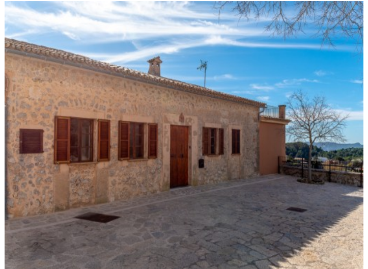
Frontansicht und Zugang zum Haus