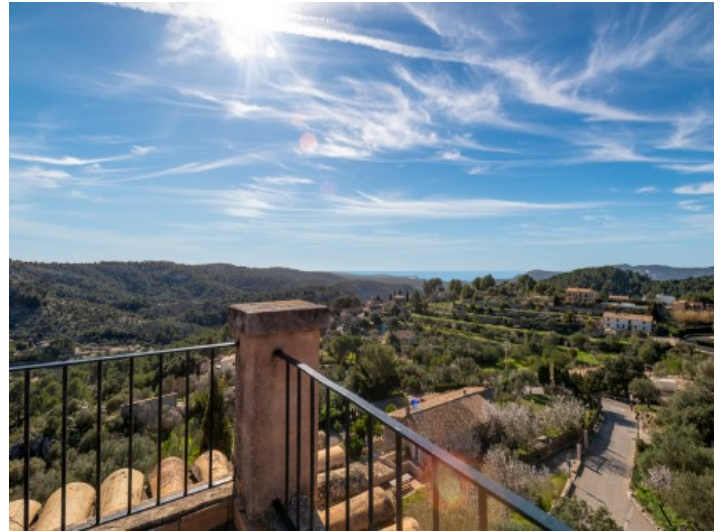
Terrasse mit fantastischen Weitblick