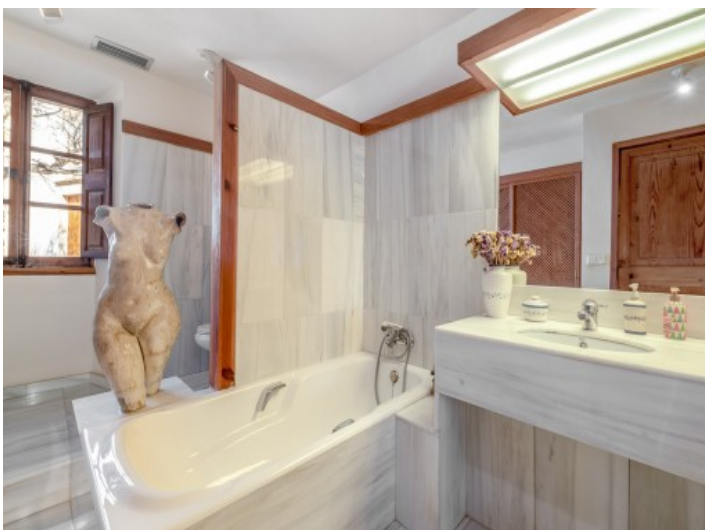
Eines von 2 Badezimmer