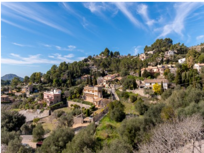
Blick über das Dorf Galilea