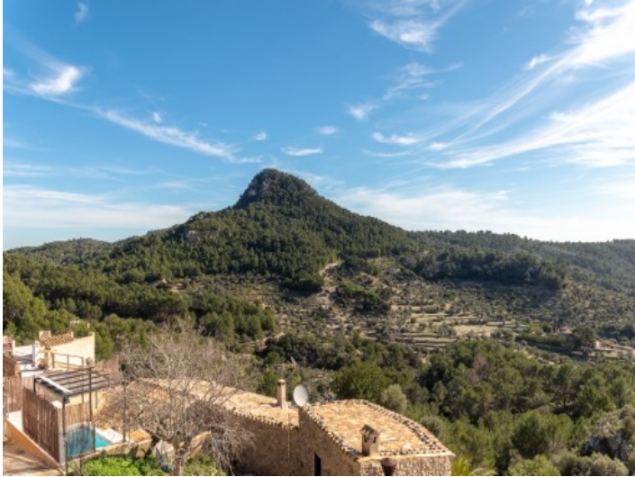
Blick auf einen kleinen Berg