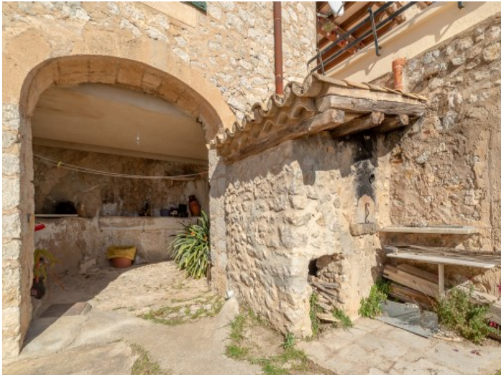
Außenbereich mit Steinofen