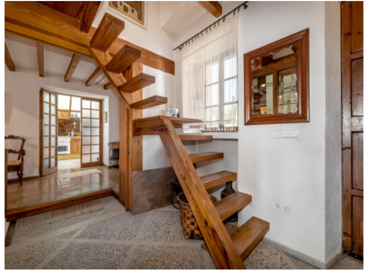
Holztreppe ins Obergeschoss