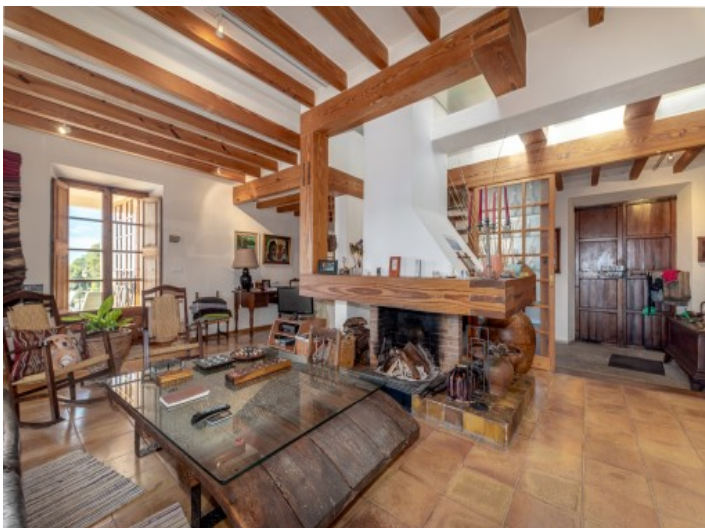
Blick zum rustikalen Kaminbereich