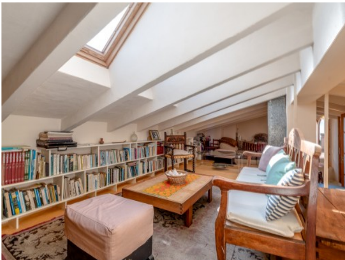
Gemütlicher Leseraum im Obergeschoss