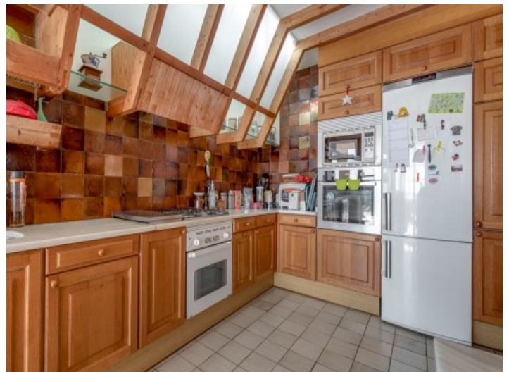
Große, ausgestattete Küche

Alle Angaben nach bestem Wissen. Irrtum und Zwischenverkauf vorbehalten. Dieses Exposé ist eine Vorinformation, als Rechtsgrundlage gilt allein der notariell abgeschlossene Kaufvertrag.