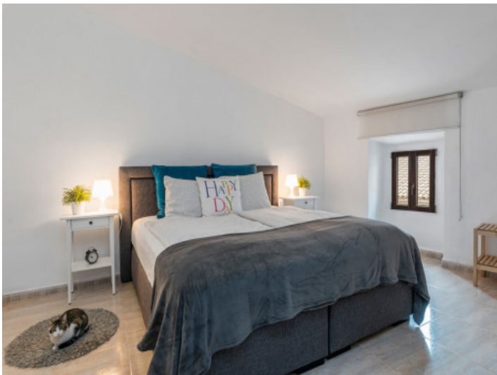
Eines von 2 Doppelschlafzimmer