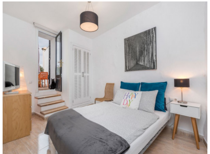
Schlafzimmer mit direkten Terrassenzugang