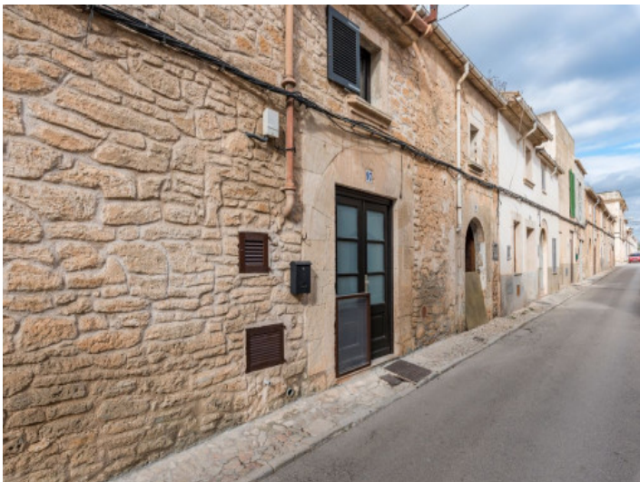
Außenansicht des Dorfhauses