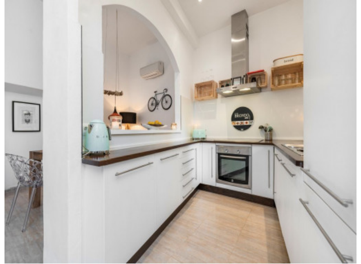
Moderne und voll ausgestattete Küche