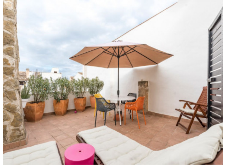
Großer Terrasse im Obergeschoss