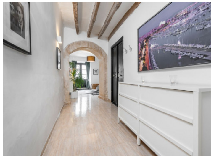
Flur mit authentischen Steinbogen

Alle Angaben nach bestem Wissen. Irrtum und Zwischenverkauf vorbehalten. Dieses Exposé ist eine Vorinformation, als Rechtsgrundlage gilt allein der notariell abgeschlossene Kaufvertrag.