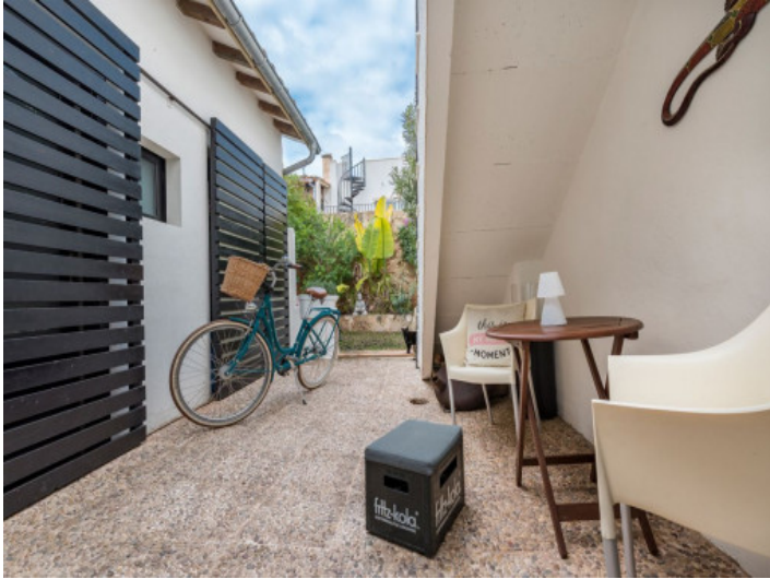
Herrlicher Patio mit kleinen Garten