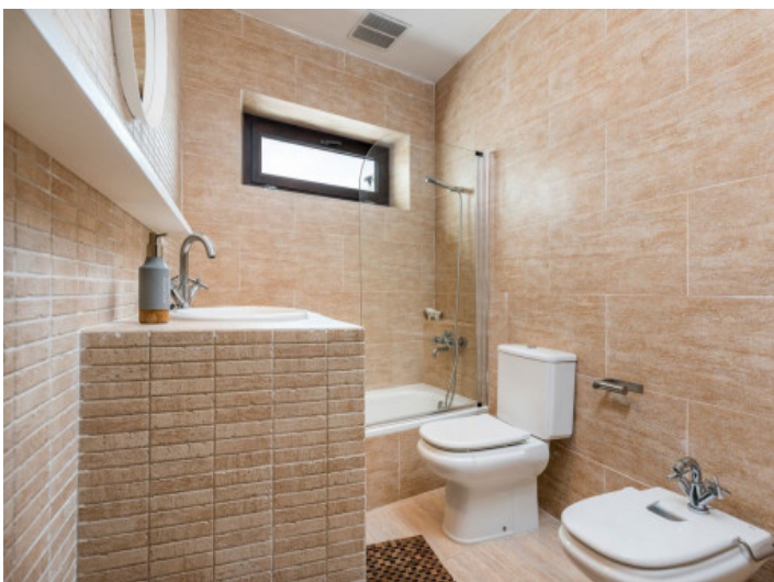
Modernes Badezimmer mit Badewanne