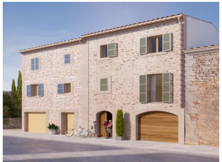
Außenansicht des Hauses

Alle Angaben nach bestem Wissen. Irrtum und Zwischenverkauf vorbehalten. Dieses Exposé ist eine Vorinformation, als Rechtsgrundlage gilt allein der notariell abgeschlossene Kaufvertrag.