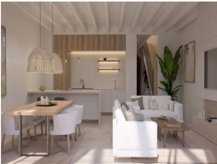
Heller Wohn- und Essbereich