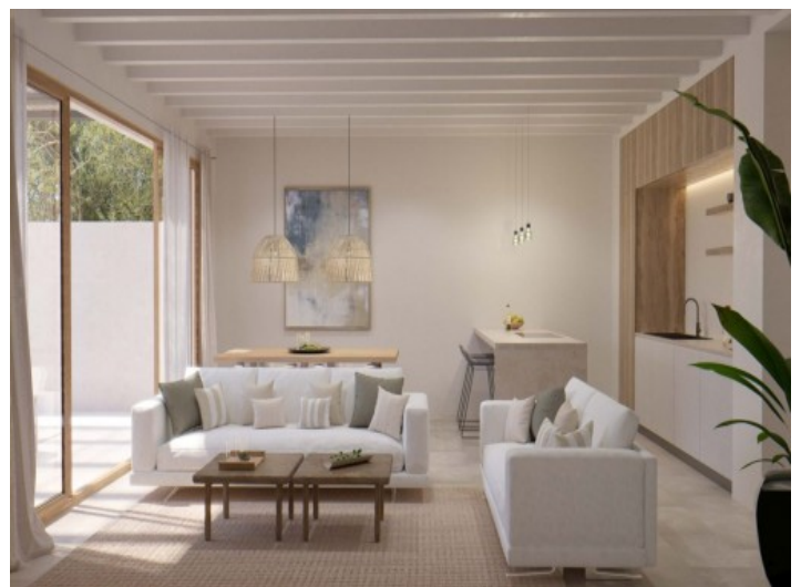
Außenansicht des Hauses

Alle Angaben nach bestem Wissen. Irrtum und Zwischenverkauf vorbehalten. Dieses Exposé ist eine Vorinformation, als Rechtsgrundlage gilt allein der notariell abgeschlossene Kaufvertrag.