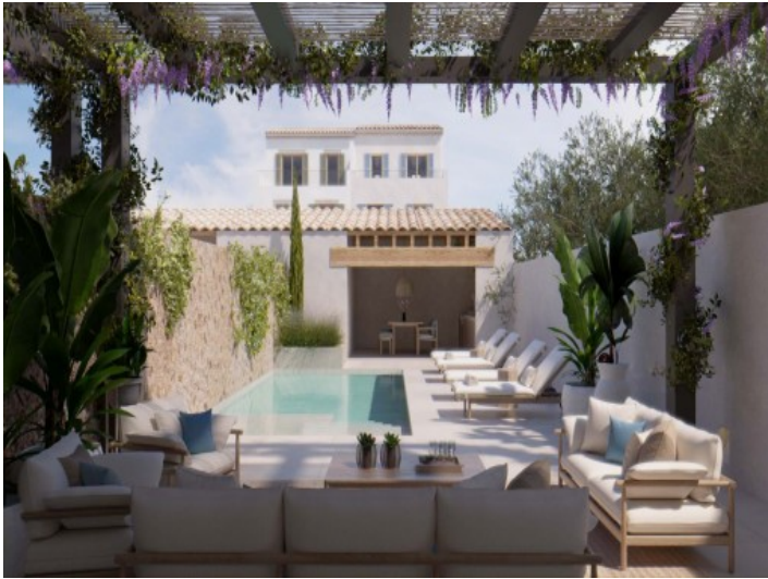
Blick zum Pool