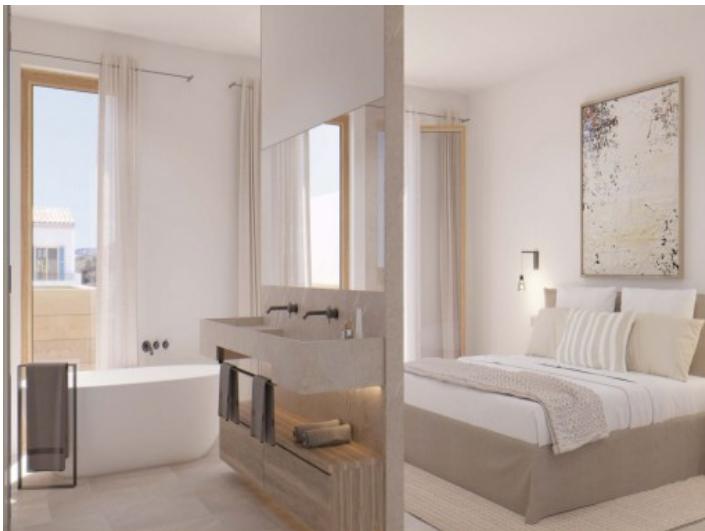
Heller Wohn- und Essbereich