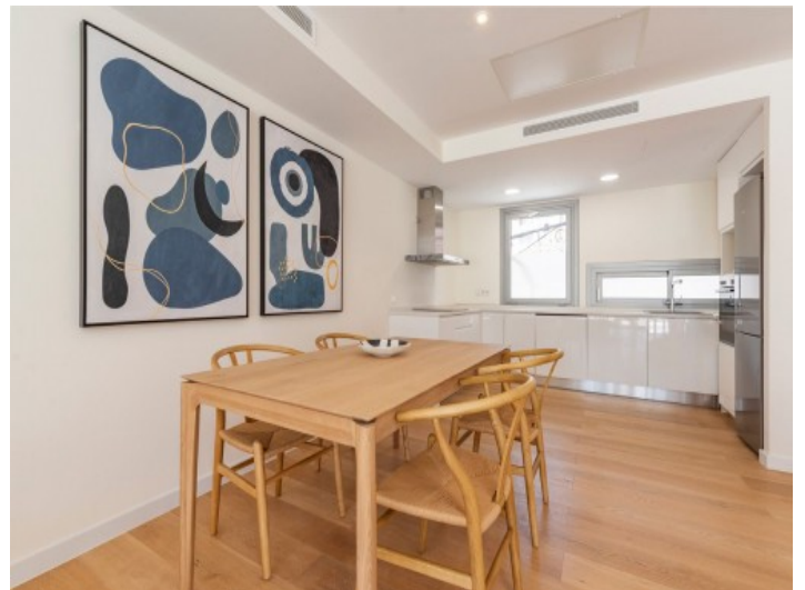
Offener Wohn- Essbereich