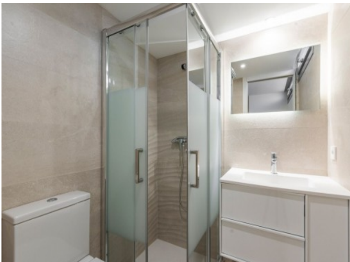
Badezimmer mit Dusche