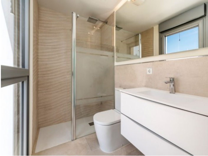
Badezimmer mit Dusche