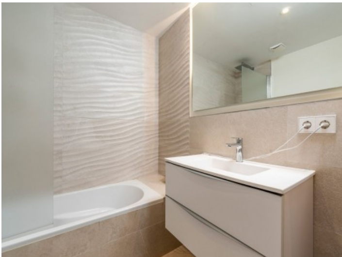
Badezimmer mit Badewanne