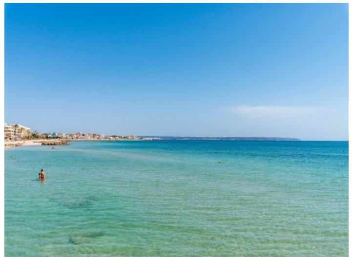
Blick über Molinar

Alle Angaben nach bestem Wissen. Irrtum und Zwischenverkauf vorbehalten. Dieses Exposé ist eine Vorinformation, als Rechtsgrundlage gilt allein der notariell abgeschlossene Kaufvertrag.