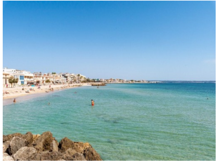
Blick über Molinar