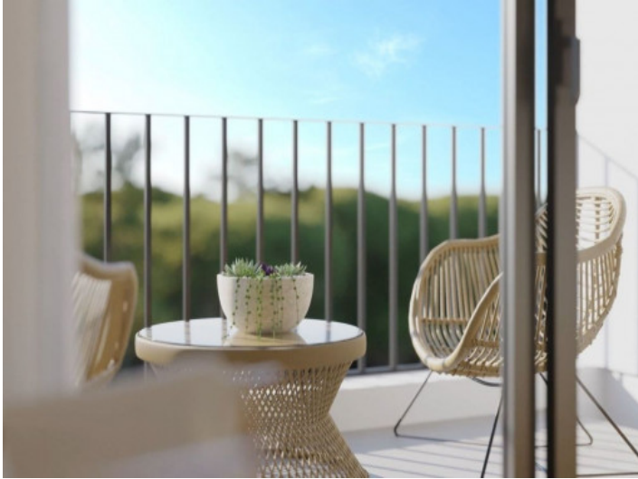
Blick auf den Balkon