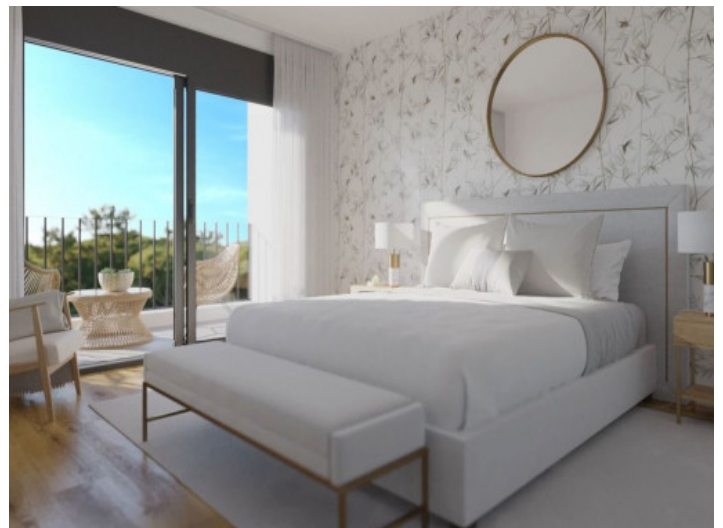
Doppelzimmer mit Balkon

Alle Angaben nach bestem Wissen. Irrtum und Zwischenverkauf vorbehalten. Dieses Exposé ist eine Vorinformation, als Rechtsgrundlage gilt allein der notariell abgeschlossene Kaufvertrag.