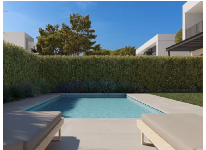
Pool mit Sonnenliegen