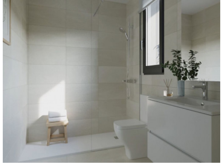
Nobles Badezimmer mit ebenerdiger Dusche