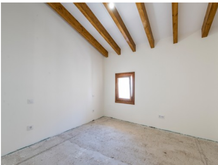
Eines von 3 Schlafzimmern