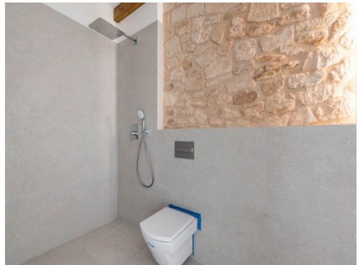
Eines von 2 Badezimmern