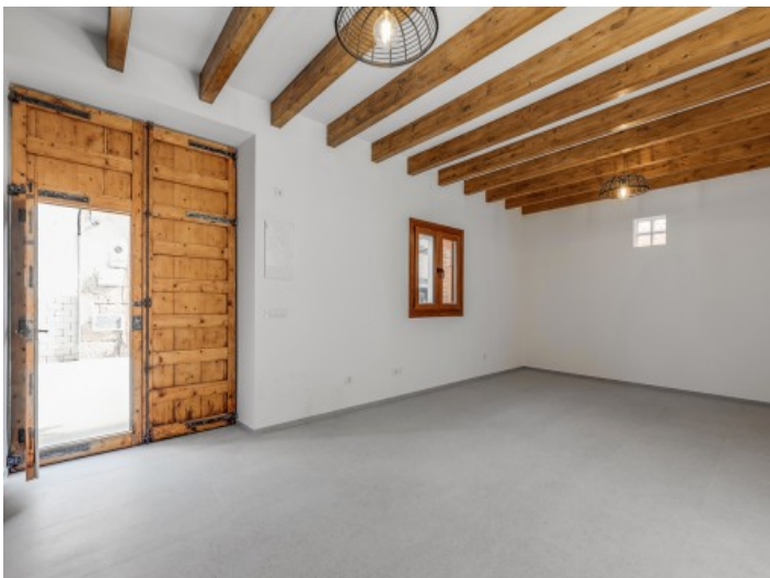
Großer Eingangs- und Wohnbereich