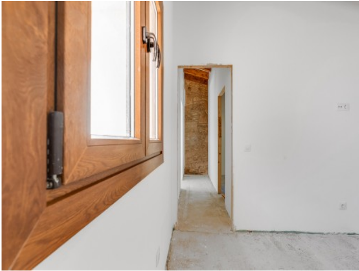
Ansicht des Obergeschosses