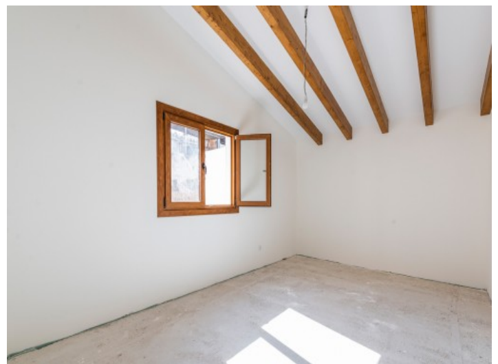
Eines von 3 Schlafzimmern

Alle Angaben nach bestem Wissen. Irrtum und Zwischenverkauf vorbehalten. Dieses Exposé ist eine Vorinformation, als Rechtsgrundlage gilt allein der notariell abgeschlossene Kaufvertrag.