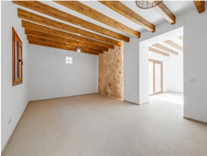
Wohnbereich mit schöner Sandsteinwand