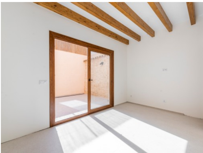
Direkter Zugang zur Terrasse