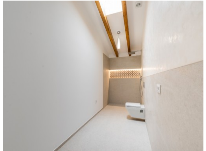
Eines von 2 Badezimmern