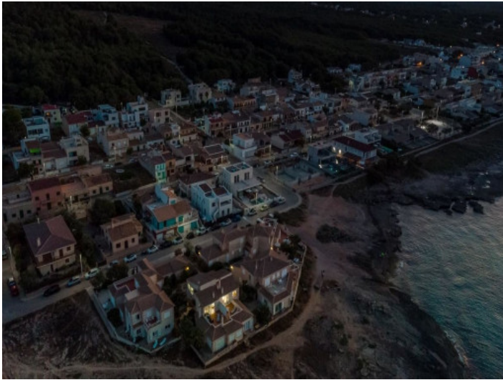
Duplex aus der Vogelperspektive