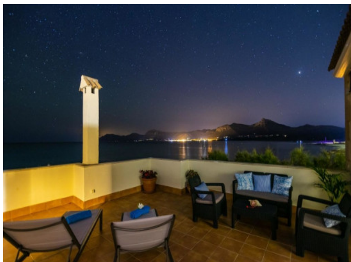
Dachterrasse bei Nacht