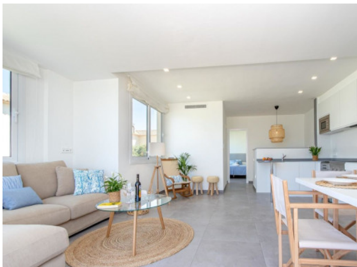
Moderner Wohn-und Essbereich