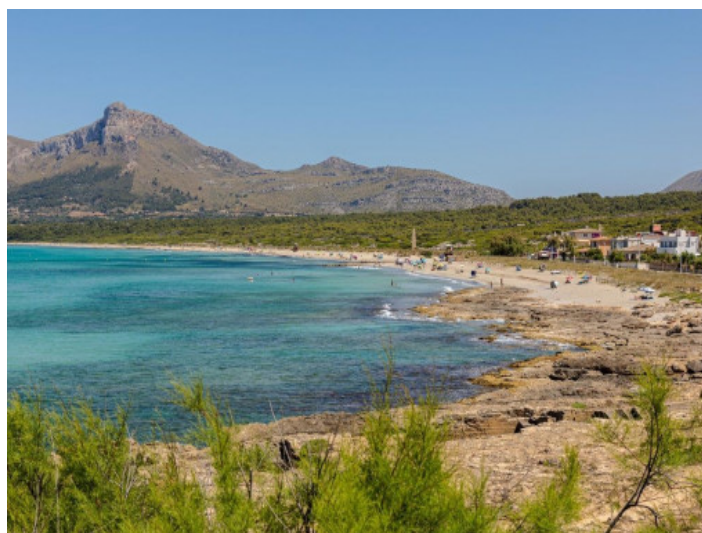
Strand von Son Serra de Marina