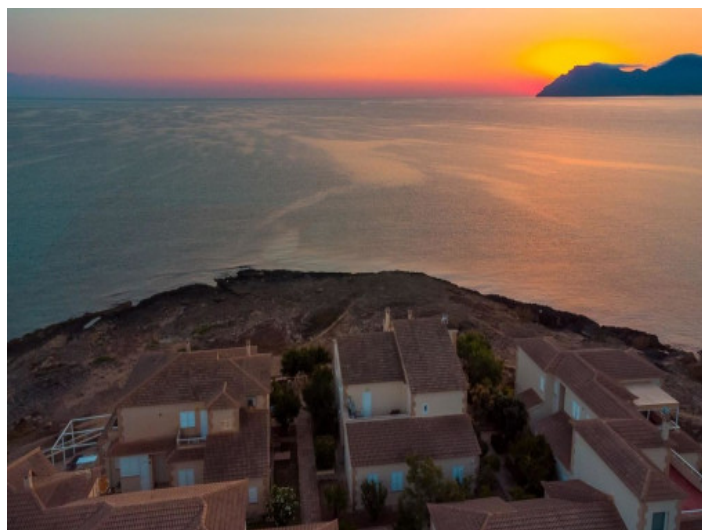
Duplex aus der Vogelperspektive

Alle Angaben nach bestem Wissen. Irrtum und Zwischenverkauf vorbehalten. Dieses Exposé ist eine Vorinformation, als Rechtsgrundlage gilt allein der notariell abgeschlossene Kaufvertrag.