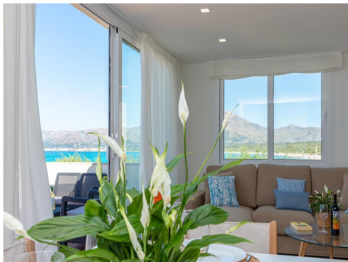
Zugang zum Wohnbereich