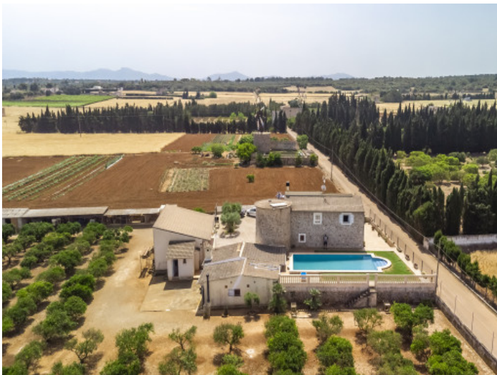
Außenansicht mit Grundstück