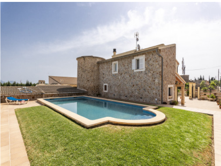
Poolbereich und Ansicht der Finca