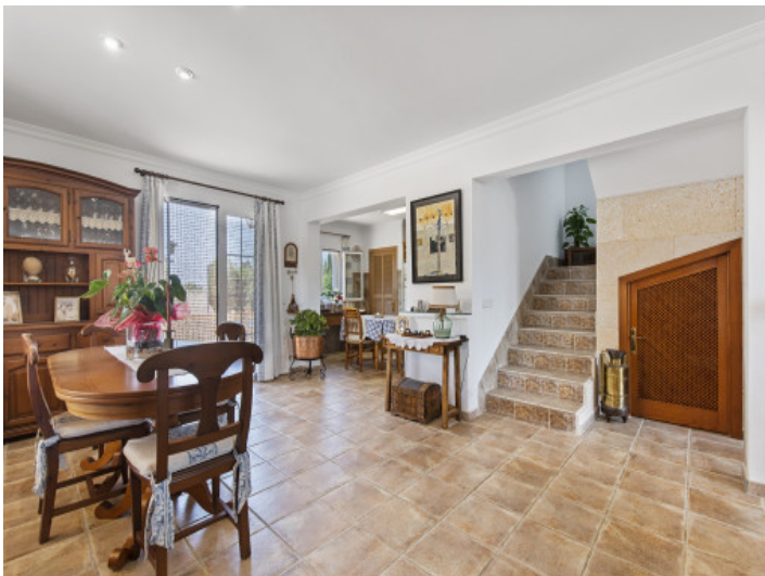
Großer, offener Essbereich