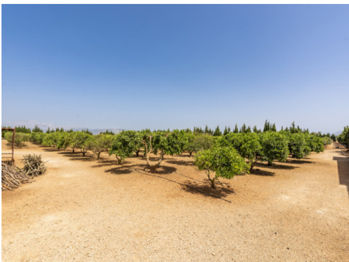
Großes Grundstück mit Obstbäumen