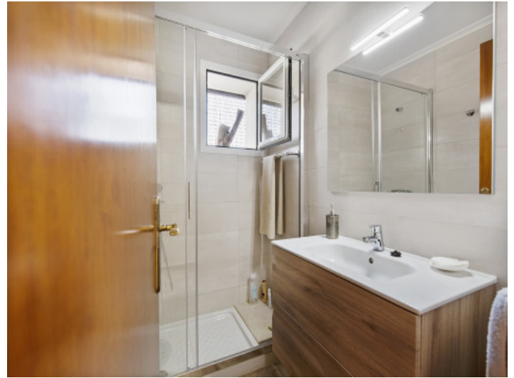
Eines von 3 Badezimmern