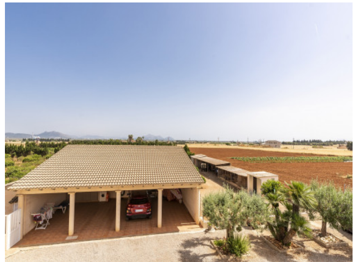
Blick auf den Carport