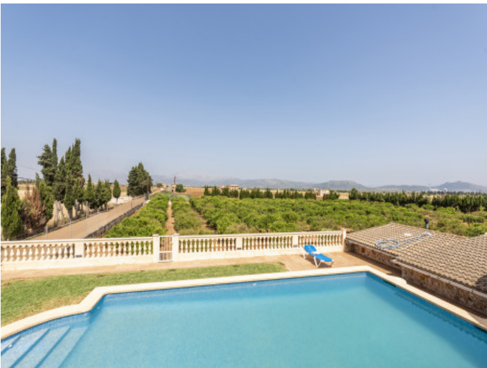
Pool mit Weitblick über die Landschaft