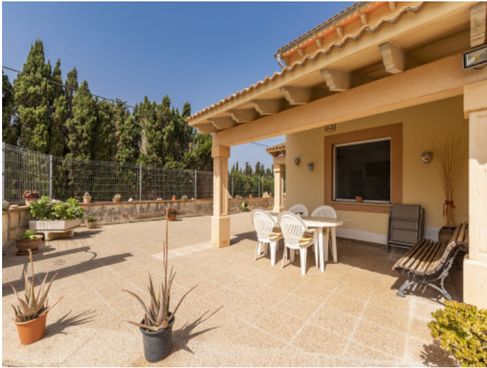
Teilweise überdachte Terrasse