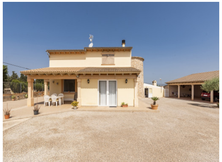
Außenansicht, Außenbereich und Carport

Alle Angaben nach bestem Wissen. Irrtum und Zwischenverkauf vorbehalten. Dieses Exposé ist eine Vorinformation, als Rechtsgrundlage gilt allein der notariell abgeschlossene Kaufvertrag.