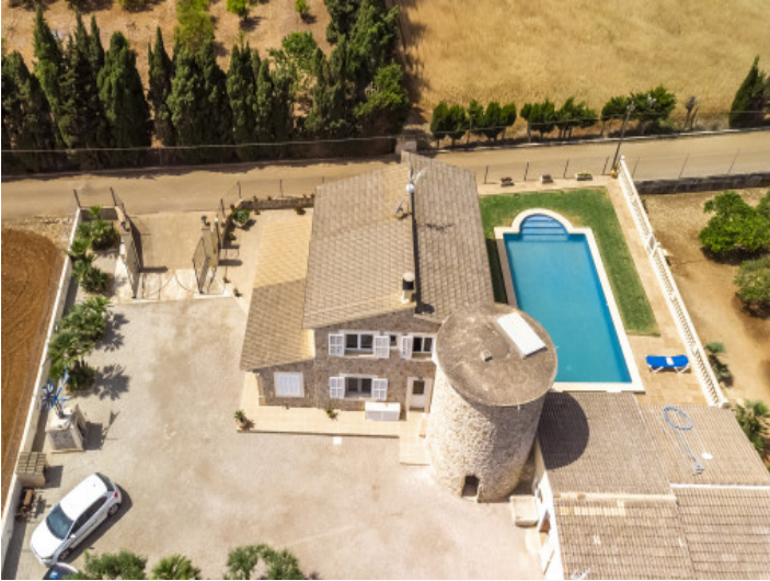
Blick auf das Anwesen von oben