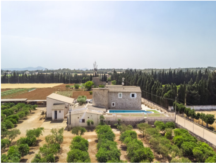
Außenansicht mit Grundstück