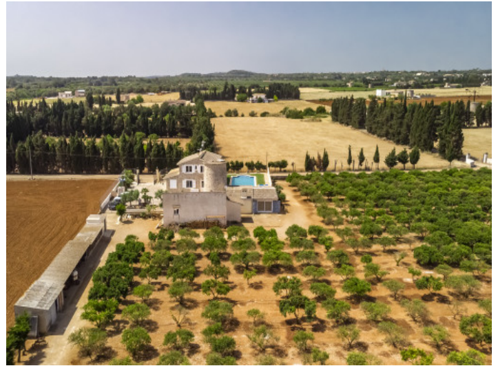
Außenansicht mit Grundstück