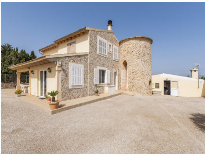
Ansicht der Finca mit Turm