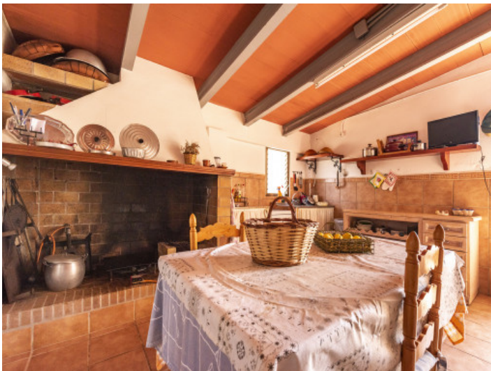
Rustikaler Grillbereich mit Terrasse