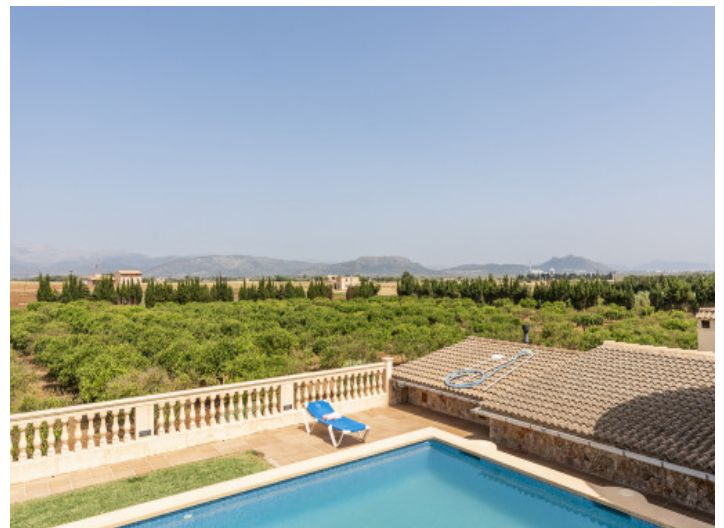
Pool und Ausblick

Alle Angaben nach bestem Wissen. Irrtum und Zwischenverkauf vorbehalten. Dieses Exposé ist eine Vorinformation, als Rechtsgrundlage gilt allein der notariell abgeschlossene Kaufvertrag.