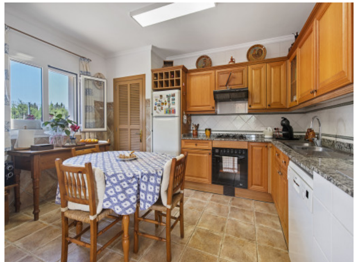
Große Küche mit Essbereich