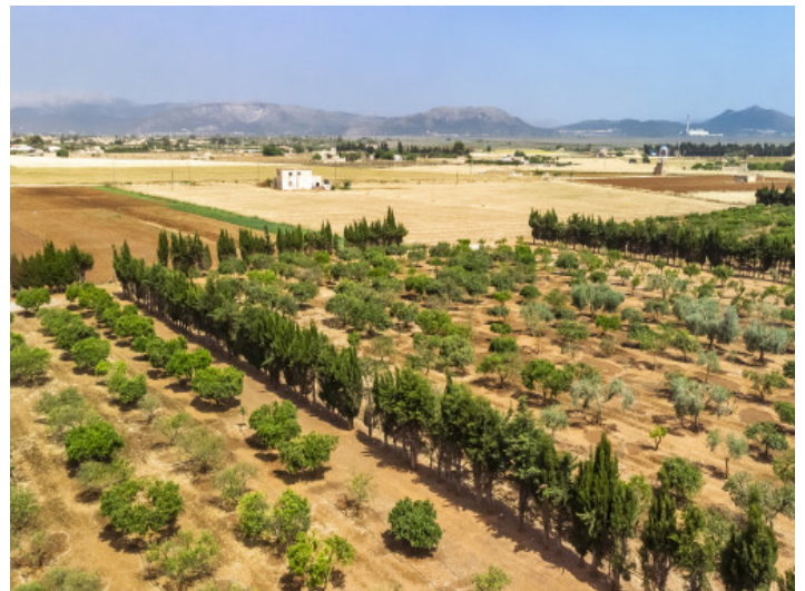
Blick über das Grundstück