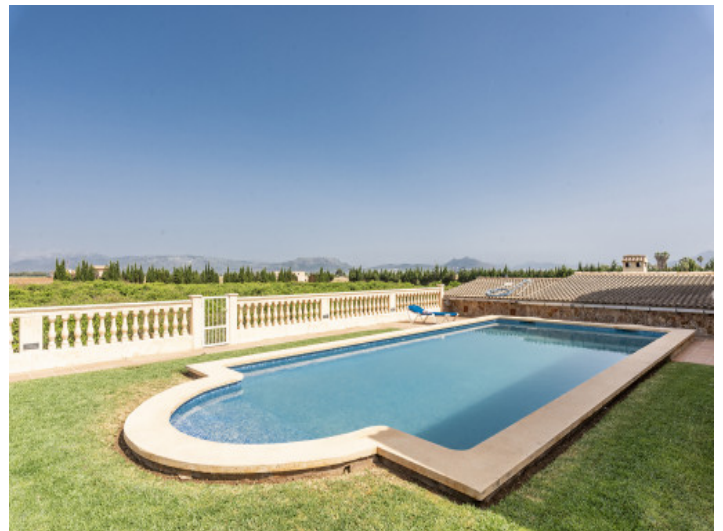
Großer, idyllischer Poolbereich