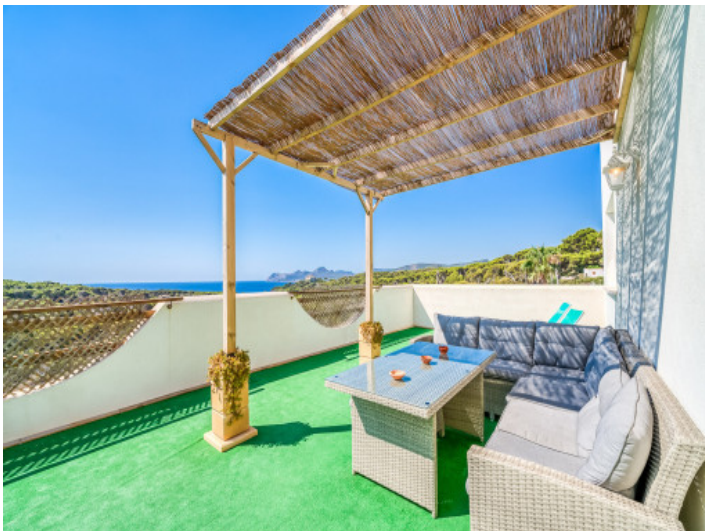
Dachterrasse mit unglaublichen Meerblick