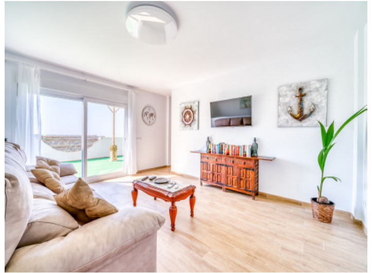
Wohnbereich im Obergeschoss