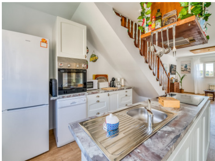
Küche mit Kochinsel