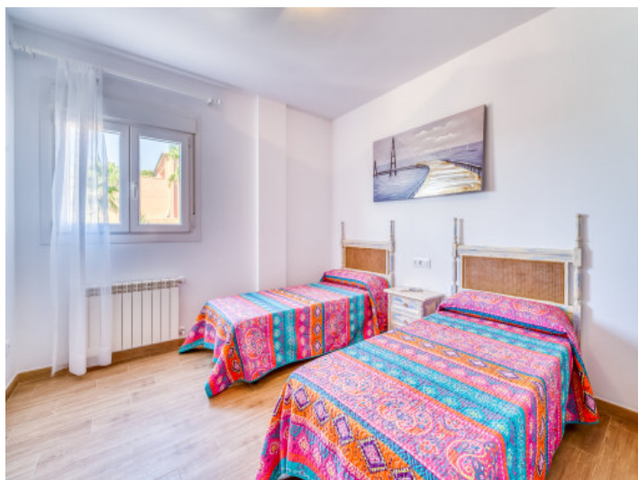
Eines von fünf Schlafzimmer