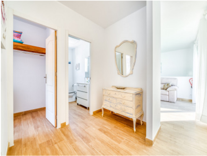
Flur im Obergeschoss