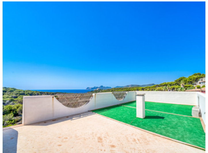
Dachterrasse ist noch gestaltbar...