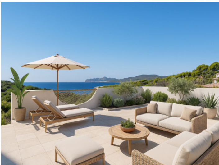
.... hier ein mögliches Beispiel