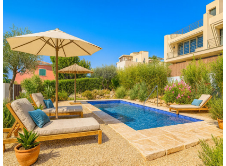
Der Poolbereich ist noch gestaltbar – hier ein mögliches Beispiel