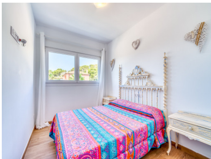
Eines von fünf Schlafzimmer