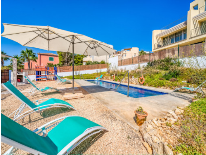
Außenbereich mit Pool und Sonnenterrassen