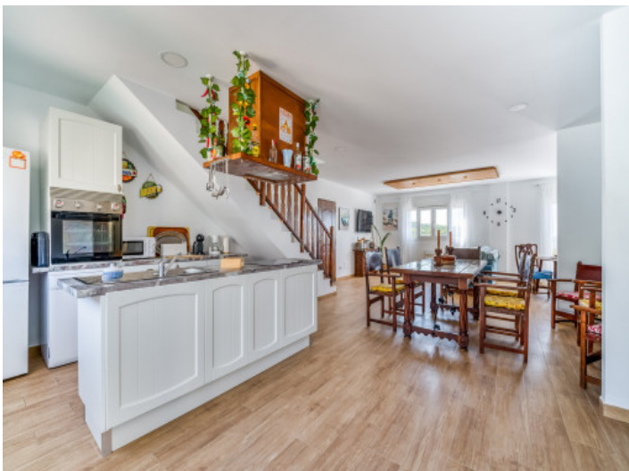
Geräumige Küche und Essbereich