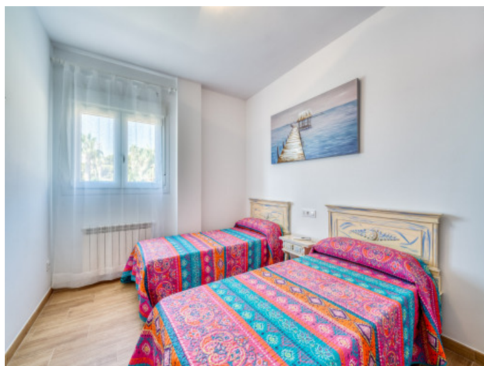
Eines von fünf Schlafzimmer