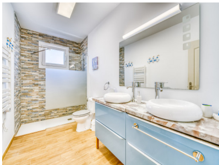
Eines von drei Badezimmer

Alle Angaben nach bestem Wissen. Irrtum und Zwischenverkauf vorbehalten. Dieses Exposé ist eine Vorinformation, als Rechtsgrundlage gilt allein der notariell abgeschlossene Kaufvertrag.