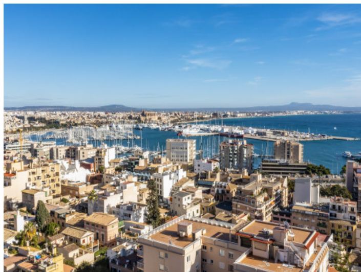
Stadt nah zu Palma und Hafen