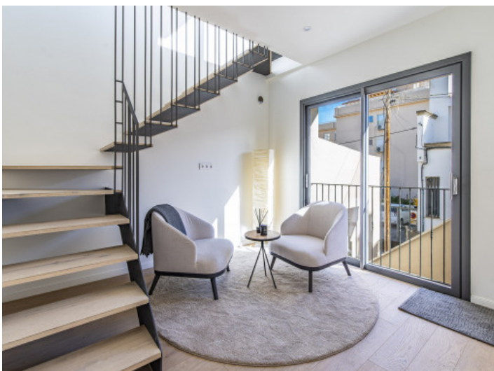
Eingangshalle und Zugang zu allen Etagen