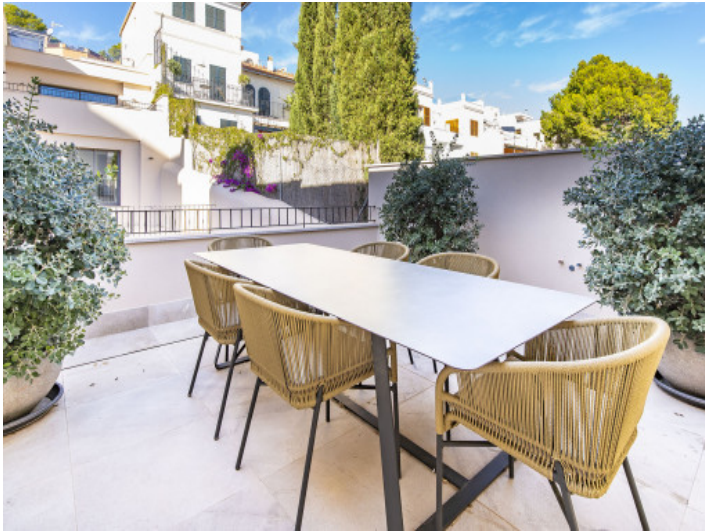
Eleganter Outdoor Essbereich