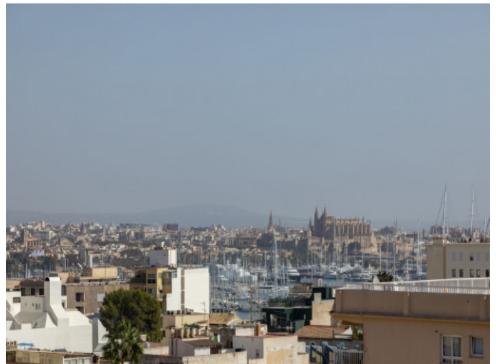
Blick zur Kathedrale in Palma von der Dachterrasse

Alle Angaben nach bestem Wissen. Irrtum und Zwischenverkauf vorbehalten. Dieses Exposé ist eine Vorinformation, als Rechtsgrundlage gilt allein der notariell abgeschlossene Kaufvertrag.