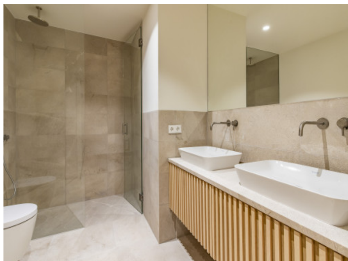
Eines von 2 modernen Badezimmern mit Dusche

Alle Angaben nach bestem Wissen. Irrtum und Zwischenverkauf vorbehalten. Dieses Exposé ist eine Vorinformation, als Rechtsgrundlage gilt allein der notariell abgeschlossene Kaufvertrag.