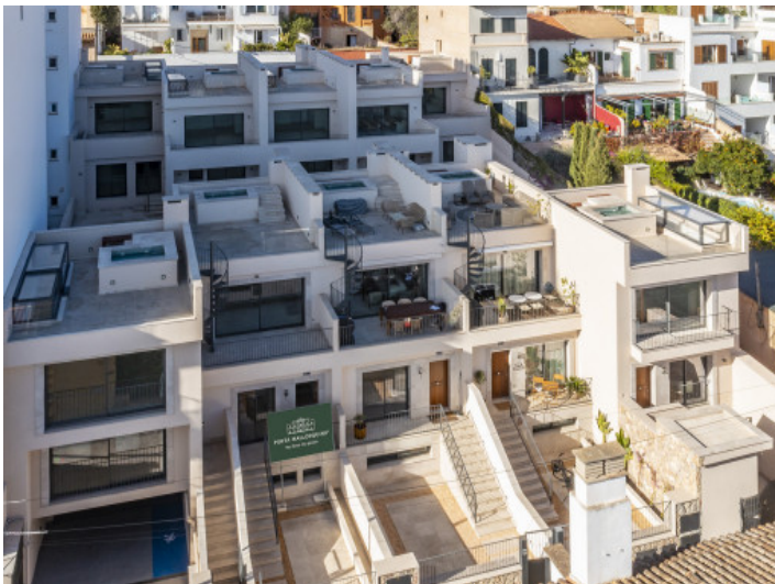
Ansicht des Reihenhauses