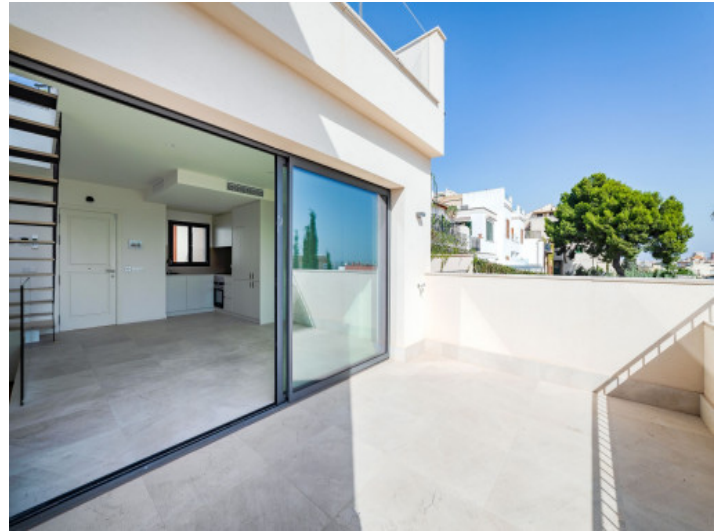
Reihenhaus auf 3 Ebenen