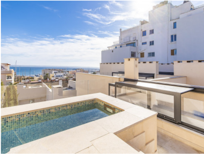
Dachterrasse mit Jacuzzi