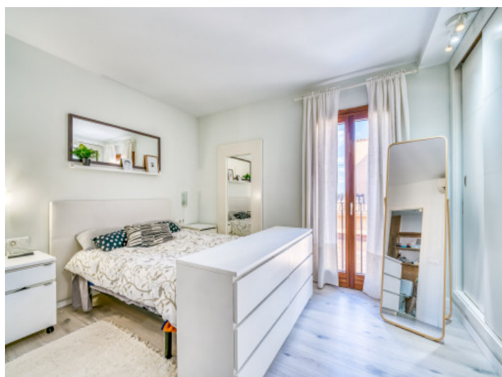
Eines von 3 Schlafzimmern

Alle Angaben nach bestem Wissen. Irrtum und Zwischenverkauf vorbehalten. Dieses Exposé ist eine Vorinformation, als Rechtsgrundlage gilt allein der notariell abgeschlossene Kaufvertrag.