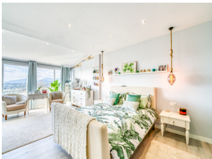
Hauptschlafzimmer mit Panoramablick