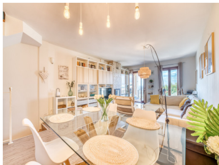
Wohn-und Essbereich mit Terrasse