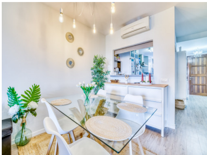
Blick zur halb-offenen Küche