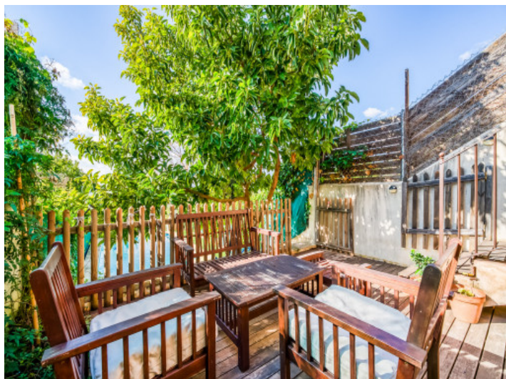
Private Terrasse mit Grillbereich