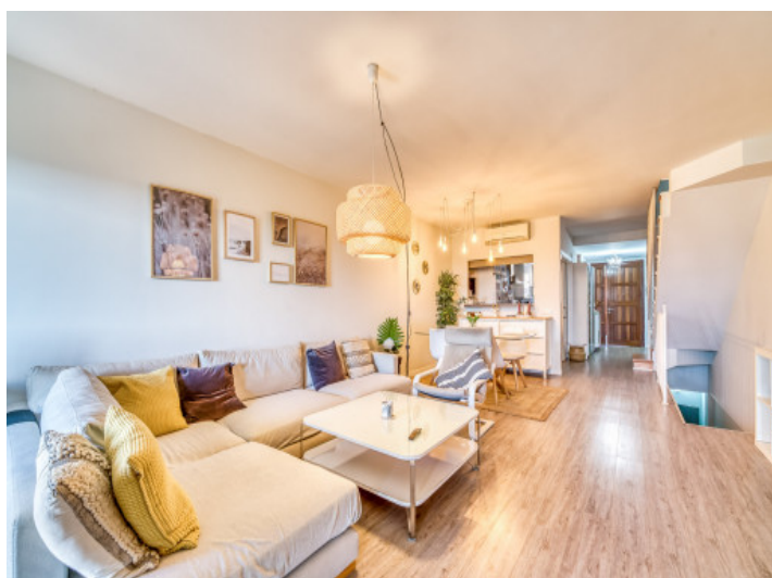
Offener Wohn-und Essbereich