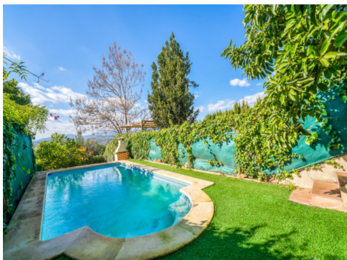
Schöner Garten mit Pool