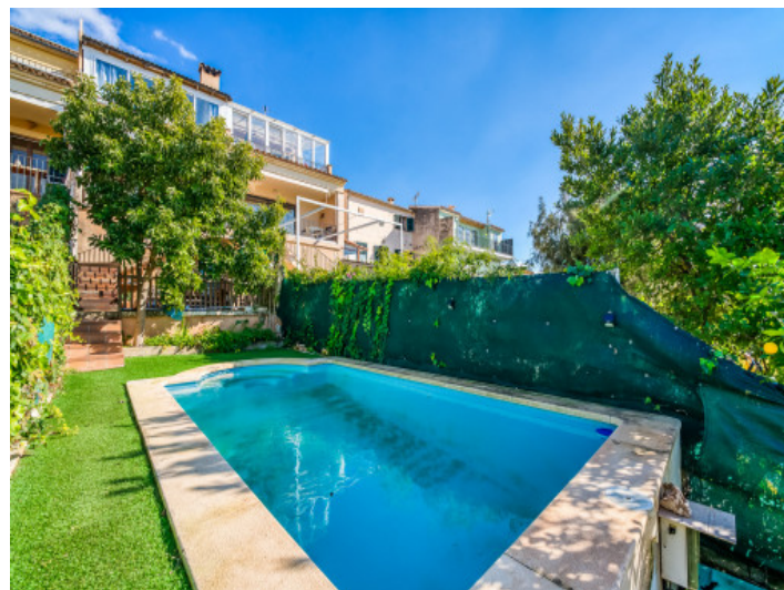
Ein paar Stufen führen zum Poolbereich