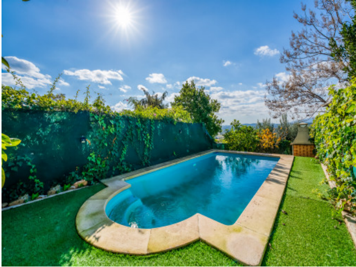
Sonniger Pool-und Gartenbereich