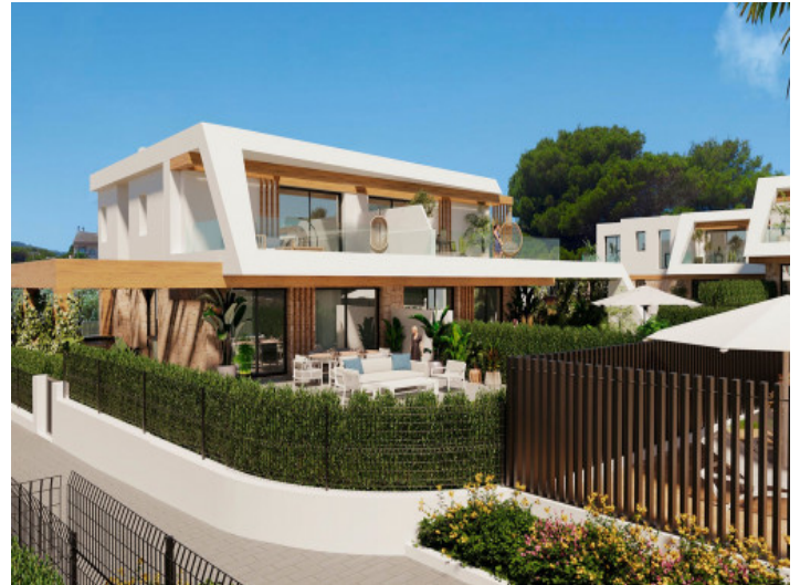
Außenansicht des Reihenhauses