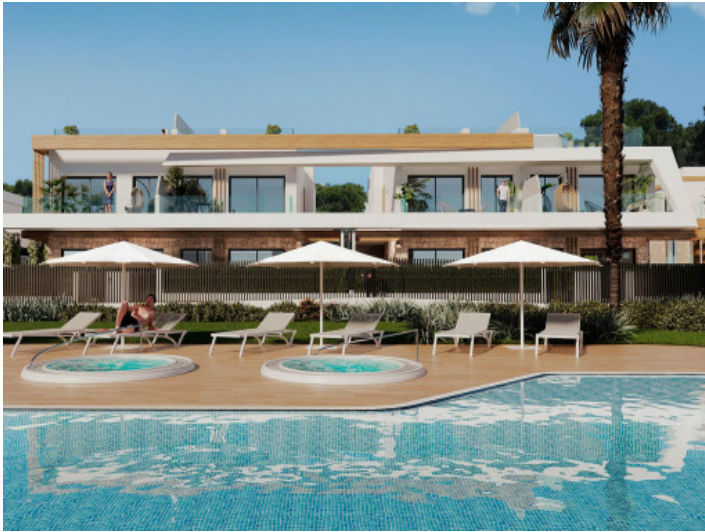
Gemeinschaftspool mit Sonnenliegen