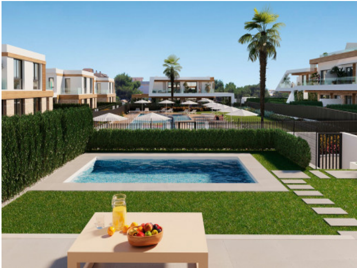
Neubau Doppelhaushälfte mit privatem Pool in Cala Ratjada