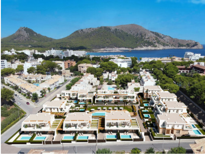
Umgebung der Wohnanlage

Alle Angaben nach bestem Wissen. Irrtum und Zwischenverkauf vorbehalten. Dieses Exposé ist eine Vorinformation, als Rechtsgrundlage gilt allein der notariell abgeschlossene Kaufvertrag.