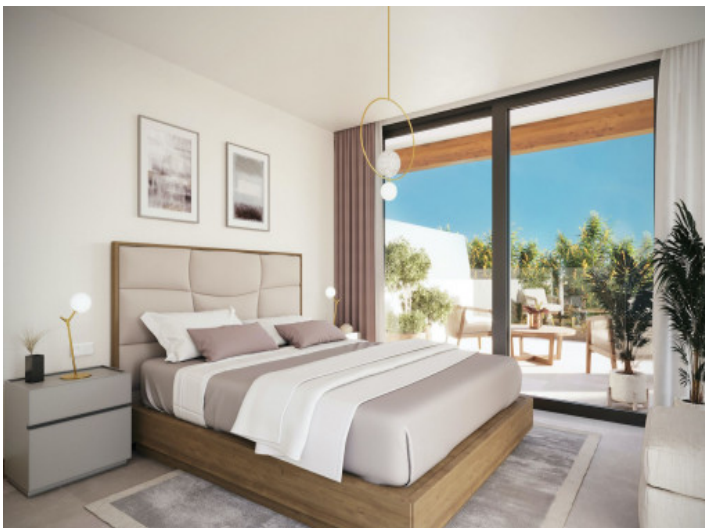
Helles Schlafzimmer mit Terrasse