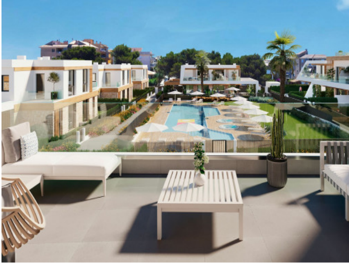
Balkon mit Chill-Out Bereich