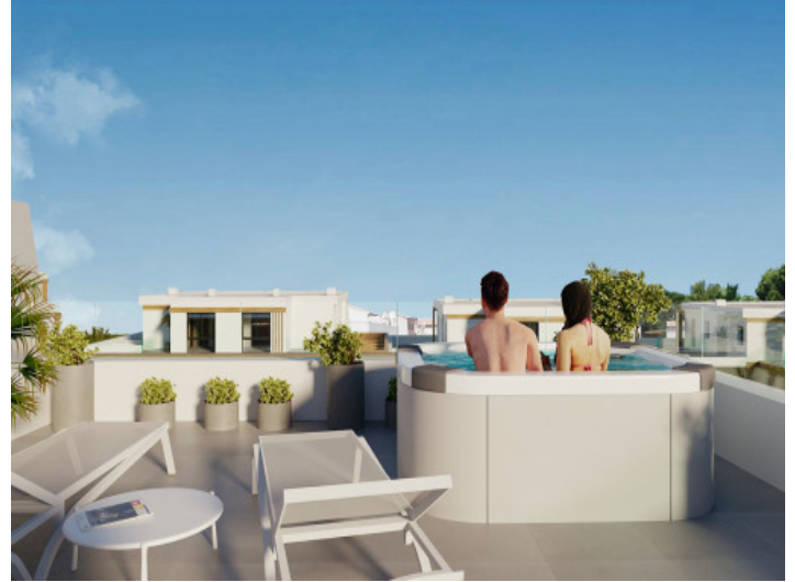
Jacuzzi auf der Dachterrasse