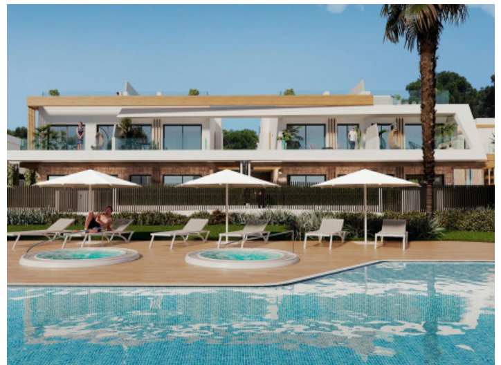
Gemeinschaftspool mit Sonnenliegen

Alle Angaben nach bestem Wissen. Irrtum und Zwischenverkauf vorbehalten. Dieses Exposé ist eine Vorinformation, als Rechtsgrundlage gilt allein der notariell abgeschlossene Kaufvertrag.