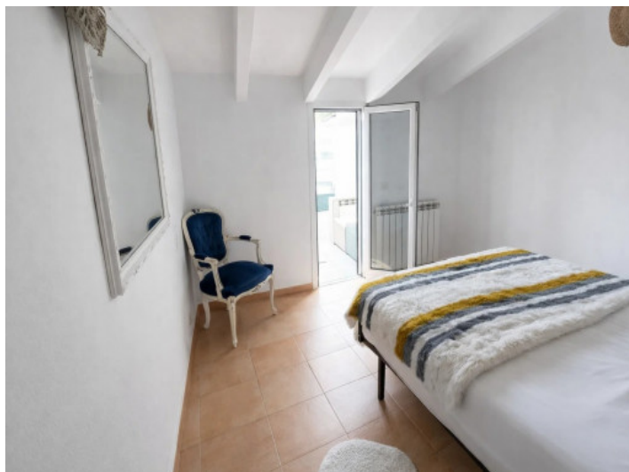
Oberes Schlafzimmer mit Terrasse